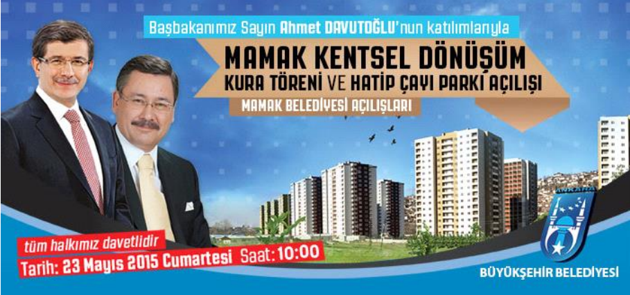
Şekil 2. Ankara Büyükşehir Belediyesi Mamak Hatipçayı Parkı'nın Açılış Töreni İlanı

Ankara'da yeni inşa edilen ya da kurgulanan [Ankapark, Göksu Park, Harikalar Diyarı gibi] kentsel parkların üretim ve sunum süreci ve kentin tarihsel-doğal dokusunun önemli parçası haline gelmiş [Eymir Gölü, Mogan Gölü, Dikmen Vadisi, Hatip Çayı, AOÇ, Gençlik Parkı ve Güvenpark gibi] büyük ya da merkezi kentsel yeşillere yapılan müdahaleler yeşil alanın temsil mekânı olarak ilk durağına işaret etmektedir (İlkay, 2016). Bu durağı üç alt boyutla irdelemek mümkündür. İlk, kullanım değerinin yerini değişim değerine bırakmasıyla birlikte (Lefebvre, 1976; Harvey, 1985), saf kamu yararı için üretildiği bilinen yeşil alanların –doğrudan bir ekonomik ya da politik getirisi olmaksızın– kentsel mekânın yeniden üretilip sunulması sürecinde özellikle konut alanlarının pazarlanmasında bir 'siyasa aracı' olarak kullanıldığı gözlenmiştir. Bu şekilde üretilen 'sahte yeşil alanlar' konut projelerine eklenerek halka sunulmakta (ör: Hatipçayı Kentsel Dönüşüm Parkının sunumu, Bknz. Şekil.2.) ya da parayla girilen, odağında eğlence-dinlenme olan yeni park ve yeşil alan imajı ve tanımıyla halkın algısına –daha açılmadan– sunulmaktadır (ör: Ankapark) (İlkay, 2016).