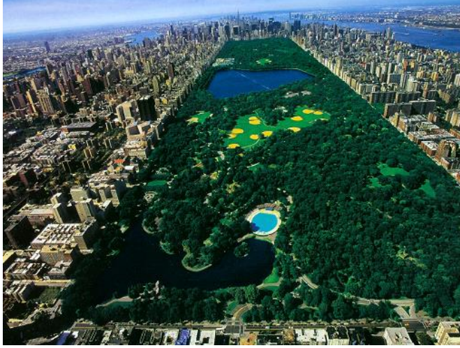
Şekil 1. Central Park, ABD

lemişti (Cranz, 1982). Bunlardan en bilineni ABD’de 1851’de inşa edilen Central Park’tır; devasa bir doğal parça görünümünde olan bu büyük parkın kökeni, meydanlardan ve mahalle arası ortak açık alanlardan –commons– farklıydı (Low, vd., 2005).