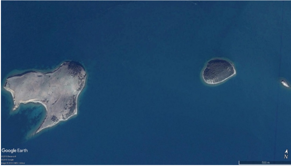
Uydu Görüntüsü-3: Karaçalı Mevkii