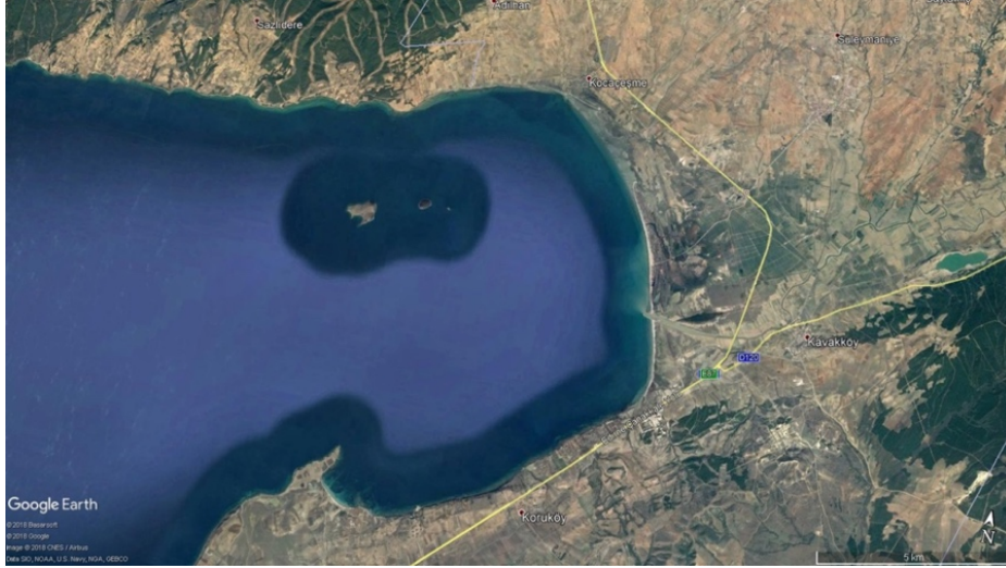
Uydu Görüntüsü-2: Üçadalar