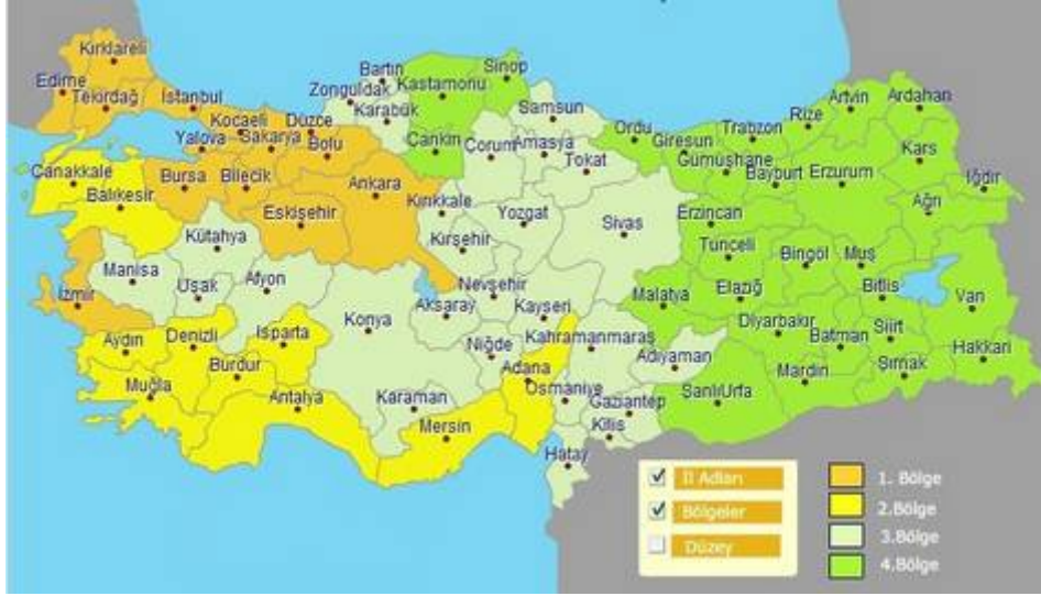
Harita.1.Bölgelere Göre Teşvik Sistemi

Kaynak: http://www.hazine.gov.tr/irj/go/km/docs/documents/Hazine%20Web/Mevzuat/Yeni%20Te%C5%9Fvik%20Sistemi/%C4%B0nteraktif%20Harita.html Ünsaldı Mehmet(2006), Devlet Teşvikleri ve Bölgesel Gelişmişlik Farklılıkları Üzerine Etkileri, Doğu Anadolu Bölgesi Araştırmaları Dergisi, Fırat Üniversitesi, Elazığ