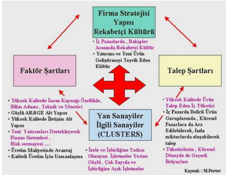
Şekil1.Yatırımcılara Rekabet Üstünlüğü Sağlayacak Etmenler

Bir ülkede yatırım iklimini belirleyen ölçütler olarak; ticaret politikası, vergilendirme, ekonomideki kamu yatırımları, para politikası, sermaye akımları ve yabancı yatırımlar, bankacılık, ücret ve fiyat kontrolleri, mülkiyet hakları, düzenlemeler ve kanunlar, karaborsa olmak üzere on kategoriyi saymaktadır. Değişik ülkeler arasında bu performans farklılıklarını araştırırken, dış ticaret ve yatırımlara açıklığın önemli bir faktör olduğunu fakat “yatırım iklimi” başlığı altında toplanabilecek diğer kurumsal faktörler ve politikaların gelişmekte olan ülkelerin iyi performans gösterebilmeleri için gerekli olduğunu ifade etmektedir (Dollar, Hallward-Driemeier, v.d. , 2003).