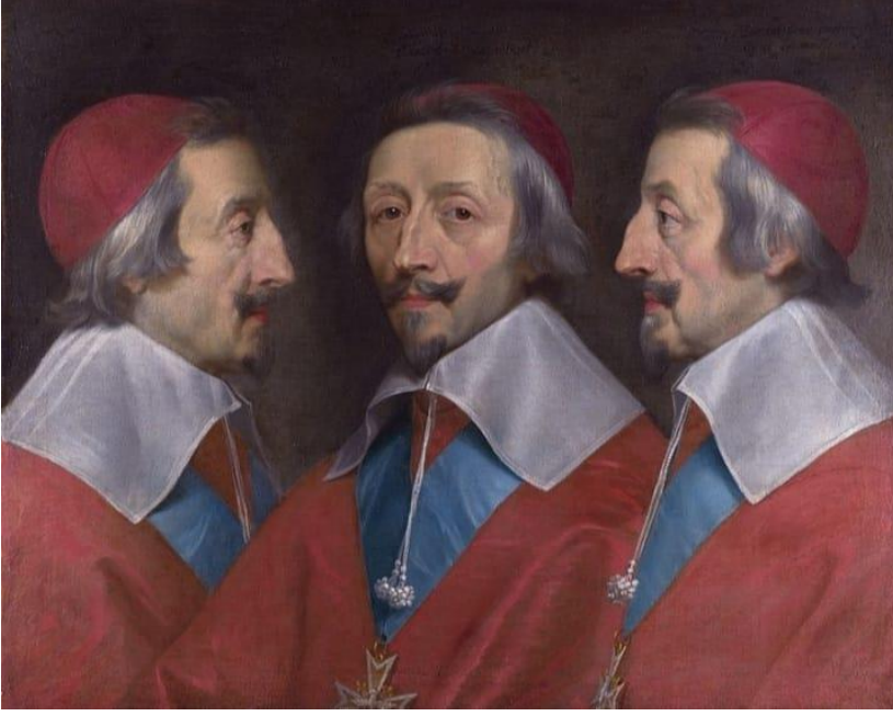
Görsel 4. Kardinal de Richelieu' nun Üçlü Portresi, Philippe de Champaigne, 1640, Ulusal Galeri, Londra (URL 5).