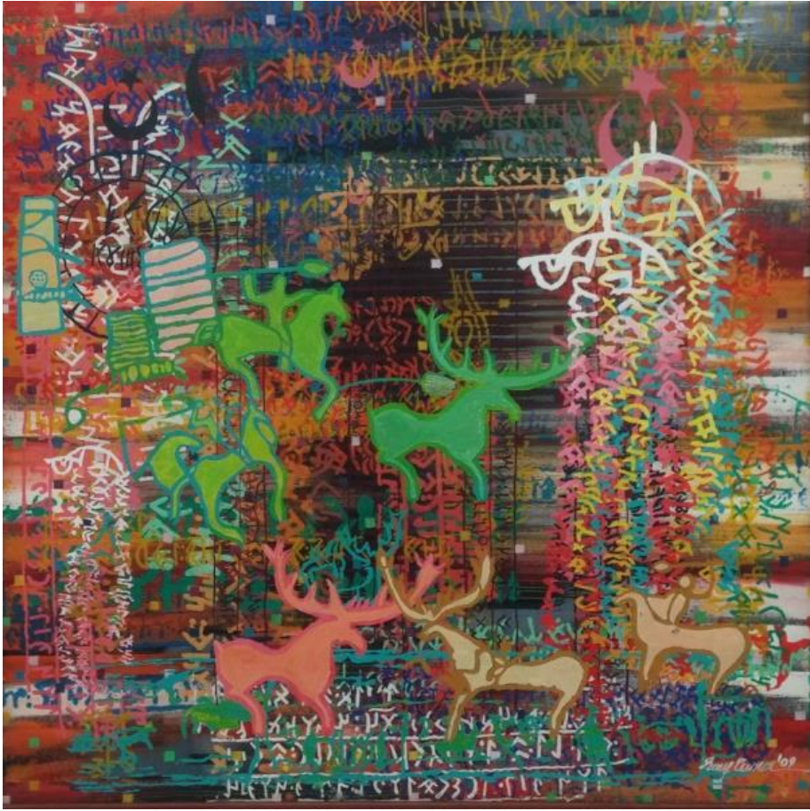
Resim 2 : Rauf Tuncer

Çağdaş Türk Resminde gelenekten beslenen çalışmalarıyla adını duyuran Rauf Tuncer eserlerinde imler ve damgalar kullanmış, bu olgular arasında bağlantılar kurarak çalışmalarını yürütmüştür. Kuramsal anlamda yazıları yazan ve bu doğrultuda eserler üreten sanatçı Türk sanatında çağdaş anlamda özgün bir yer edinmiştir. Türk resminde çağdaşlaşma serüveni içerisinde soyutlama ve ezeme eğilimi ile nesnesiz sanat akımında öncü olarak kabul edilen sanatçılardan birisi olmuştur. 1950'lili yıllarda sonra yayılan nesnesiz sanat olarak adlandırılan non-figüratif eğilimi ile dikkat çekmektedir. (Resim 2)