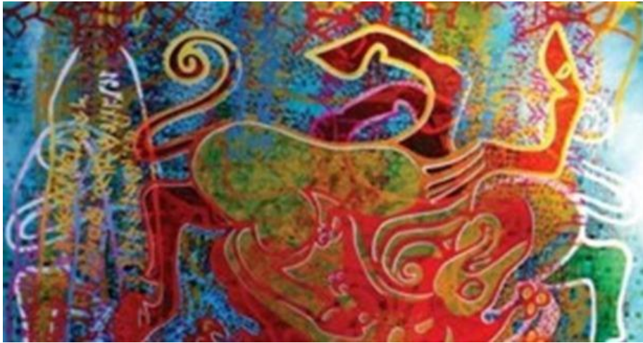
Resim 4 : Rauf Tuncer

Eserlerinde başta saymalı taşlar olmak üzere, balballar, kaya resimleri, yazılı taşlar, hun kurgan bulutlarındaki damgalardan yola çıkarak oluşturduğu kompozisyonlarında hayvan mücadeleleri geçmişte olduğu gibi stilizasyon içerisinde kullanılmıştır. Resim 2 ve resim 3 görsellerinde bu kompozisyonlar net bir şekilde görülebilmektedir. Kaligrafik öğelerinde fon olarak resmin tamamına yayılması saymalı taşların zeminsel olarak doğrudan kullanımına yer vermektedir. Yeni ve çağdaş olan bu kompozisyon yaklaşımı renk ve biçim diliyle zenginleşerek eserleriyle izleyiciyi farklı bir armonik yolculuğa çıkarmaktadır.