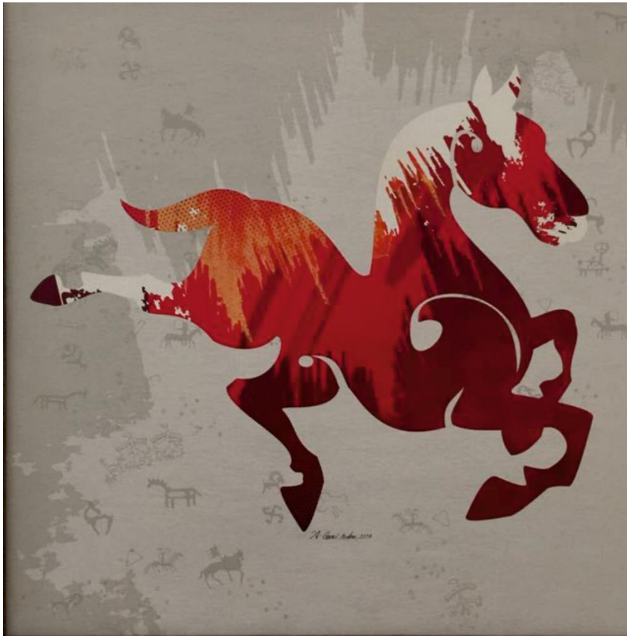
Resim 7: Abdülgani Arıkan