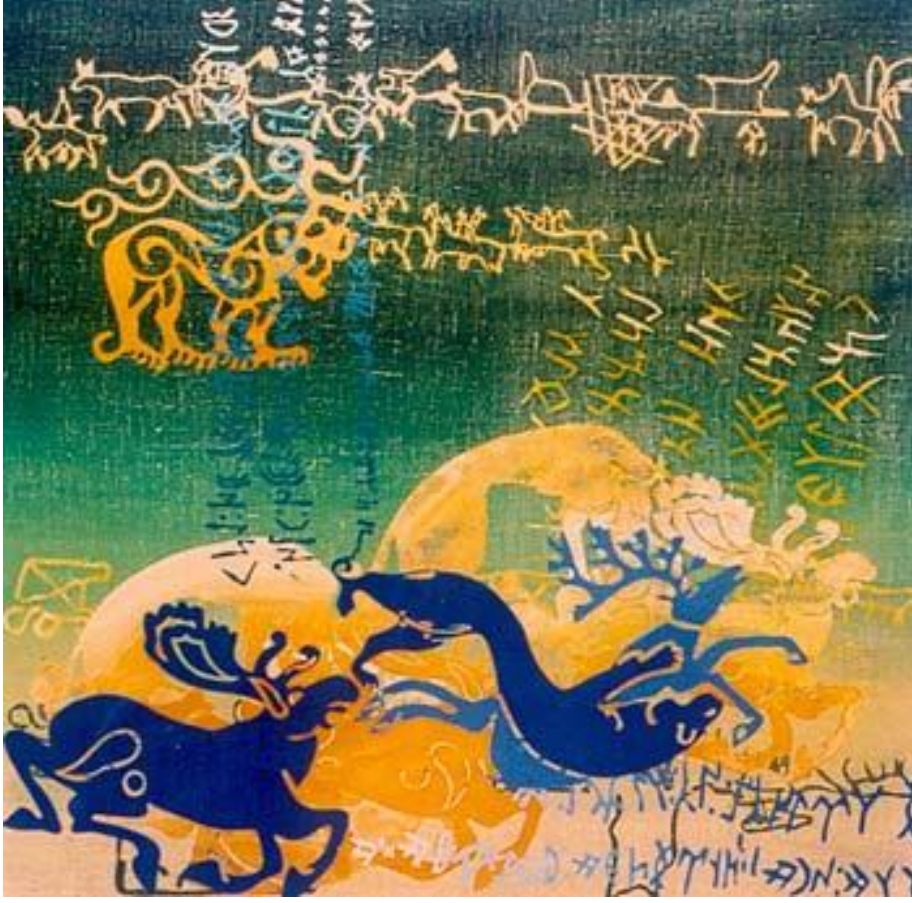
Resim 3 : Rauf Tuncer

Eserlerinde başta saymalı taşlar olmak üzere, balballar, kaya resimleri, yazılı taşlar, hun kurgan bulutlarındaki damgalardan yola çıkarak oluşturduğu kompozisyonlarında hayvan mücadeleleri geçmişte olduğu gibi stilizasyon içerisinde kullanılmıştır. Resim 2 ve resim 3 görsellerinde bu kompozisyonlar net bir şekilde görülebilmektedir. Kaligrafik öğelerinde fon olarak resmin tamamına yayılması saymalı taşların zeminsel olarak doğrudan kullanımına yer vermektedir. Yeni ve çağdaş olan bu kompozisyon yaklaşımı renk ve biçim diliyle zenginleşerek eserleriyle izleyiciyi farklı bir armonik yolculuğa çıkarmaktadır.