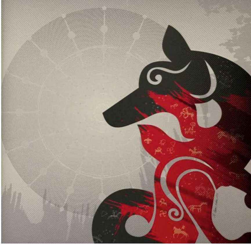
Resim 6 : Abdülgani Arıkan