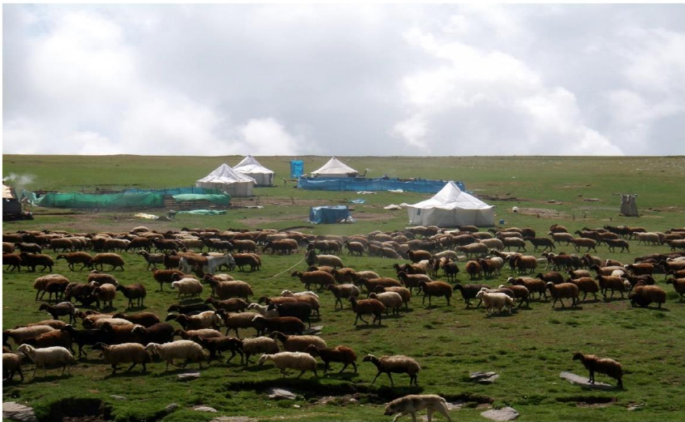
Şekil 1. Göçebelerin yayla ve mera alanındaki yaşamı (Savaş, 2019).

Göçebe topluluklar genellikle tabiata derin bir saygıyla yaklaşırlar ve tabiat ile uyum içinde yaşama stratejileri geliştirmişlerdir. Bu davranışın temelinde ekonomik anlamda hayvancılığa dayalı bir geçim modeli söz olduğundan, tabiatın sunduğu imkânlar doğrultusunda bireylerin yaşamının sürdürülebilirliği de tabiata bağlı olup simbiyotik bir ilişki söz konusudur. Aşağıda yer alan görselde, göçebelerin ilkbahar-yaz aylarını geçirdiği yayla ve mera alanları yer almaktadır.