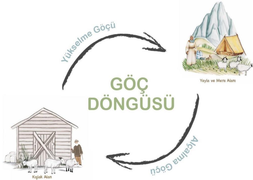
Şekil 3. Kışlak ve yazlık alanlar arasında gerçekleşen göç döngüsü.

Yükselme göçünün başladığı Nisan-Mayıs aylarında yayla ve mera alanlarına göç hareketi öncesinde haneden birkaç kişi alana giderek bir önceki yıl göçerek terk edilen çadır alanını düzenlemektedir. Genellikle yapılan bu düzenlemeler ile göçebe topluluklar her yıl aynı çadır alanını kullanmaktadır. Göç hareketi için gerekli hazırlıklar yapıp eksik olan materyaller temin edilip, oğlak ve kuzular için yemler alındıktan sonra göç hareketi başlamaktadır. Yükselme göçüyle yayla ve meralarda otlatılan göçebe hayvanlar, sonbahar mevsiminin etkisinin hissedilmeye başlamasıyla birlikte kışın sert koşullarından etkilenmemek için kışlak alanlara doğru alçalma göçü gerçekleştirmektedir. Oluşan bu göç döngüsünde göçebe Sarıkeçili Yörük topluluğu yayla ve meralar ile kışlak alanlarda göç ederek yerleştiği alanları “Yazlık Yurt” veya “Oturak Yurdu” şeklinde tanımlarken, yükselme ve alçalma göçü esnasında göç güzergâhı üzerinde 3 ile 10 gün arasında kısa süre konaklanan yerlere ise “Konalğa” adını vermektedirler (Armağan, 2018; Yel, 2018).