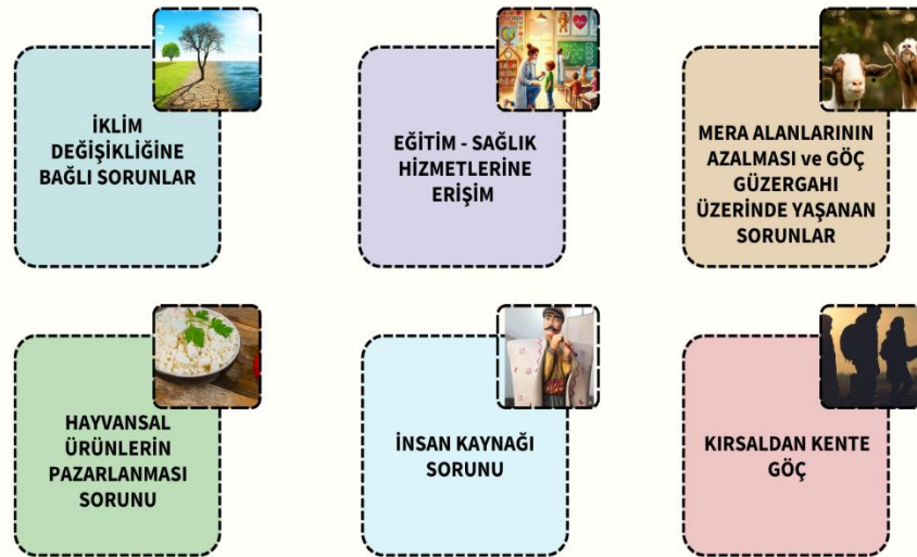
Şekil 4. Göçebe hayvancılığın sorunları.

Göçebe toplulukların göç döngüsünde ilkbahar zamanı kışlaktan mera ve yaylalara ve sonbahar zamanında yazlık alanlardan kışlaklara göçe başlamada karar verme açısından kilit rol oynayan mevsimsel hava şartlarının belirsizliği önemli bir sorun teşkil etmektedir. İklim değişikliğine bağlı mevsimsel değişimlerin beklenen süre zarfında gerçekleşmeyip, aşırı sıcak ve aşırı soğuk hava olaylarının olması, yağış rejiminin düzenini kaybetmesi çözülmesi zor sorunların başında gelmekte olup bu değişiklikler yayla ve mera alanlarında botanik varlığı tehdit etmekte ve su kaynaklarını açısından kısıt oluşturmaktadır.