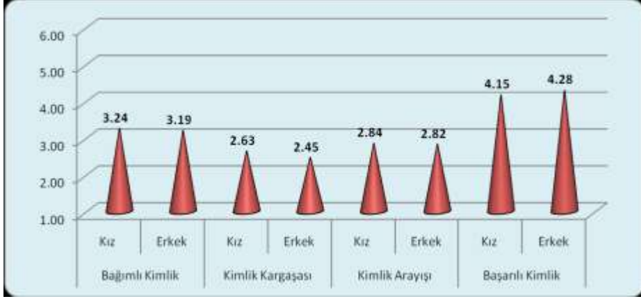
Grafik-1: Cinsiyete Göre Kimlik Statülerini Gösteren Ortalamalar (t-test)

Grafikte de görüldüğü üzere “bağımlı kimlik”, “kimlik karmaşası”, “kimlik arayışı” gibi kimlik statülerinde kadınların ortalamalarının erkeklere göre daha yüksek olduğu bulgulanmıştır. Buna karşın “başarılı kimlik” statüsünde erkeklerin ortalama puanlarının daha yüksek olduğu tespit edilmiştir. Ancak t-testi sonrasında kadınlar ve erkekler arasındaki farkın istatistiki bakımdan anlamlı düzeye ulaşmadığı anlaşılmıştır. Bu bulgudan hareketle kimlik statülerinde cinsiyetin etkili bir faktör olmadığını söyleyebiliriz. Bu bulgu, “kadınların bağımlı ve başarılı kimlik statülerinin erkeklere göre daha fazla ve erkeklerin kimlik karmaşası ortalamalarının kadınlara göre daha yüksek olacağını” öngören hipotezlerimizi desteklememektedir. Oysa son on yılda kimlik statüleri-cinsiyet ilişkisini ele alan pek çok araştırmada cinsiyetin kimlik statüleri bakımından anlamlı bir farklılık yarattığı bulgulanmıştır. Örneğin pek çok araştırmada, (a) erkeklerin bağımlı kimlik ve kimlik karmaşası statülerinde kadınlara (krş. Lewis 2003: 172; Bergh ve Erling 2005; Waterman 2007: 297; Graf, Mullis ve Mullis 2008: 63) (b) kadınların başarılı kimlik statüsünde erkeklere göre daha yüksek puanlar aldıkları bulgulanmıştır (krş. Lewis 2003: 172; Çakır ve Aydın 2005: 856; Waterman 2007: 297).