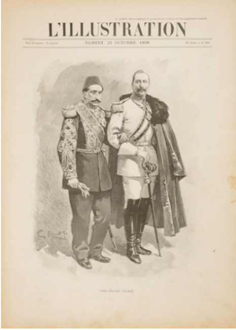
İllüstrasyon 1: II. Abdülhamid ve II. Wilhelm Kol Kola.

çılanmıştır. Alman İmparatoru II. Wilhelm ve Osmanlı İmparatorluğu'nun Padişahı II. Abdülhamid ile arasında gelişen siyasi yakınlaşma, bu dönem askeri, iktisadi ve eğitim alanında işbirliğinin artmasına da vesile olmuştur.