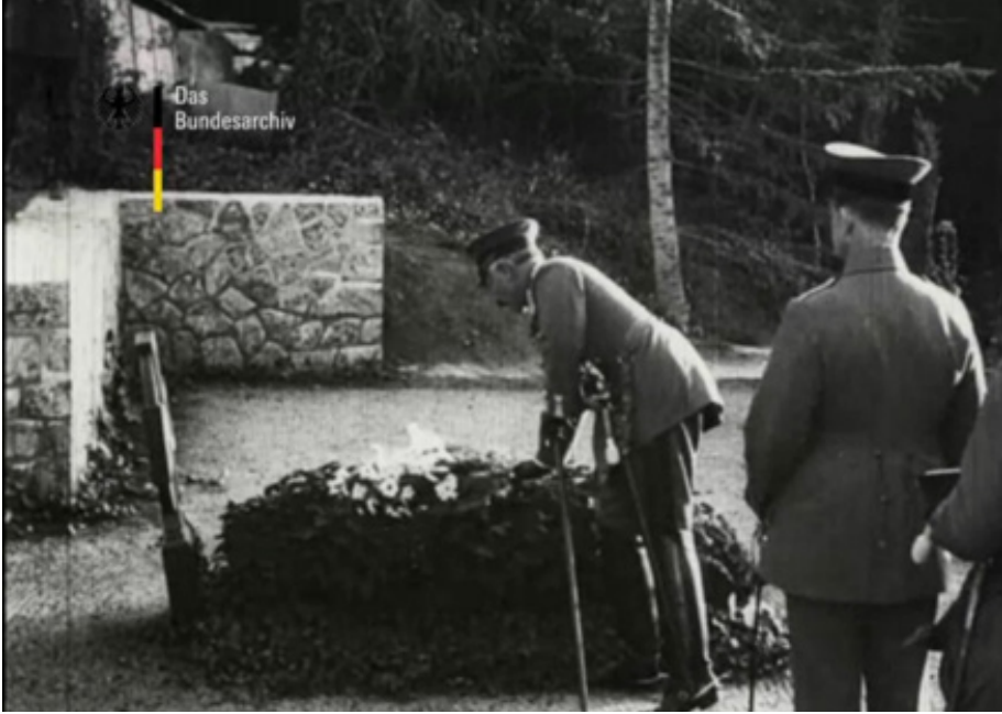
Film Karesi 14: II. Wilhelm Tarabya'da mezara çiçek bırakırken.

Feld Mareşal von der Goltz Paşa ve Baron von Wangenheim'in Mezarları Başında: Norddeutsche Allgemeine gazetesinden edinilen bilgiye göre, İmparator köşkteki kahvaltısının ardından Boğaz üzerinden Tarabya'daki Alman Büyükelçiliği'ne geçmiştir. Elçilikte gerçekleştirdiği resmî görüşmelerden sonra binanın arkasındaki parkta bulunan Colmar von der Goltz Paşa ve Baron von Wangenheim'in mezarlarını ziyaret etmiştir (Norddeutsche Allgemeine, 18 Ekim 1917). Mezar ziyareti sırasında II. Wilhelm'in etrafı incelediği ve bilgi aldığı görülmektedir (Der Kaiser bei unseren türkischen Verbündeten, 1917, BArch.).