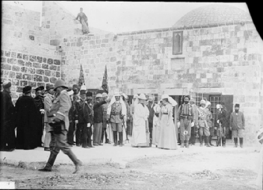
Fotoğraf 2: II. Wilhelm ve Auguste Viktoria Kudüs'te.