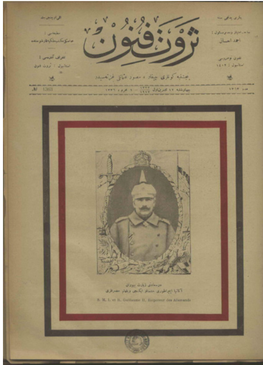
Fotoğraf 3: Alman İmparatoru II. Wilhelm Hazretleri. Kaynak: Servet-i Fünun , 17 Teşrin-ievvel 1333 [17 Ekim 1917], Kapak Sayfası.

leri tarafından kaydedilmiştir. Osmanlı İmparatorluğu adına MOSD ve Alman İmparatorluğu adına BUFA'nın görüntülediği ziyarete ait bu belge filmleri karşılaştırmalı çözümleyen ve bir görsel tarih okuması olan bu çalışmada her iki kurumun çektiği filmler temel alınmaktadır. MOSD'un çektiği görüntüler Alman İmparatoru'nun Dersaadet'e Gelişi (1917) ve BUFA'nın çektiği film Der Kaiser bei unseren türkischen Verbündeten (İmparator Türk Müttefiklerimizle Birlikte, 1917) adını taşımaktadır.