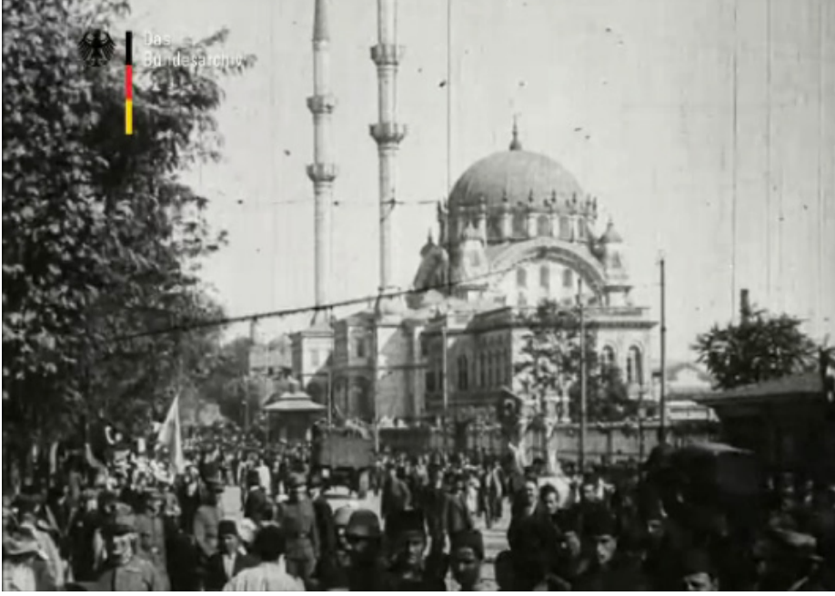
Film Karesi 10: İmparator'u ve Sultan'ı karşılayan halk.

Bu tercih farklılığı oluşturduğu anlam açısından ilginçtir, çünkü MOSD operatörünün çektiği levhada Sultan ile birlikte halkın gösteril(e)memiş olması, BUFA'nın çektiği versiyonda ise tebaanın görünüyör oluşu politik nedenler kadar teknik ve yetkinliğe dayalı nedenlere de bağlı olabilir. Ancak bu kamera açısı ve çerçeveleme, ister politik, ister yetkinlik ve tekniğe dayalı bir seçim olsun, iki ordu film birimi arasında bir ayrıma işaret etmektedir.