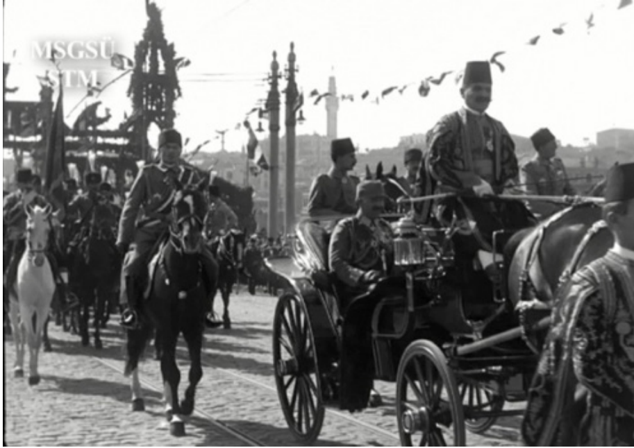
Film Karesi 12: İmparator II. Wilhelm ve Sultan V. Mehmed Reşad Galata Köprüsü'nden Çıkarken.

Yeni Camii'nin görüntüye girmesiyle birlikte kameranın Karaköy tarafına geçerek kalabalığı çekmeye devam ettiği anlaşılmaktadır. MOSD operatörleri ise saltanat arabası Karaköy çıkışından dönerken II. Wilhelm'in saltanat arabasından halka selam vermesini, diyagonal açıdan çekmiştir; bu detay BUFA tarafından çekilmemiştir.