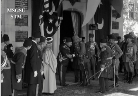
Film Karesi 6: MOSD'un çektiği Sirkeci Garı'ndaki merasim görüntüsünden bir kesit.

Majesteleri İmparator'un Maiyeti'nin Tanıştırılması: Adını taşıyan ikinci arayazıyla açılan bu levhada BUFA operatörü Sultan'ın Alman yetkililerle selamlaşmasını gösterirken bu tanışma MOSD'un çektiği görüntüye yansımakla birlikte, kişiler daha uzaktan görülebilmektedir.