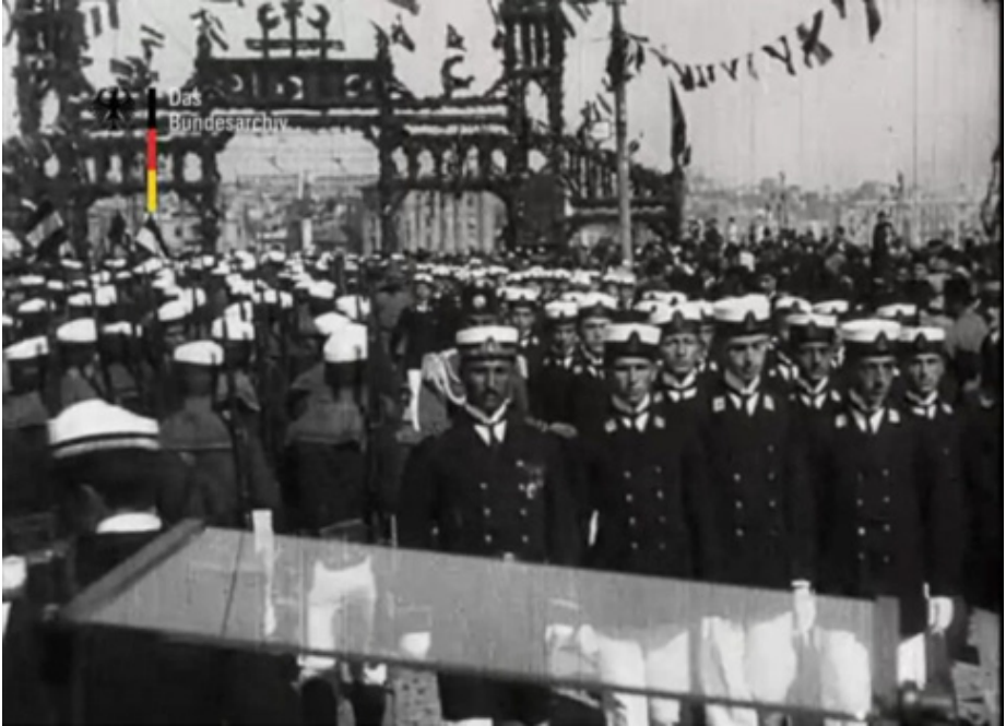
Film Karesi 11: Galata Köprüsü'ndeki Karşılama Merasimi.

Galata Köprüsü Üzerinde, Arka Planda Pera: Bu levhada Galata Köprüsü'ne geçiş yapan BUFA görüntülerinde, Eminönü'nde duran kamera karşıda Galata Kulesi'ni görmektedir. Konu köprü'nün üzerindeki resmi geçittir. Operatör, İmparator ve Sultan'ı karşılayan kalabalığı ve kortejleri çekmiştir. Çekim, kalabalığın arasında hareket eden bir otomobilin içinden gerçekleşmiş, dolayısıyla bir kaydırma çekim yapılmıştır. Aşağıdaki görüntü kesiti Galata Köprüsü'nde misafiri İmparator II. Wilhelm'i karşılayan kortej ve kalabalığı gösterirken, fotoğrafın ön kısmında operatörlerin köprüdeki çekimleri gerçekleştirdikleri arabanın camı da görüntüye girmiştir.