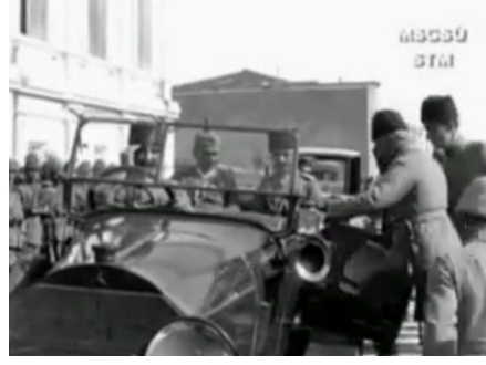
Film Karesi 22: MOSD operatörünün bulunduğu yer.

seren türkischen Verbündeten, 1917, BArch). Ayasofya ziyareti sırasında Osmanlı mareşali üniforması taşıyan İmparator ve maiyetini Ayasofya'da gösteren görüntüler her iki kurum tarafından çekilmiştir. İmparator'u bir lahiti incelerken çeken MOSD operatörü çekimi mekânın içinden yapmıştır. Dönem koşullarına göre ışık yetersizliğinden dolayı iç mekânda çekim yapmak zor olmasına rağmen, MOSD operatörünün çektiği II. Wilhelm, görüntülerde net bir şekilde görülebilmektedir (Merkez Ordu Sinema Dairesi, 1917a). BUFA'nın çektiği filmde ise İmparator'un Ayasofya'dan ayrılma anı yansımıştır (Der Kaiser bei unseren türkischen Verbündeten, 1917, BArch).