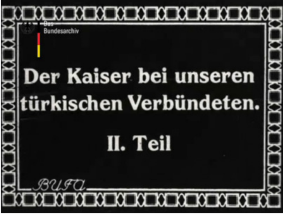
Film Karesi 18: İmparator Türk Müttefiklerimizle Birlikte. II. Bölüm.

kü'ne dönmüş ve köşkte Sultan V. Mehmed Reşad'ı ağırlamıştır. Görüşmenin ardından kayıkla Sarayburnu'na geçerek Topkapı Sarayı'nı gezmiştir. İmparator'un Topkapı Sarayı'na gitmesi ikinci bölümün ilk levhasında görülebilmektedir. Seine Majestät überquert in dem Staatskaik den Bosphorus... (Majesteleri Saltanat Kayığında Boğaz'ı Geçmektedir...), ... und fährt zur Besichtigung nach dem alten Serail (...Ve Eski Sarayı Gezmek Üzere Yola Çıkar) başlıklarını taşıyan levhalar İmparator'un kayıkla Sarayburnu'na doğru yola çıkışını göstermektedir (Der Kaiser bei unseren türkischen Verbündeten, 1917, BArch). II. Wilhelm, Topkapı Sarayı ziyaretinden sonra Pera üzerinden Alman elçiliğine giderek Alman resmî yetkilileriyle görüşmelerde bulunmuş, ardından kendisi adına düzenlenen ziyafete katılmak üzere Merasim Köşkü'ne geçmiştir ( Osmanischer Lloyd , 17 Oktober 1917, s. 1-2). İmparator'un Topkapı Sarayı'nı ziyaretini gösteren görüntünün akabinde Mecidiye Köşkü'nde verdiği kahve molası görülebilmektedir. Bu levha Eine Kaffepause im Medschidkiosk (Mecidiye Köşkü'nde Kahve Molası) başlığını taşımaktadır (Der Kaiser bei unseren türkischen Verbündeten, 1917, BArch). Operatör, terasta kahve içip sohbet eden İm-