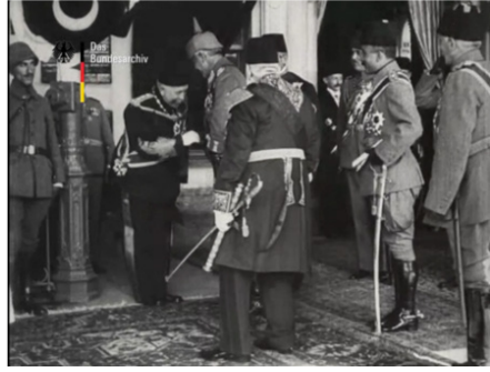
Film Karesi 7: BUFA'nın çektiği Sirkeci Garı'ndaki merasim görüntüsünden bir kesit.

Benzer açılar ve noktalardan MOSD'un daha uzak BUFA'nın daha yakın bir şekilde merasimin görüntüsünü alması, Osmanlı yetkililerinin ziyaretin kendisine odaklandıkları ve ziyaret akışını görüntüye yansıtmak istediklerini, Alman yetkililerin ise başta hükümdarlar olmak üzere kişilere odaklandıklarını göstermektedir. 15 Ziyaretin görüntülerinin