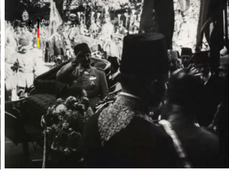
Film Karesi 9: BUFA operatörünün çekim açısı. Kaynak: Der Kaiser bei unseren türkischen Verbündeten, 1917, BArch.

çekmiştir. İmparator ve Sultan'ın, İmparatorluk arabasına binışinin sağ kanattan çekilmesi kişileri daha açık bir şekilde görmeyi sağlamıştır. MOSD operatörünün ve heyetin solunda duran BUFA operatörünün ise kamera ile görüntü arasına giren kişilerden dolayı önü kapanmış, Perihan'ı zorlukla, İmparator ve Sultan'ı ise oldukça dar bir çerçeveden çekebilmiştir. Aşağıdaki levhalar her iki birimin kamera açılarını göstermektedir (Bkz. Film Karesi 8 ve 9).