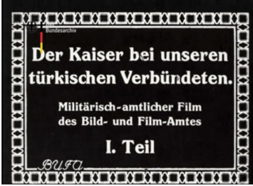
Film Karesi 4: Filmin Açılış Levhası: İmparator Türk Müttefiklerimizle Birlikte. I. Bölüm.

BUFA yapımı filmin ilk levhasında, filmin adı ve yapımcısına ait bilgiler bulunmaktadır.