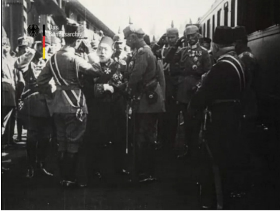
Film Karesi 5: Sultan V. Mehmed Reşad ve Enver Paşa, İmparator II. Wilhelm'i Sirkeci Garı'nda Karşılarken.

Karşılama merasiminin ardından Sultan ve İmparator merasim kıtasını selamlayarak, kendilerini bekleyen yüksek makamlı yetkililerden oluşan heyet ile tanışmak üzere ilerlemektedirler. Heyet ile tanışma sahnesine geçilirken gerçekleşen mekân değişimi arayazı ile bölünür ve bu arayazı görüntülerin başlıktan sonraki ilk arayazısıdır.