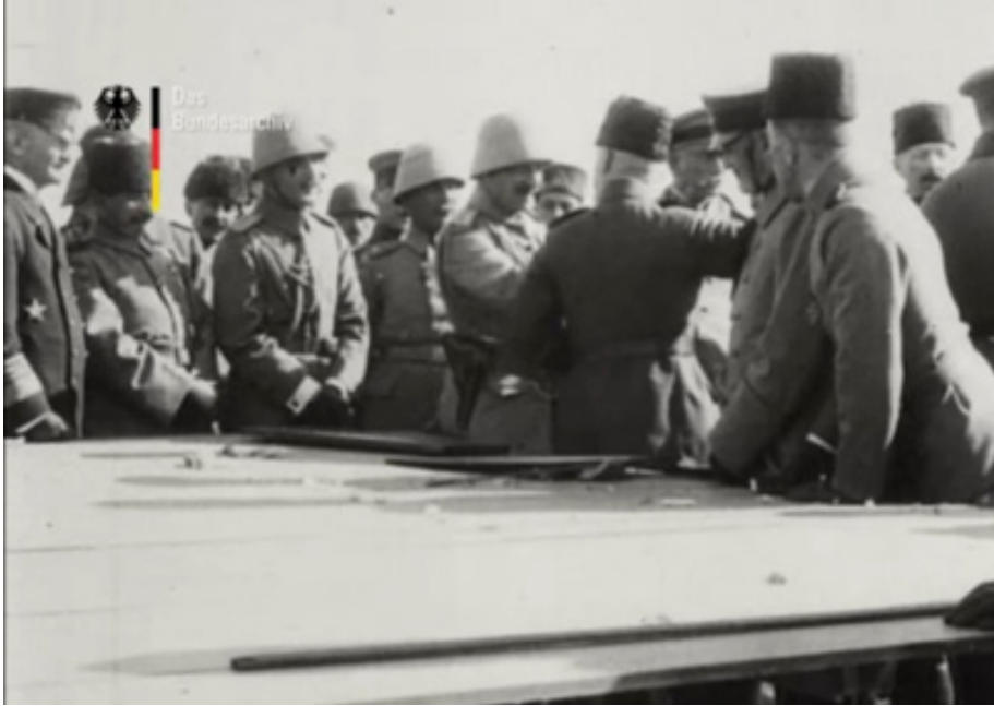
Film Karesi 19: General, II. Wilhelm'e Bilgi Verirken.

Ardından Gelibolu Yarımadası'na geçen II. Wilhelm, kendisine eşlik eden heyet ile birlikte başta Arıburnu ve Anafartalar olmak üzere diğer savaş alanlarını gezmiştir. 19 Teşrin-i evvel 1333 [19 Ekim 1917] tarihli İkdâm, Sabah ve Tanin gazetelerinde II. Wilhelm'in öğle yemeğini çadırda yediği yazarken (Karacagil, 2013, s. 123), filmin arayazısından Arıburnu'nda çadırda kahvaltı edildiği bilgisi edinilebilmektedir (Der Kaiser bei unseren türkischen Verbündeten, 1917, BArch.). Arıburnu sahilinde Osmanlı askerlerinin nöbet tuttuğu yerleri ziyaret edip gören İmparator sonraki levhada Cevat Paşa kendisine, Kilid-Bahir'de gerçekleşen muharebeler üzerine bilgilendirirken görülmektedir. Bu karede Cevat Paşa, arabada oturan İmparator ve Enver Paşa'ya açıklamalarda bulunmaktadır. Arabanın çevresinde ise Liman von Sanders ve diğer askeri yetkililer görülebilmektedir (Der Kaiser bei unseren türkischen Verbündeten, 1917, BArch.). İmparator akşam saatlerinde Yavuz Zırhlısı'na dönmüştür. Ertesi sabah zırhlıdan ayrılmadan evvel kendisi için güvertede bir bayrak töreni düzenlenmiş, zırhlı İstanbul'a demir attıktan sonra İmparator, zırhlıdan inmeden önce saat 8'de subay ve erlerin bazılarına "demir haç" nişanı takmıştır. Verlassen des Schiffes (Geminin Terk Edilmesi) arayazısıyla gemiden ayrıldığı anlaşılan İmparator, Alman Milli Marşı'nın eşliğinde