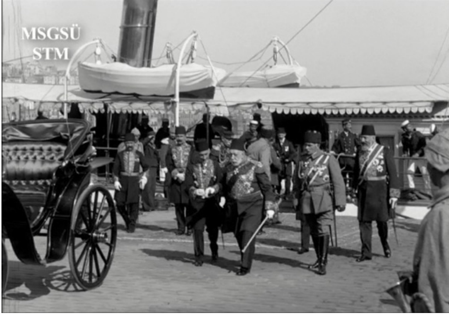
Film Karesi 13: Sultan V. Mehmed Reşad Dönüş Yolunda.

İmparator'u Yeni İkametgâhı'ndaki İlk Ziyaretinden Dönen Sultan Hazretleri: Beşiktaş'ta çekilen aşağıdaki görüntüde Sultan V. Mehmed Reşad, İmparator'dan ayrıldıktan sonra Sultan kayığından inerek Sultan arabasına doğru yönelirken görülmektedir. Sabah ve Tanin gazetelerinin 16 Teşrin-i evvel 1333 [16 Ekim 1917] tarihli nüshalarından edinilen bilgiye göre Sultan V. Mehmed Reşad, Dolmabahçe Sarayı'na dönmüştür (Karacagil, 2013, s. 119) ve bu levha ziyaretin kronolojik dizilimine göre Sultan'ın Dolmabahçe Sarayı'na dönüşüne işaret etmektedir. Ancak MOSD'un çektiği görüntülerde Sultan'ın kayıktan indiği yerde plan boyunca arkadan Galata Kulesi görülebilmektedir. Dolayısıyla Sultan'ın kayıktan indiği yerin Beşiktaş ve civarı olup olmadığı açık değildir. Plan, daha çok Eminönü civarından çekim yapılmış olma ihtimaline işaret etmektedir.