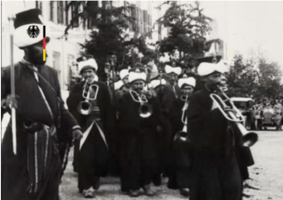
Film Karesi 23: BUFA'nın filme aldığı Mehter Takımı.

Yeniçeriler Veda Sırasında Majestelerinin İkametgâhi Merasim Köşkü'nün Önünde Çalarken: İmparator son gününde Merasim Köşkü'nden ayrılırken, BUFA operatörleri köşkün önünde veda amacıyla çalan Mehter Takımı'nı uzunca görüntüye almışlardır. Mehter Takımı'nın ayrıntılı bir şekilde fotoğraf ve filmle belgelenmesi bizzat II. Wilhelm'in kendi arzusu doğrultusunda gerçekleşmiştir. İmparator, Askeri Müze'yi ziyareti sırasında Ahmed Muhtar Paşa'ya Yeniçeri ordusunun zamanında taşıdığı askeri kıyafetlere ve Mehter Takımı'nın çaldığı müziğe hayran kaldığını dile getirmiştir. II. Wilhelm Merasim Köşkü'ne döndüğünde, Mehter Takımı'nın fotoğraflarının çekilip, filme alınmasını istemiştir ( Osmanischer Lloyd , 23 Oktober 1917, s. 2). Filmin bu levhasında seyirci, Mehter Takımı'nın geçişini görüntüde bütünüyle takip edebilmektedir ( Der Kaiser bei unseren türkischen Verbündeten , 1917, BArch). Mehter Takımı'na gösterilen bu ilgi, Batılı göz için Doğu'yu betimleyen "egzotik" bir ögenin seyirci bakışının aradığı Oryantalist bakışı tatmin etmesidir aynı zamanda.