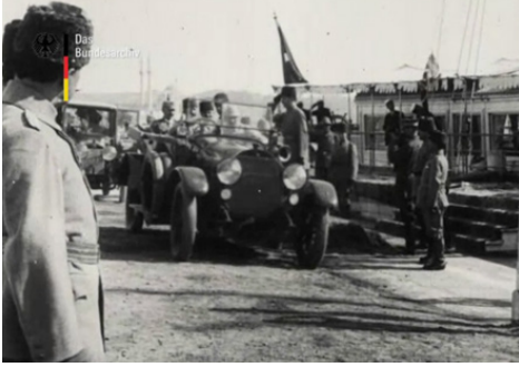
Film Karesi 21: BUFA operatörünün bulunduğu yer.