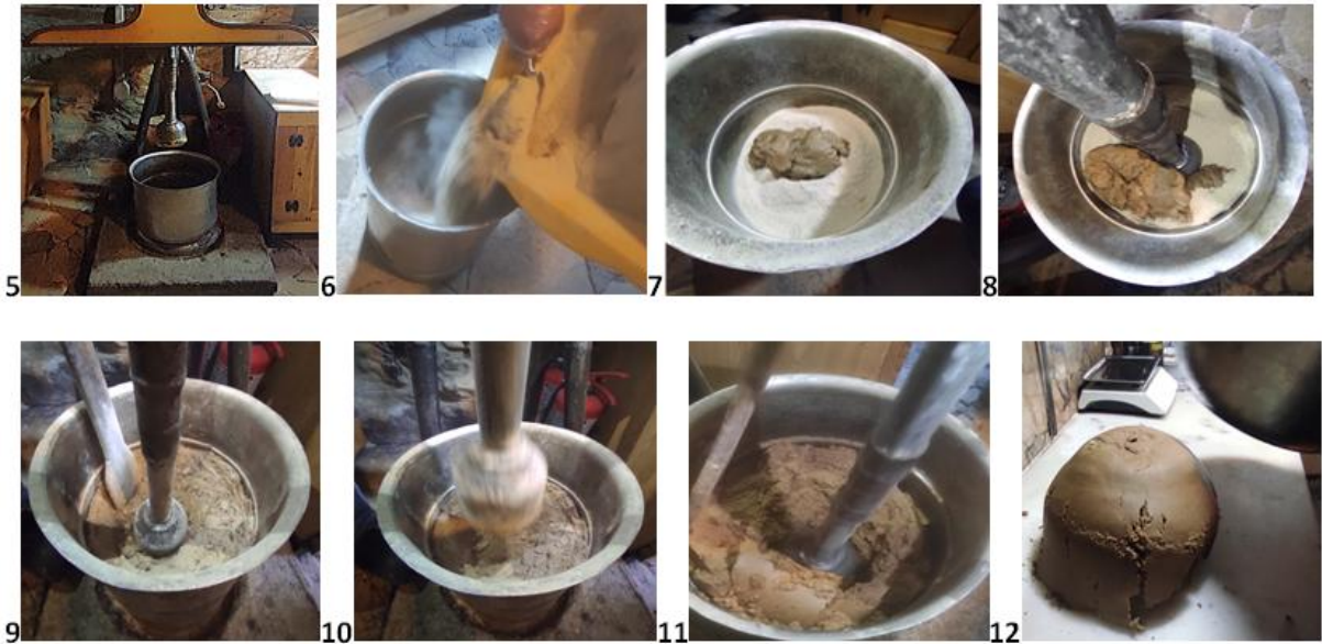
Fotoğraf 2. Lök Tatlısı Üretimi Yapım Aşaması (Fotoğraflar yazarın kendi arşivindedir).

Öğütmenin ardından yapım aşamasına geçilir (Fotoğraf 2). Bu aşamada işletmenin geliştirmiş olduğu makine kullanılmaktadır (5). Hanelerdeki geleneksel üretimde taş dibeklerde demir tokmaklarla dövülen bu tatlı fotoğraf 2'de yer aldığı şekilde paslanmaz çelik derin bir kap içerisinde dövülmektedir. Makinanın haznesi dediğimiz dibek görevi gören cihaza alınan karışım (6,7) homojen bir karışım sağlanana kadar dövülmeye devam edilir. Bununla birlikte dövme işlemi el yordamı ile değil işletmenin geliştirmiş olduğu bir otomasyon sistemi (8) ile belirli bir frekansta yapılmaktadır. Karışım, macun kıvamına gelinceye kadar yaklaşık 3500 ile 5000 arası vuruş ile taş, demir veya tunç dibeklerde dövülür (Coğrafi İşaretler Portalı [CİP], 2026). Bu sayede kas gücü gerektirmeden daha çok miktarda ve daha kısa sürede daha çok ürün elde edilebilmektedir. Dövme işleminin homojen olması için arada karıştırılır (9, 10, 11). Karıştırma tahta spatula yardımı ile gerçekleştirilmektedir (9). Dövme işlemi sonunda tatlı macun haline geldiğinde tatlı hazır hale gelmiş demektir. Macun haline gelen tatlı dibekten çıkarılarak mermer bir tezgâha alınır (12).