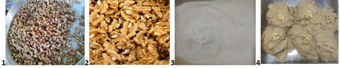
Fotoğraf 1. Lök Tatlısı Üretimi Hazırlık Aşaması.

Lök Tatlısı'nın üretim aşamaları 6769 sayılı Sınai Mülkiyet Kanunu kapsamında 26.01.2023 tarihinden itibaren korunmak üzere 21.08.2023 tarihinde tescil edilerek koruma altına alınmıştır (Coğrafi İşaretler Portalı [CİP], 2026). Geleneksel bir ürün olan Lök Tatlısı ilk defa ticari olarak Lökhanne işletmesi tarafından üretilmeye başlanmıştır. Lök tatlısının üretim yöntemi işletme sahibi tarafından izin alınarak fotoğraflanıp belgelendirilmiştir. Üretim; hazırlık, yapım ve sunum olmak üzere üç aşamadan oluşmaktadır. İlk aşama olan hazırlık aşamasında Fotoğraf 1'de yer verilen fotoğraflarda da olduğu gibi lök tatlısı yapımında coğrafi işaret tescil belgesinde yer alan miktarlardaki dut (1) ve ceviz (2) hazırlanarak öğütülür. Öğütme işlemi sonrası elde edilen dut unu (3) ve ceviz ezmesi (4) karıştırılmak üzere kaba alınır.