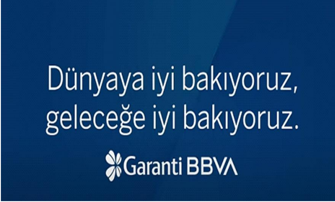
Resim 5. Reklam Filminin Kapanış Sloganı