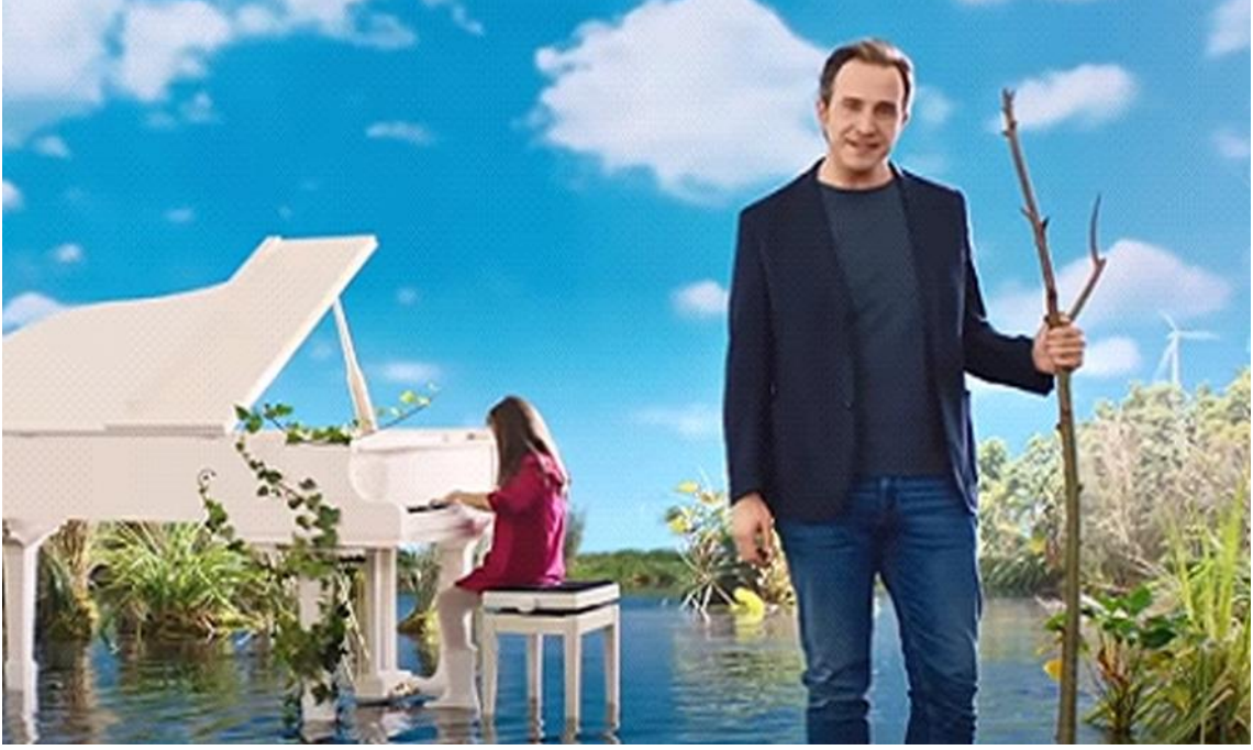
Resim 3. Reklam Filminin Görselleri 3

Konuşmacının anonsları Garanti BBVA'nın çevre duyarlılığını yeniden öne çıkarmaktadır ve bankanın gelecek hedefleri ve yaptırımları vurgulanarak kurumsal itibarın sosyal mesaj içerikli bu reklam filmiyle yansıtıldığı görülmektedir. 3 numaralı resmin göstergeleri ise aşağıdaki tabloda aktarılmaktadır ve diğer göstergelerden farklı olarak bu defa yeşil ve mavi rengi de dikkat çekmektedir. Söz konusu her iki renk de beyazın umut ve temizlik yan anlamlarını huzur ve ferahlık yan anlamlarıyla desteklemektedir.