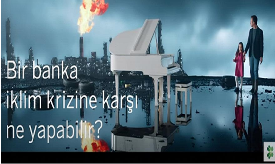
Resim 1. Reklam Filminin Görselleri 1

Bir numaralı resimde yer alan göstergelerin düz anlamları ve yan anlamları ise aşağıdaki tablo içerisinde sunulmaktadır. Bu çerçevede dört ayrı göstergeden bahsetmek mümkündür. Bu göstergeler konuşmacı adam, kız çocuğu, turuncu ve gri. İlgili göstergelerden konuşmacı adam ve kız çocuğunun düz anlamı, insan faktörüdür. Bir diğer düz anlam olan renk faktörü ise turuncu ve gri göstergelerini temsil etmektedir. Konuşmacı adamın yan anlamı olarak bilgilendiriciliği ve motive ediciliği öne çıkmaktadır. Nitekim çevre duyarlılığından ve bankanın iklim krizine karşı gösterdiği çabalardan bahsederken hem bilgi vermektedir hem de kurumsal itibarı ortaya koyma noktasında motive sağlamaktadır. Reklam filminin alt ritmi olan sözsüz müziğin yani piyano sesinin bilgilendirme esnasında coşkuyu ve tempoyu artırdığı ayrıca söylenebilir. Kız çocuğunun yan anlamı da saf, masum ve heyecanlı olmasıdır. Öyle ki reklam filminin teması aslında kız çocuğu üzerinden ve onun duygu ve beklentileri ekseninde ilerlemektedir. Görselde yer alan diğer öğelerin (turuncu ve gri) yan anlamının ise kirliliği temsil ettiği görülmektedir. Fabrika bacasından tüten duman ve ateş, kasveti simgeleyen gri bulutlar ve nihayetinde iklim krizine ortam hazırlayan çevre görünümü bu renklerin yan anlamını net olarak ortaya koymaktadır.