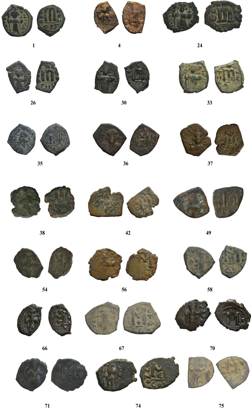
Fig.6 II. Konstans Sikkeleri (kat. no. 1, 4, 24, 26, 30, 33, 35-38, 42, 49, 54, 56, 58, 66-67, 70-71, 74-75)