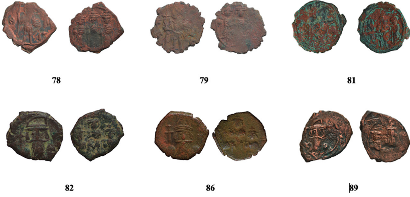
Fig.7 II. Konstans Sikkeleri (kat. no. 78-79, 81-82, 86, 89)