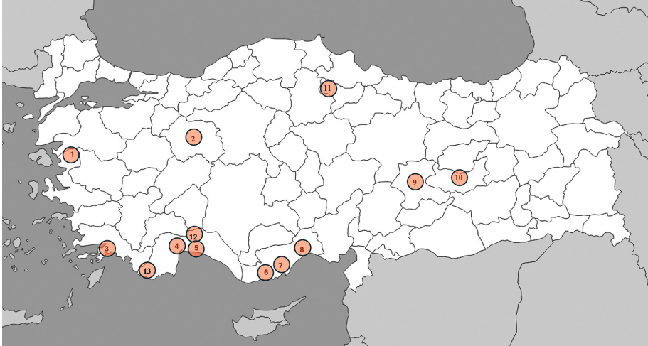
Fig.2 II. Konstans'ın Anadolu'da INPER CONST lejantlı sikkelerinin dolaşımı 1.Pergamon Kazısı, 2. Eskişehir Müzesi, 3. Kaunos Kazısı, 4. Perge Kazısı, 5. Side Kazısı, 6. Kelenderis Kazısı, 7. Anemurium Kazısı, 8. Elaiussa Sebaste Kazısı, 9. Harput Kalesi Kazısı, 10. Malatya Müzesi, 11. Amasya Müzesi, 12. Sillyon, 13. Patara