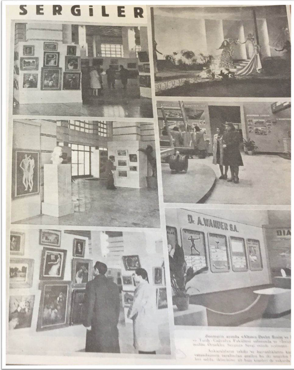
-1945’te DTCF’de açılan “6. Devlet Resim Heykel Sergisi” ve Ankara Sergievi’ndeki “İsviçre Mensucat ve Mamulâtı Örnekler Sergisi”, Radyo , 1 II. Kanun 1945, C.4, S.37, s.7.