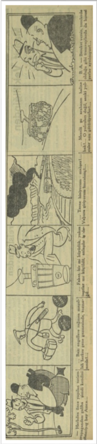
-Akşam, 27.08.1942, s.3.