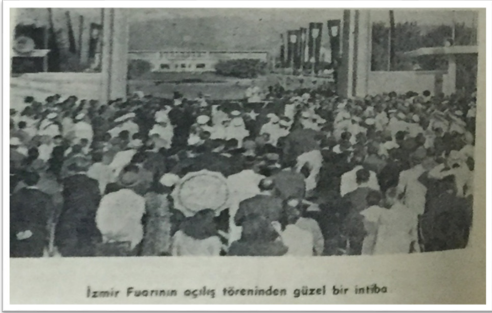
-1940'ta İzmir Fuarı'nın açılış töreni, Akşam , 19.09.1940, s.6.