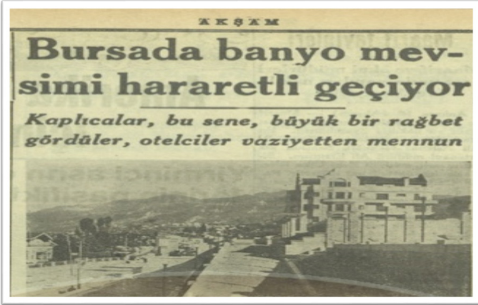
Bursa kaplıcalarının gördüğü ilgiye dair bir haber.