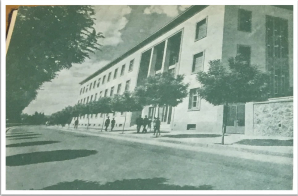
-Ankara Radyoevi, Radyo , 01.12.1941, C.1, S.1, s.36.