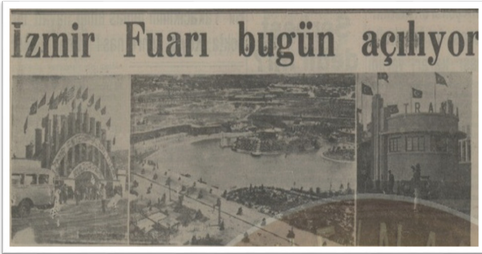
-1941'de İzmir Fuarı'nın açılışına dair haber, Vakit , 20.08.1941, s.1.