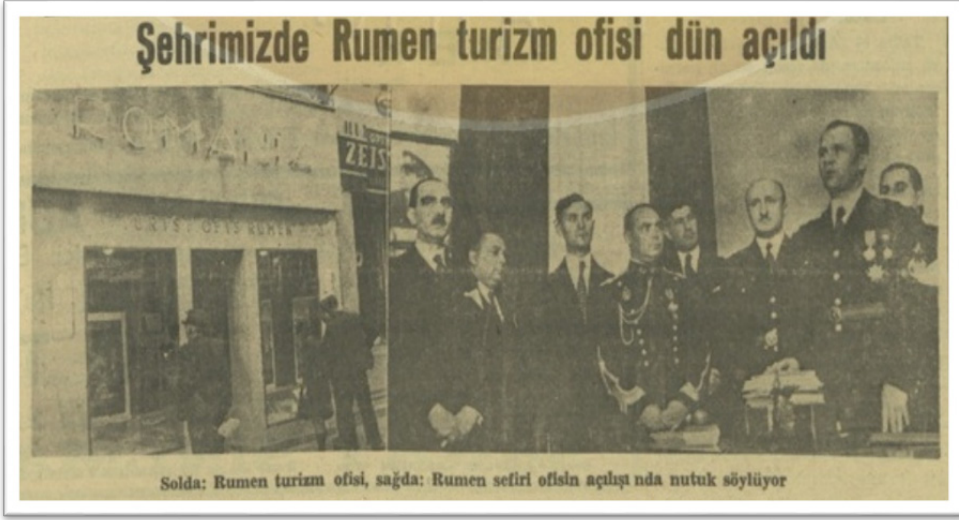
-1939'da İstanbul'da Romen Turizm Ofisi'nin açılışına dair haber. Akşam , 15.10.1939, s.2.