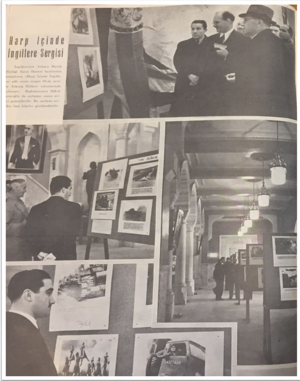
-1945'te Ankara Halkevi'nde açılan "Harp İçinde İngiltere Sergisi", Radyo , 1 Mart 1945, C.4, S.39, s.16.