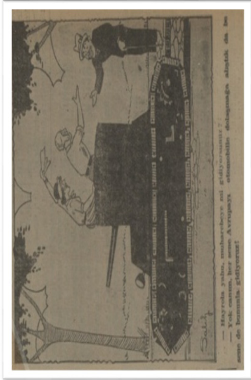
-Vakit, 03.05.1941, s.1.