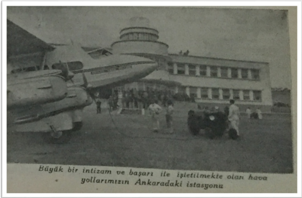
-Ankara Havaalanı, İktisadi Yürüyüş , S.125, 1 Mart 1945, s.5.