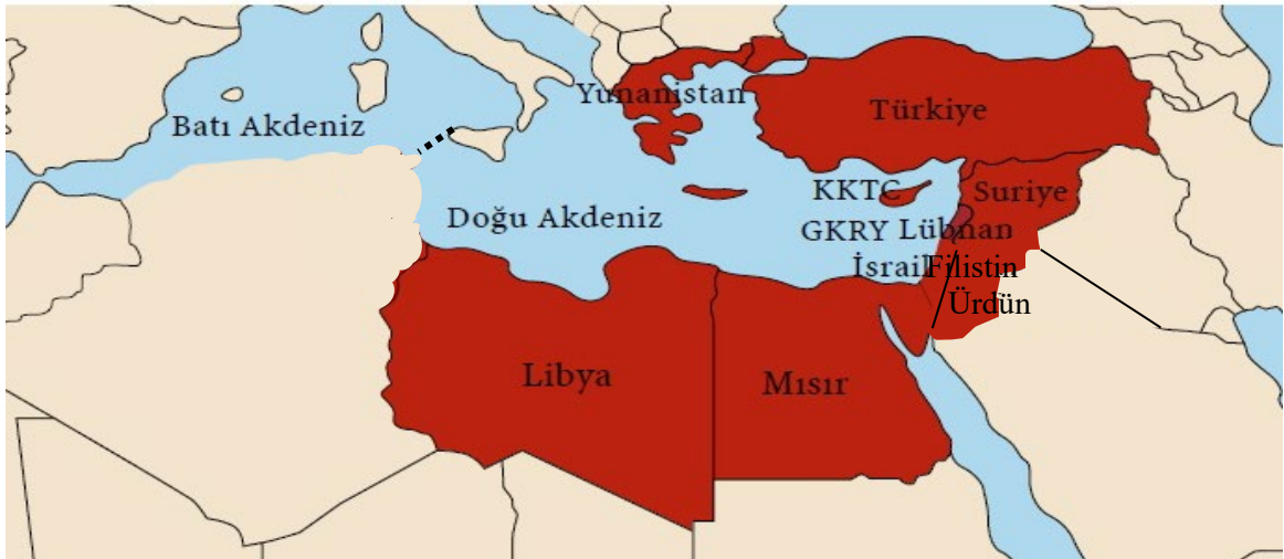
Harita-2: Doğu Akdeniz BGK (İnsamer, 2016) (Yazar tarafından haritada küçük değişiklikler yapılmıştır.)