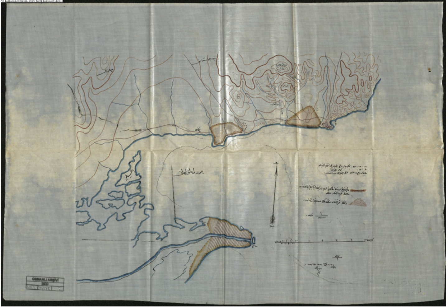
Harita 2. Yumurtalık (Ayas) Limanı Haritası (BEO 4195/314588)