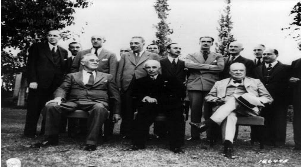
Fotoğraf-2: Kahire Konferansı (4-6 Aralık 1943) İnönü, Churchill ve Roosevelt ile görüşmüştür (Oran, 2009: 463).

Kahire'ye giden Cumhurbaşkanı İnönü, 4-6 Aralık 1943 tarihleri arasında, Churchill ve Roosevelt ile bir araya gelmiştir. Kahire Konferansı'nda İsmet İnönü ve Hariciye Vekili (Dış İşleri Bakanı) Numan Menemencioğlu, Türkiye'nin askerî durumu hakkında bilgi vermiş ve ihtiyaçlarını sıralamışlardır. Churchill, İnönü'ye savaştan sonra kurulacak dünya düzeninde söz sahibi olması için Türkiye'nin savaşa girmesi gerektiğini belirtmiştir. Müttefik heyetleriyle savaşa girme koşullarını değerlendiren Türk heyeti, prensip olarak savaşa girmeyi kabul etmişlerdir. Fakat, ordunun eksiklikleri giderildikten sonra muharebelere katılacaklarını açıklamışlardır. Bunun üzerine, Türk ordusunun ihtiyaçlarını tespit etmek ve gidermek üzere İngiliz askerî heyetinin Türkiye'ye giderek çalışmalara başlanması konusunda görüş birliğine varılmıştır (Kiraz, 2018: 425). Bkz. Fotoğraf -2.