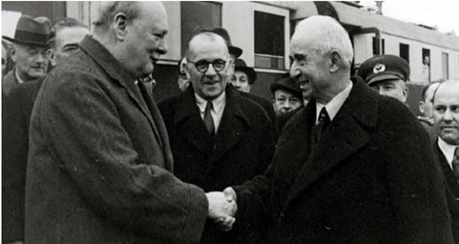
Fotoğraf-1 : Churchill-İnönü, Adana Görüşmeleri (30 Ocak-1Şubat 1943). Ortadaki Başbakan Şükrü Saraçoğlu'dur (Tekeli ve İlkin, 2018).

14 Ocak 1943'de Casablanca Konferansı'nda bir araya gelen Churchill ve Roosevelt, Türkiye'nin savaşa girmesi minvalinde görüş birliğine varmışlardır. Casablanca Konferansı sonrasında, Churchill, Türkiye'yi savaşa girmesi yönünde ikna etmek için Adana'ya gelerek İnönü ile görüşmüştür. İngiliz heyetiyle, Türkiye heyeti 30 Ocak-1 Şubat 1943 tarihleri arasında Adana'da bir araya gelmişlerdir. Müzakerelerde, Churchill Türkiye'ye ordunun güçlendirilmesi için askerî yardımlar konusunda güvence vermiştir. İnönü ise, savaş sonrasında Sovyetler Birliği'nden duyduğu yönelik çekincelerini anlatmıştır. Yani, savaşa girerse ordunun yıpranacağını ve savaştan sonra zayıf orduyla Sovyetler Birliği'ne karşı duramayacağını belirtmiştir. Ayrıca, İnönü, Türk ordusunun askerî teknolojik bakımdan takviye edilmesini istemiştir (Yalçın, 2011: 709). Bkz. Fotoğraf-1.