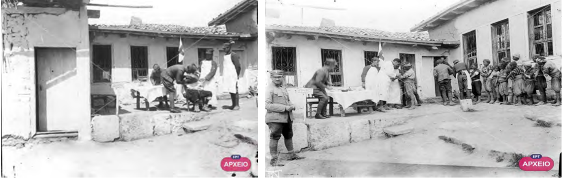
Fotoğraf 5: Yunan İşgali Sırasında Hacı İbrahim Zaviyesi Medresesi (1921-1922)

Eğret köyündeki ilk örgün eğitim kurumu, Hacı İbrahim Zaviyesi bünyesinde kurulan medresedir. Bu medrese, Hacı İbrahim Tekkesi'nin bitişiğinde, Koca Cami'nin arkasındaki arsada yer almaktaydı. İki bölümden oluşan yapının küçük kısmına "küçük medrese", büyük kısmına ise "büyük medrese" denilirdi. 1960'lı yıllara kadar ayakta kalan bu medrese, Cumhuriyet döneminde bir süre Kur'an kursu olarak da hizmet vermiştir. Bu dönemde köy halkından pek çok kişi burada Kur'an eğitimi almıştır.