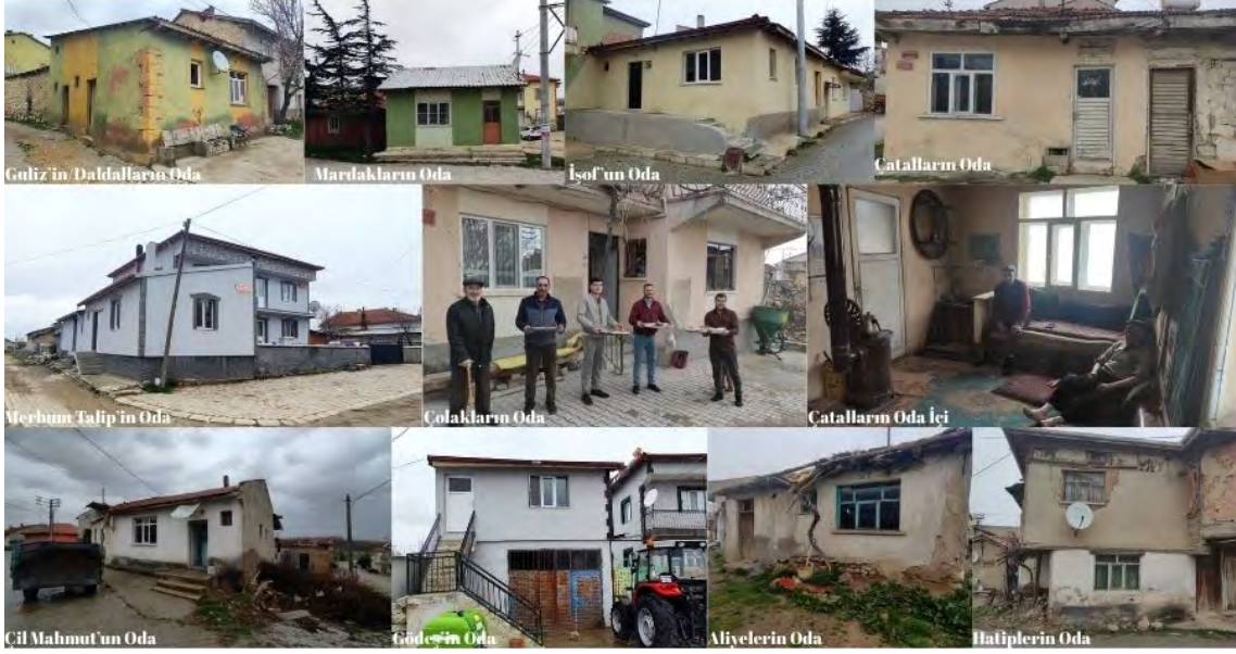
Fotoğraf 7: Anıtkaya/Eğret'te Bazı Köy Odalarının Dış ve İç Görünümleri (2025).

Arzuların Oda, Guyucunun Oda, Davulcu Süleyman'ın Oda, Muhtar Ahmet'in Oda, Bekiralinin Kadir'in Oda, Öksüz Ömerin Oda, Tatiresilin Oda, Şampayyanın Oda (Varlı 2021-Aralık: "Eğret'in Odaları"). Köyden şehre göçün artması ve kahve kültürünün yaygınlaşmasıyla çalışan oda sayısı azalmış olsa da halen aktif 10 civarında oda bulunmaktadır.