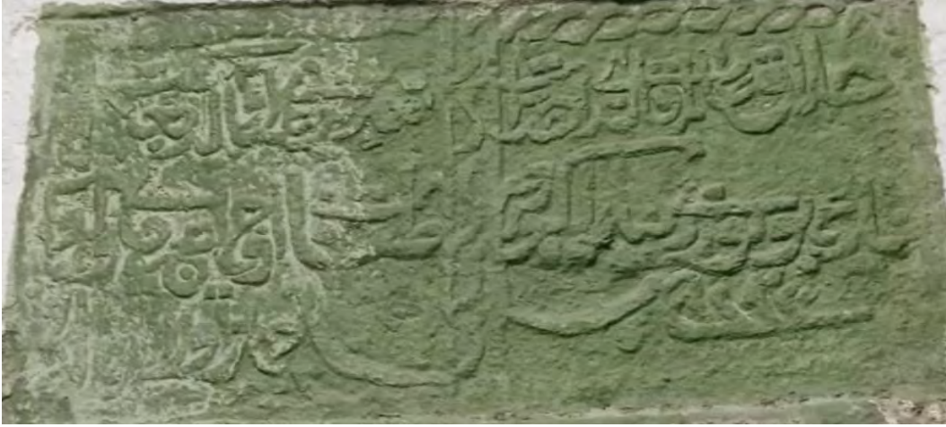
Fotoğraf 3: Cuma camii giriş kapısı üzerinde bulunan çeşmeye ait kitabe

Arşiv belgeleri köyde iki vakıf bulunduğunu göstermektedir. İlki, Cuma Camii olarak bilinen Cami-i Şerif Vakfı'dır; köyün çekirdeğini oluşturan bu vakıf Germiyanoğulları döneminde kurulmuştur. Ancak Osmanlı son dönemine ait tevliyet kayıtları dışında ne Cami-i Şerif vakfiyesi ne de han, hamam ve çeşmenin kullanımıyla ilgili herhangi bir belge günümüze ulaşmamıştır. Cami kapısının üzerinde yer alan M.1876 tarihli çeşme kitabesi Cumhuriyet dönemindeki onarım esnasında zayi olmasının diye buraya yerleştirilmiştir. 2 Köydeki ikinci vakıf ise makalemizin konusu olan Hacı İbrahim Zaviyesi Vakfı'dır.