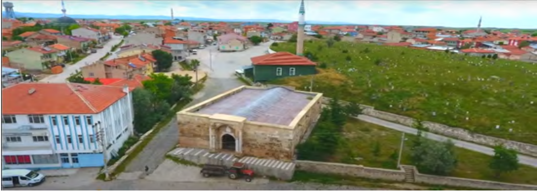
Fotoğraf 2: Eğret Kervansarayı, Cuma Camii, Kabristan ve Pazar'ın Genel Görünümü

Han, hamam, cami ve çeşmeden oluşan hayrâtın etrafına yerleşen birkaç ailenin 1 oluşturduğu nüfus köyün çekirdeğini meydana getirmiştir. Rivayete göre büyük bir sel felaketi köyün ilk yerleşimini yok etmiş; halk daha yüksek bir bölgeye geçici/iğreti olarak yerleşmiş, burası zamanla kalıcı hâle gelmiştir. “Eyret/Îreti” adı buradan doğmuştur. 1528 tarihli Tapu Tahrir Defteri’nde köyün adının “Eyret” olarak geçmesi, sel felaketi ve isim değişikliğinin tahminen 15. yüzyılın başlarında gerçekleştiğini göstermektedir (BOA, TTD, 438: 158-159). 19. yüzyılın birinci yarısına kadar arşiv belgelerinde köyün ismi, Eyret (ايرت) şeklinde kaydedilmişken bundan sonra Eğret (ايرت) şeklinde kaydedilmeye başladığı tespit edilmiştir.