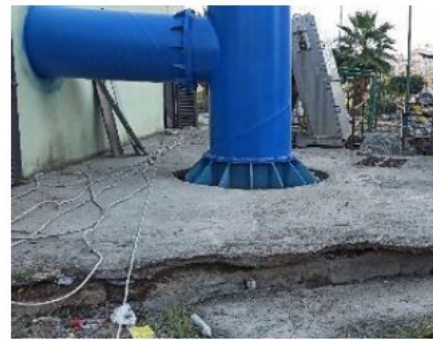
Figure Pumping station raised by the earthquake