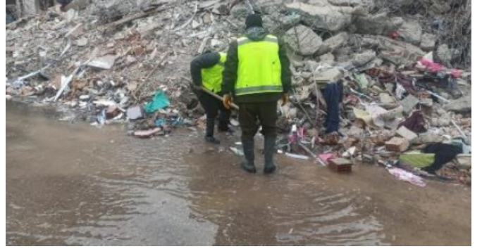
Şekil 6: Enkaza basan su örneği Figure 6: Example to flooding by water to debris

Depremden su kaynakları ve gömülü boru sistemleri gibi bu sistemlerin sorunsuz çalışmasını sağlayan mekanik elektrik ekipmanlarının oluşturduğu sanat yapıları da zarar görmüştür. Bu yapılar depremin yarattığı sismik hareketlerden, zemin sivilaşmasından ve zemin kaymalarından etkilenecek büyük hasar görmüş ve yapıları bozulmuştur. Şekil 7'de görüleceği gibi keson terfi merkezlerinde deprem dalgası etkisiyle yukarı kalkmalar gözlenmiştir. Yukarı kalkma ve çökme neticesinde sistemdeki çelik borularda kırılmalar meydana gelmiştir. Sanat yapıları olarak teşkil edilmiş hat vanaları deprem etkisiyle yer değiştirmiş ve deprem sonrası hatların kapatılması ile enkazlara suyun dolması ve can kayıpları azaltılmak istenmiş ancak vana yerlerinin bulunmasında çok vakit kaybedildiği için problemler yaşanmıştır. Sanat yapısı içine yerleştirilmemiş vanalar aranırken veya meydana çıkarmaya çalışılırken bu yapılar hasar görmüş ve kullanılamaz hale gelmiştir. Suyun kontrolü amacıyla yerleştirilen hat vanaları proje dışı bağlantılar nedeniyle kullanılamaz hale gelmiş ve deprem sonrası vanalar kapansa bile su akımı devam etmiştir. Şebeke gözlemlerinin ayrılması amaçlı kullanılan vanaların fazla olmasından dolayı suyun kontrol edilmesinin zorlaştığı gözlenmiştir.