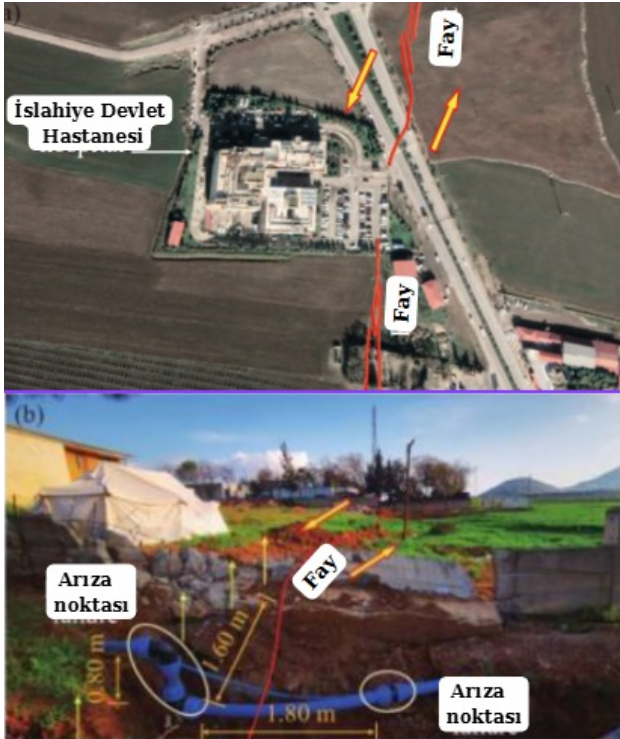
Şekil 3: İslahiye Devlet Hastanesi fay izi ve boru hasarı Figure 3: İslahiye State Hospital fault trace and pipe damage

Bu çalışmada, 6 Şubat 2023 depremleri sonrası bölgede yapılan aktif saha çalışmaları ve gözlemleri ile belirlenen içme suyu problemleri, su sıkıntıları, içme suyu hatlarında oluşan arızalar ve içme suyu sistemlerini oluşturan yapılarda meydana gelen hasarlar incelenmiştir. Senaryo çalışma olarak belirlenen Yedisu Segmenti üzerinde ise deprem sonrası hasar alma olasılığı yüksek olan noktaların tespiti yapılarak o bölgelerde temiz suya erişim problemlerine karşı bu olası hasarların analizleri yapılarak sebepleri ve çözüm önerileri sunulmuştur. Ayrıca, bütüncül olarak da deprem öncesi, anı ve sonrasında su yönetimine dair önerilere yer verilmiştir.