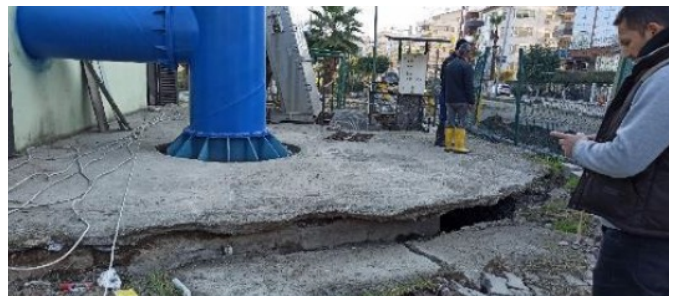
Şekil 7: Deprem etkisiyle yükselmiş terfi merkezi Figure 7: Elevated transfer centre due to earthquake effects

Depremden su kaynakları ve gömülü boru sistemleri gibi bu sistemlerin sorunsuz çalışmasını sağlayan mekanik elektrik ekipmanlarının oluşturduğu sanat yapıları da zarar görmüştür. Bu yapılar depremin yarattığı sismik hareketlerden, zemin sivilaşmasından ve zemin kaymalarından etkilenecek büyük hasar görmüş ve yapıları bozulmuştur. Şekil 7'de görüleceği gibi keson terfi merkezlerinde deprem dalgası etkisiyle yukarı kalkmalar gözlenmiştir. Yukarı kalkma ve çökme neticesinde sistemdeki çelik borularda kırılmalar meydana gelmiştir. Sanat yapıları olarak teşkil edilmiş hat vanaları deprem etkisiyle yer değiştirmiş ve deprem sonrası hatların kapatılması ile enkazlara suyun dolması ve can kayıpları azaltılmak istenmiş ancak vana yerlerinin bulunmasında çok vakit kaybedildiği için problemler yaşanmıştır. Sanat yapısı içine yerleştirilmemiş vanalar aranırken veya meydana çıkarmaya çalışılırken bu yapılar hasar görmüş ve kullanılamaz hale gelmiştir. Suyun kontrolü amacıyla yerleştirilen hat vanaları proje dışı bağlantılar nedeniyle kullanılamaz hale gelmiş ve deprem sonrası vanalar kapansa bile su akımı devam etmiştir. Şebeke gözlemlerinin ayrılması amaçlı kullanılan vanaların fazla olmasından dolayı suyun kontrol edilmesinin zorlaştığı gözlenmiştir.