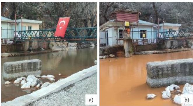
Şekil 4: Adıyaman Sugözü kaynağının a) depremden önceki ve b) sonraki durumu

Koçbulut ve diğ. (2024), 6 Şubat 2023 Ekinözü depreminin (Mw 7.6), Malatya-Doğanşehir arasındaki Çıglık Fayı boyunca ~11 km uzunlukta yüzey kırığı oluşturduğunu ve maksimum 95 cm sol yanal, 75 cm düşey atım gözlemlendiğini belirtmiştir. Burdan da anlaşılacağı üzere deprem, gömülü boru hatlarında dalgaların geçişi esnasında oluşan zeminin dinamik tepkisinden veya deprem sonrasında zeminde oluşan yer değiştirmelerden kaynaklı hasar oluşturur. Fay hareketleri sonrası içme suyu isale boru hatlarında fayın hareketi yönünde (Şekil 5) deformasyonlar görülmüştür. Çelik isale hatlarında ulaşımın zor olduğu yerlerde katodik koruma sisteminin bakımı zaman içerisinde yapılamadığından ciddi manada korozyona maruz kalmasının da etkisiyle ve deprem sonrası çok sayıda patlak ve kırılma gözlenmiştir. Kırılğan boru tiplerinde (Asbest, uPVC, Pik Döküm, vb.) ve eski çelik borularda deprem veya depremin sebep olduğu kaya düşmeleri kaynaklı patlaklar oluşmuştur. Su kaynağının ulaşımının sorunlu olduğu yerlerde deprem etkisiyle heyelan oluştuğundan hem arıza noktası tespiti hem de tamiri mümkün olmaz hale gelmiştir. Deprem sonrası yıkılan binalara su iletimi sağlayan hatlarda patlaklar meydana geldiği ve enkazlara su dolduğu (Şekil 6) gözlenmiştir.