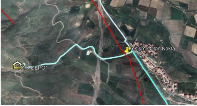
Şekil 9: TOKİ depo hattındaki kesişme noktası (İçme suyu isale hatları mavi çizgilerle, bölgedeki diri faylar kırmızı çizgilerle (Emre ve diğ. 2013), depolar ev işareti şeklinde ve isale hatları ile fay hatlarının kesişim yerleri ise iğneli nokta işaretiyle belirtilmiştir.)

TOKİ deposundan gelen isale hattı ile aktif diri fay hattının 90° açı ile kesiştiği nokta Şekil 9'da görülmektedir. Hat PE boru ile teşkil edilmiştir. PE borular, esnek yapıları sayesinde özellikle deprem dalgalarının yarattığı titreşim ve zorlamalara karşı diğer rijit boru malzemelerine kıyasla daha dayanıklı olarak bilinmektedir. Ancak, fay hattındaki doğrudan yer değiştirme hareketleri söz konusu olduğunda, isale hattının fay hattını kestiği noktalarda kırılma veya patlakların meydana gelmesi beklenmektedir. Bu bölge için deprem sonrası ulaşımı kolaylaştıracak şekilde lojistik ve tamir ekip, ekipmanlarının planlanması önerilmektedir.