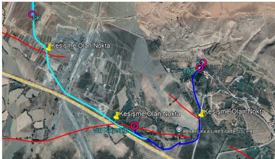
Şekil 11: Altınbaşak isale ve fay haritası (İçme suyu isale hatları mavi çizgilerle, bölgedeki diri faylar kırmızı çizgilerle (Emre ve diğ. 2013), su kaynakları pembe yuvarlaklarla, terfi merkezleri mavi kare şeklinde, depolar ev şeklinde ve isale hatları ile fay hatlarının kesişim yerleri ise iğneli nokta işaretiyle belirtilmiştir.)

Altınbaşak, Erzincan ilinin Üzümlü ilçesinin beldesidir. Bu bölge, fay hatları ile kesiştiği ve Yedisu fayı sismik boşluğu incelenirken depremden en çok etkileenecek yerlerden biri olduğu için seçilmiştir. Yedisu fay segmentinin batısında yer almaktadır. Şekil 11'de Altınbaşak'ta yer alan PE isale hatları ile bir adet su deposu ve ilçeyi besleyen üç tane farklı su kaynağı görülmektedir. Su kaynaklarından terfi merkezine ve depolara iletim isale hatlarıyla sağlanmaktadır. Depodan gelen isale hattı fayı ilk noktada 90° açı ile kesmektedir. Bu noktada hasar oluşması beklenilmektedir.