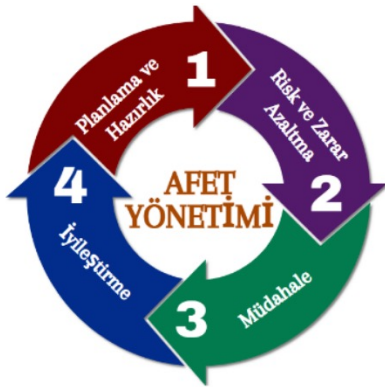
Şekil 2: Afet yönetiminin evreleri Figure 2: Stages of disaster management

Yüksek afet riski taşıyan bölgelerde öncelikle afet türlerine özgü risk haritalarının oluşturulması gerekmektedir. İstanbul’da beklenen depremin yol açabileceği can ve mal kayıplarını en aza indirmek amacıyla risk azaltma çalışmalarına devam edilmesi ve altyapı tesislerinin dayanıklılığının artırılması hedeflenmektedir. Ayrıca, afet sonrası kullanılacak geçici barınma alanlarının kapasitelerinin ihtiyaca göre genişletilmesi planlanmaktadır (Şahin 2019).