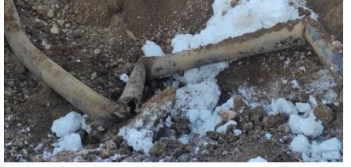
Şekil 5: Fay hareketi yönlü kırılma örneği Figure 5: Example of a directional fracture caused by a fault movement