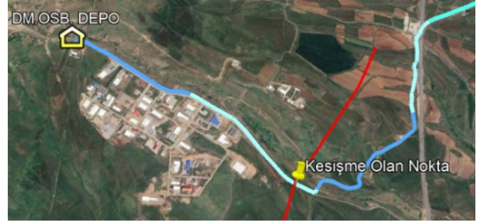
Şekil 10: OSB depo hattındaki kesişme noktası (İçme suyu isale hatları mavi çizgilerle, bölgedeki diri faylar kırmızı çizgilerle (Emre ve diğ. 2013), depolar ev işareti şeklinde ve isale hatları ile fay hatlarının kesişim yerleri ise iğneli nokta işaretiyle belirtilmiştir.)

ve dağıtımında kritik bir rol oynamakta ve ihtiyaç olacak ürünler burada üretilmektedir. Gıda üretimi yapan tesisler, depremedelerin beslenme ihtiyaçlarını karşılarken, su arıtma ve dağıtım tesislerinin çalışması temiz suya erişimi sağlar ve salgın hastalıkların önüne geçer.