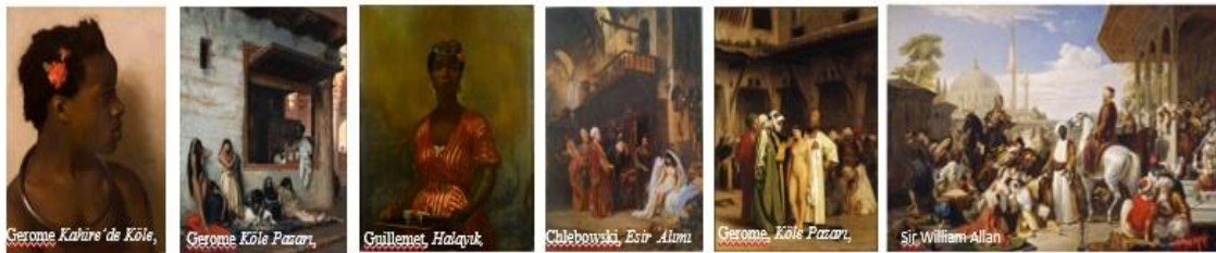
Şekil 6: İtalyan ressamlar dışında köle pazarı sahnesi örnekleri