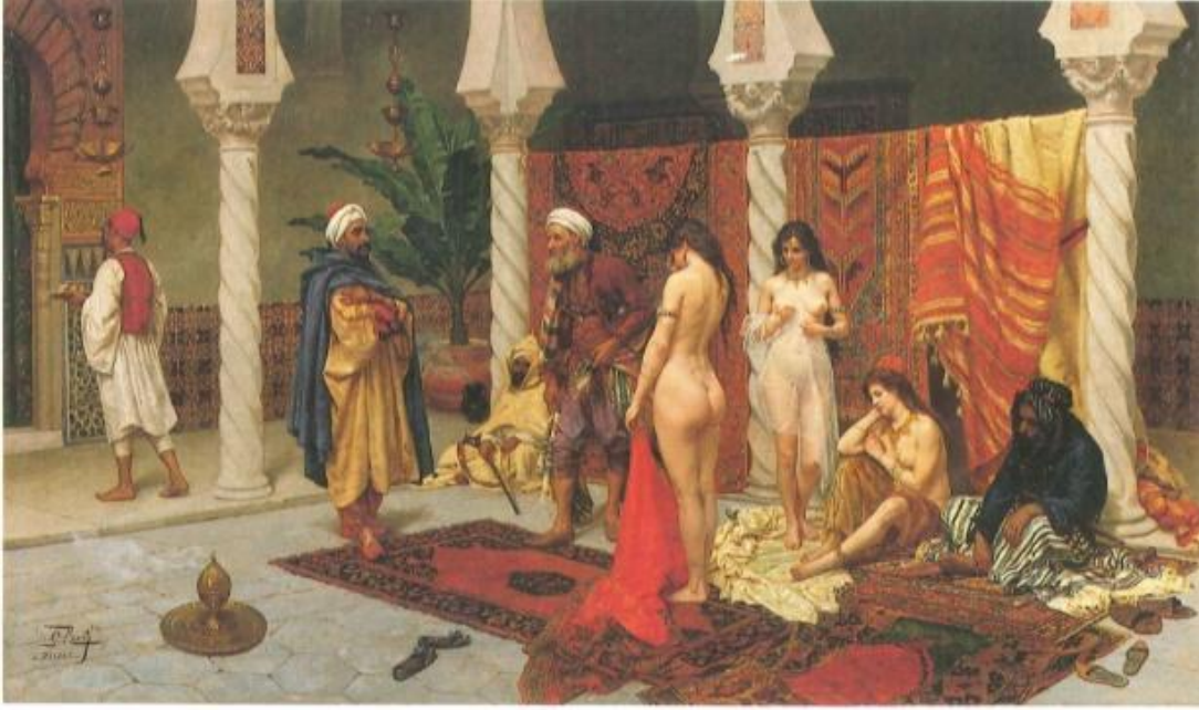
Şekil 4: Giulio Rosati, Köle Pazarı, Özel Koleksiyon Roma, 61 x 104 cm, Tuval üzerine yağlıboya