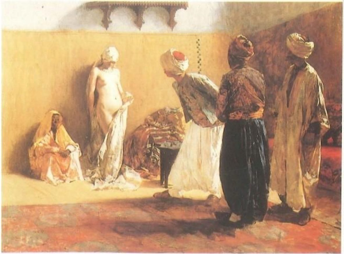
Kaynak: (Thornton, 1994: 166).

Şekil 2: Ettore Cercone, Köle Pazarı, Özel Koleksiyon, 90, 54 x 77, 3 cm. Tuval üzerine yağlıboya