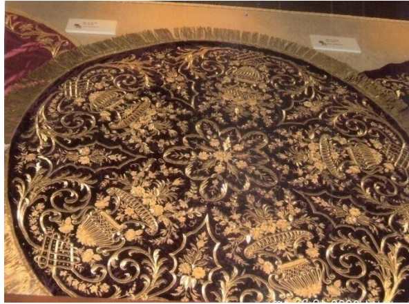
Fot. 5- Kenar temizlemede kordondan hazırlanmış saçak kullanılmış sofra puşidesi İstanbul Dolmabahçe Sarayı Depo Müzesi (18. Yüzyıl)

Osmanlı İmparatorluğu dönemi işlemlerinde saçak şeklinde hazırlanan harçlar genellikle çeşitli amaçla hazırlanmış örtülerde kullanılmıştır. Saçakla yapılan kenar süsleme uygulamalarının giysilerde kullanılmadığı görülmektedir. Bu türün en güzel örnekleri Dolmabahçe Sarayı Depo Müzesi tekstil koleksiyonunda bulunan ve saray için hazırlanan sofra puşideleri ve şerbet mahramalarında görülür (Fotoğraf 5). Bu örneklerde sırma ile hazırlanmış saçaklı harçlar kenar boyunca tutturulmuştur.