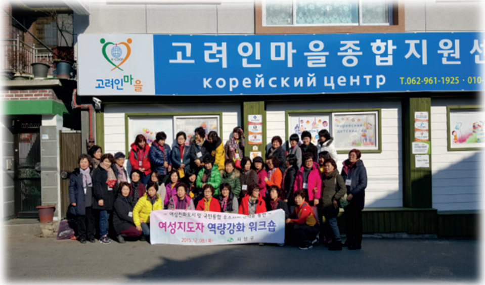
Resim 1.1. Güney Kore’de Koryo-in(고려인) yazılı bir tabela.