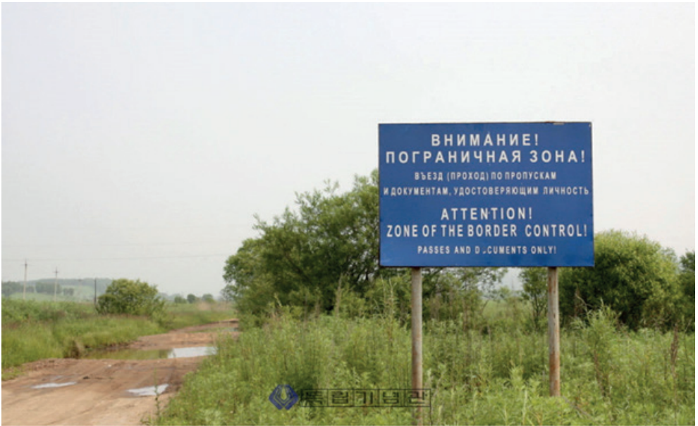
Resim 4.2. Tizinkhe’ de çekilmiş bir arazinin fotoğrafı