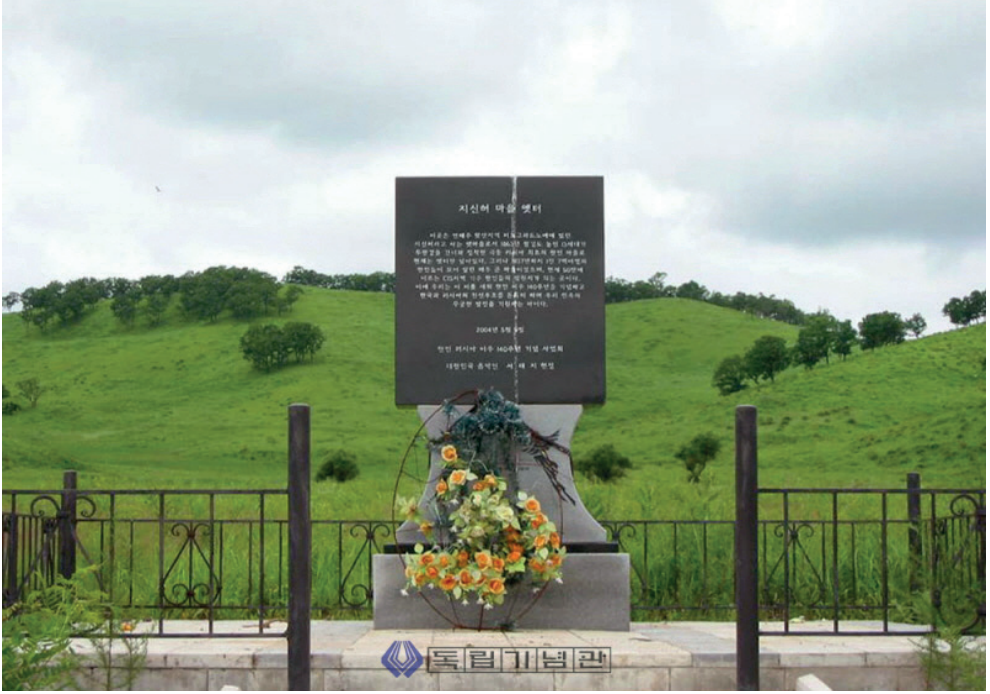
Resim 4.1. Tizinkhe’ de Kore anıtı.