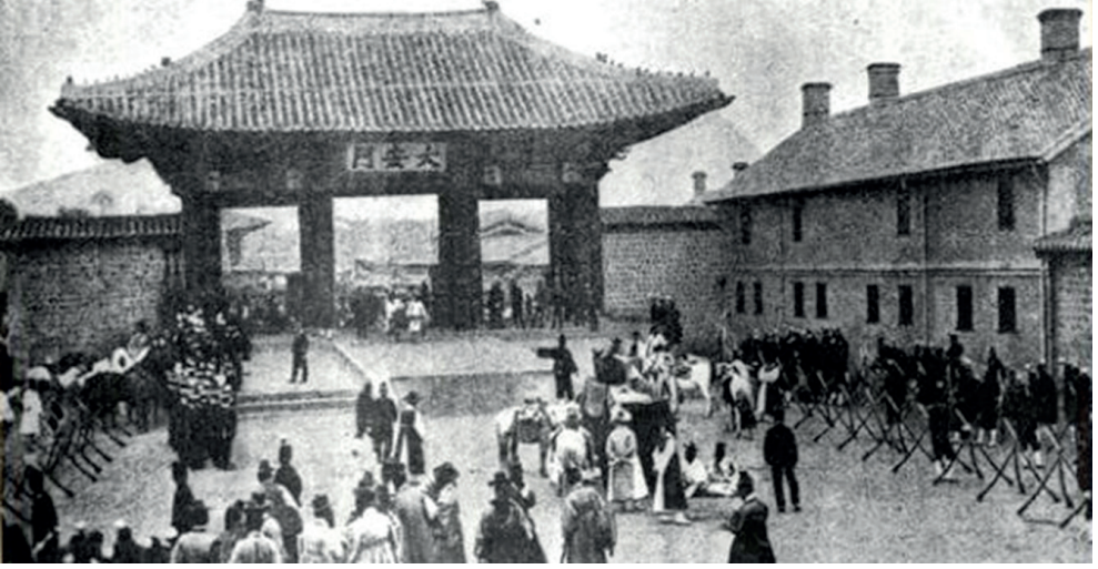
Resim 1.1. Eulsa Antlaması sırasında Gyeongju'daki Daeamun kapısını gzetten Japon askerleri.

Kaynak, İnternet: Joseon'un Japon İgaline Karı Meydan Okuması. Web: http://koretarihi.com/joseon-halkin-bagimsiz-bir-ulus-insa-etmesinde-basarsizligi-ve-kolonize-sistemi/japon-iskaline-karsi-joseonun-yuzlesmesi/ adresinden 8 Ocak 2018'de alınmıtır.