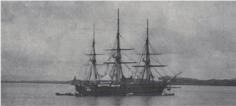
Resim 3.1. Kore'nin denizinde grlen yabancı gemilerin grn

Qing'in ilk in-İngiltere Savaşı (1840~1842)'nda yenildięi haberi ile İngiltere ve Fransa'nın mtfevik ordularının Qing'in baŐkentini ikinci in-İngiltere Savaşı (1856~1860)'nda ezip ięnedięi sylentileri Joseon'da yayıldı.