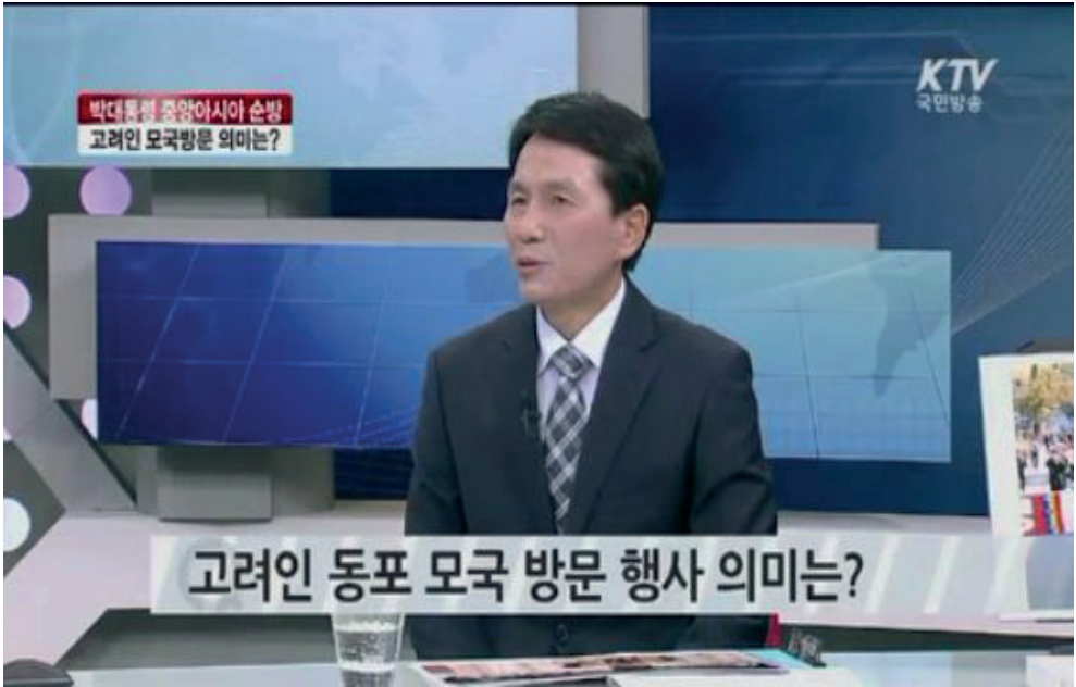
Resim 1.2. Güney Kore’nin bir haber kanalında Koryo Saram’lar, Koryo-in(고려인) olarak geçiyor.