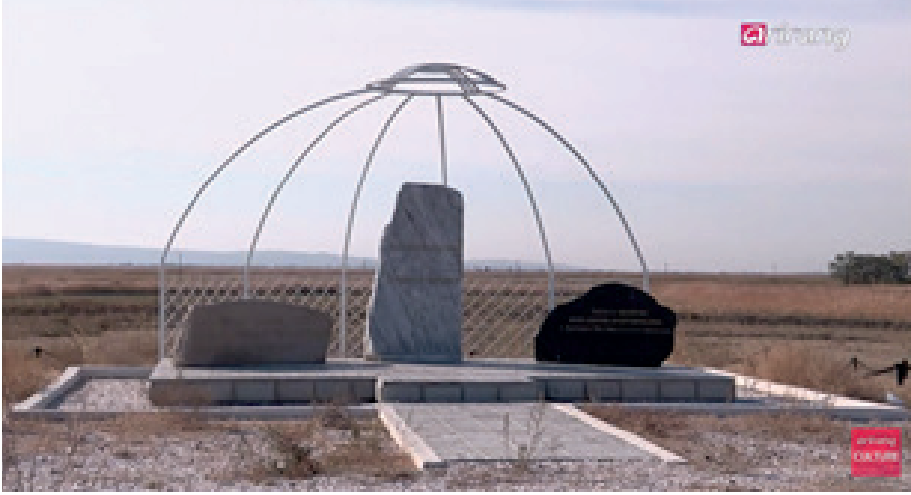
Resim 7.1. Kazakistan'da Korelilerin yerin altında delikler açarak yaşadığı yerdeki yapılmış anıtın resmi