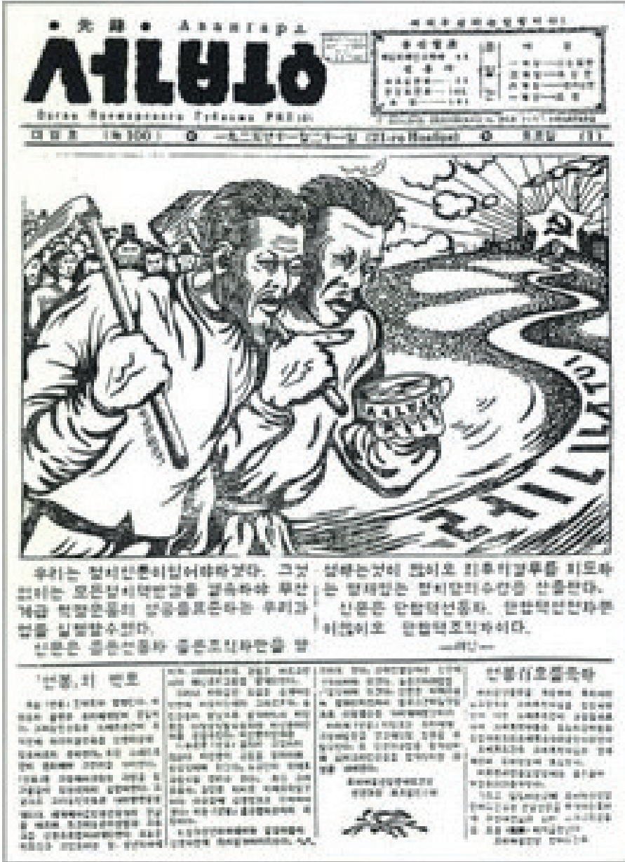
Resim 6.1. 1923'te Rusya'nın Vladivostok kentinde yayınlanan "SeonBong" adlı gazetenin 100. sayısı (21 Kasım 1925).

Kaynak, İnternet: (2008). '러시아 한인(韓人) 신문이 안중근 의거 주도'. Web:http://www.dokdocenter.org/dokdo_news/print_paper.cgi?action=print_paper&number=8575&title=%C7%C1%B8%B0%C6%AE adresinden 7 Ocak 2018 tarihinde alınmıştır.