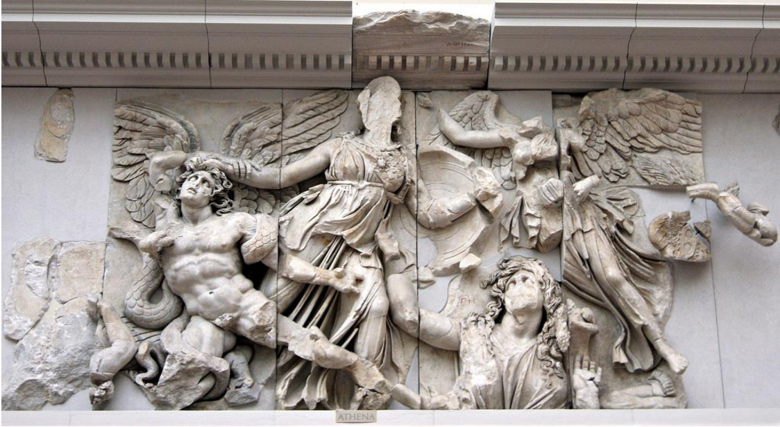
Zeus Sunağı'ndaki Gigantomakhia'dan Ayrıntı