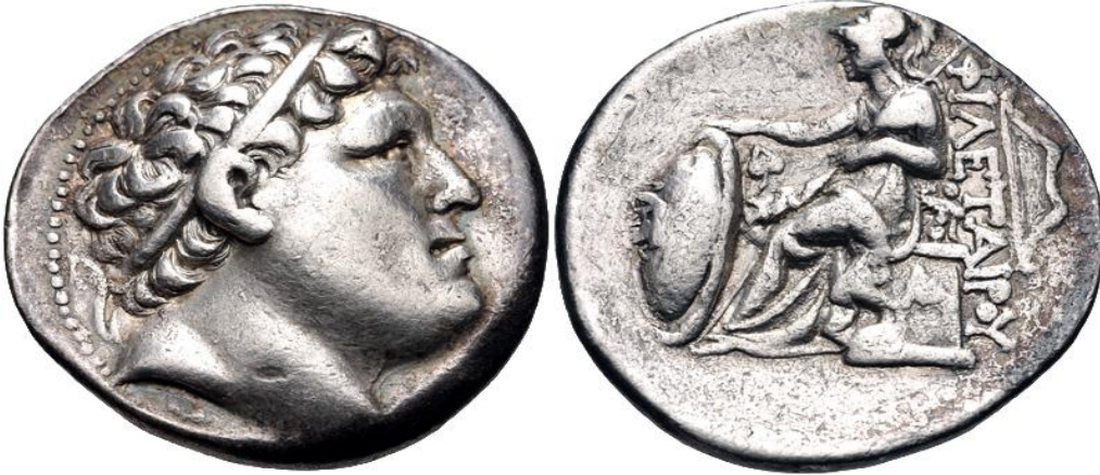
I. Eumenes döneminde bastırılan, ön yüzde Pergamon Krallığı'nın kurucusu Philetairos'un, arka yüzde Athena'nın tasvir edildiği sikke