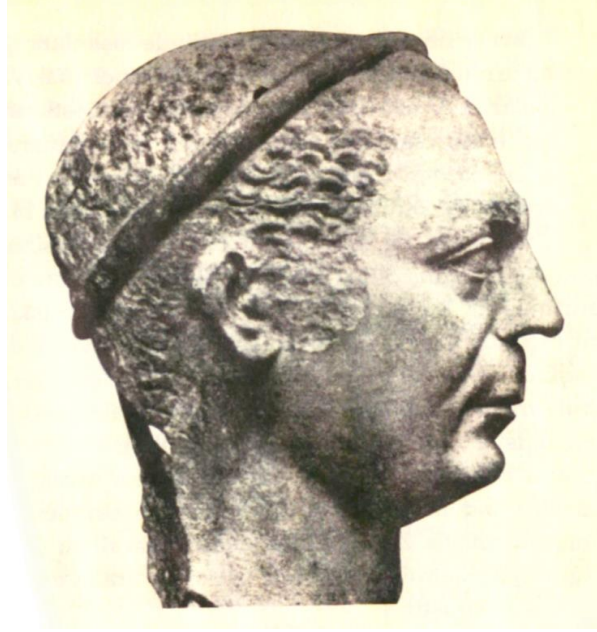
III. Attalos (Magie, 2001: 63)