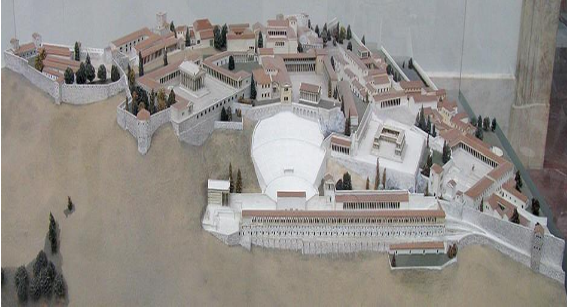
Pergamon Akropolis'inin Rekonstrüksiyonu [ https://wallcover.com/pergamon.html (02.04.2018)]