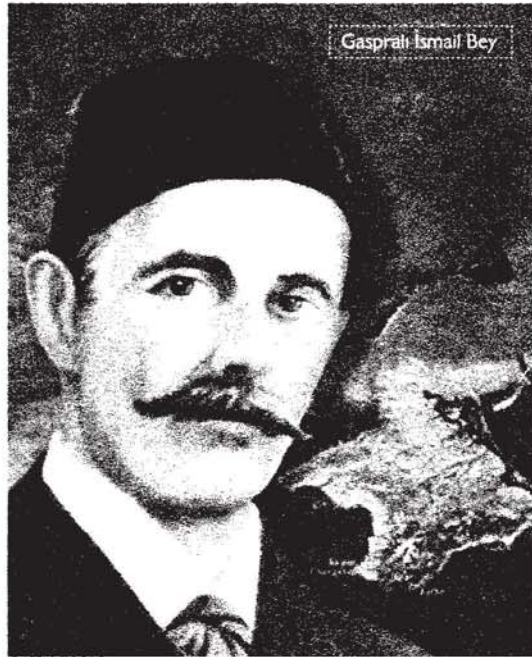
Gaspıralı İsmail Bey

İsmail Gaspıralı'nın bu radikal çıkışı aslında birçok gerçekleri içinde barındırmaktadır. Rusya tarihine baktığımızda Rus idaresi altındaki Müslümanların aslında, Rusça tabirle "inorodets", yani "yabancı, öteki" veya Tatarca tabirle, "chit" olarak görüldüğü ve onlara yönelik politikalarda ve onlara verilen hak ve hürriyetlerde de genelde bu tarz bir bakışın hakim olduğu bilinmektedir. Hatta bu "inorodets" tabiri sadece Müslümanlar değil, isterse Ortodoks Hristiyan olsun, diğer kavimler için de geçerlidir. Nitekim Çarlık döneminde Müslüman mektep ve