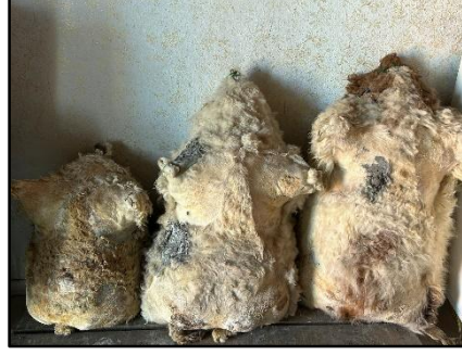
Görsel 2: Peynir muhafaza edilen koyun derileri, Kars 2025.