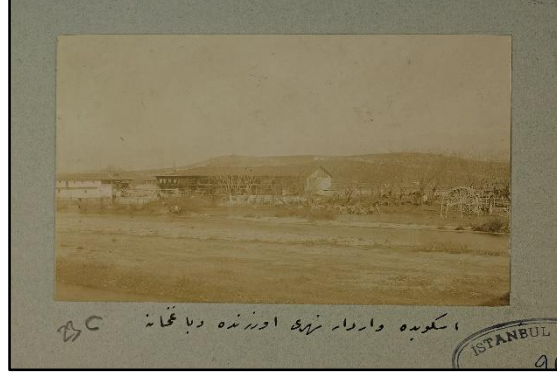
Görsel 3: 1842-1918'de Üsküb'te Vardar Nehri üzerinde bir debbağhâne.