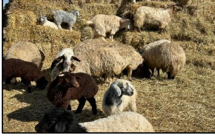
Görsel 1: Baharda beslenen koyunlar, Kars 2025.