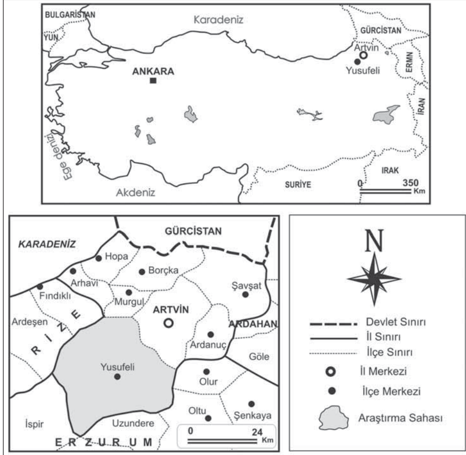
Harita 1: Yusufeli ilçesi Lokasyon Haritası

sayede yörede sıcak iklim bölge meyvelerinin ziraatı yapılabilmektedir. Ancak dar ve derin vadilerde ziraat yapmaya elverişli tarım toprakları bulunmamaktadır. Bu nedenle yöre sakinleri meyveciliği büyük bahçeler şeklinde değil de her meyveden kendi ihtiyaçlarına yönelik birkaç ağaç yetiştirme şeklinde yapmaktadırlar (Koday, 1999:263–264).