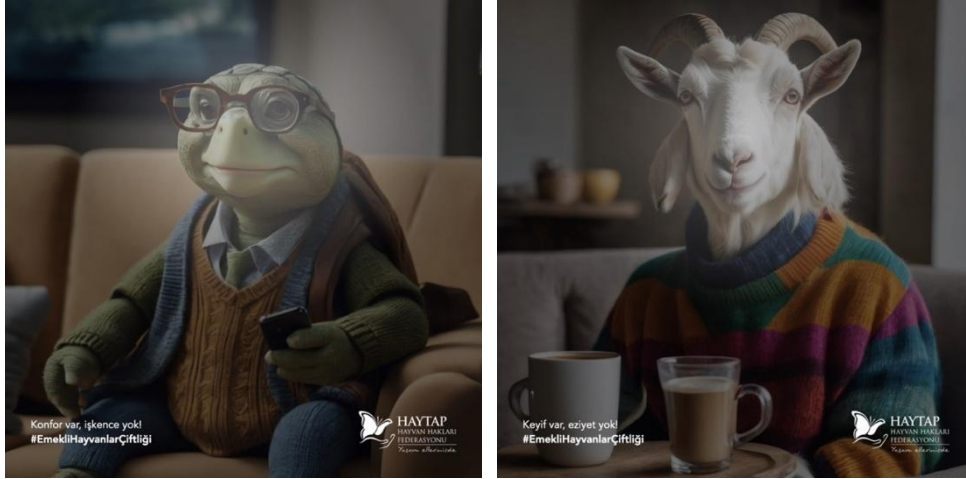
Görsel 1: “Emekli Hayvanlar Çiftliği” kampanyasından iki basın ilanı