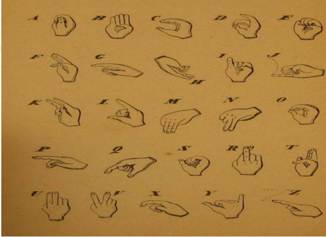
Fotoğraf 1: Fransız Din Adamı Abbé de Charles Michel de L'Epée'nin Fransız Dilsiz Alfabeti 1