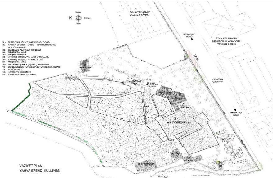
Resim 3: Yahyâ Efendi Külliyesi Vaziyet Planı (Hilal Otyakmaz Aydın’ın arşivi).