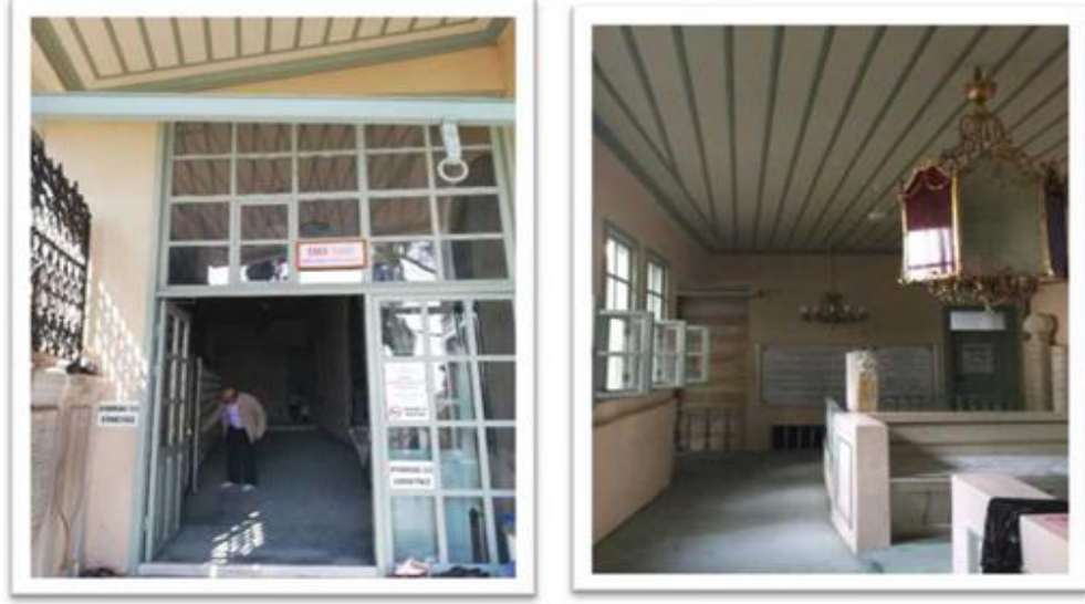
Resim 4-5: Yahyâ Efendi Külliyesi Girişi (Hilal Otyakmaz Aydın'ın arşivi).