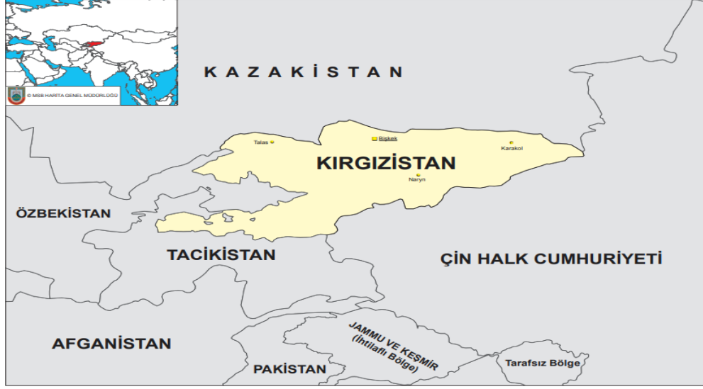
Harita 2: Kırgızistan'ın Haritası ( https://www.harita.gov.tr/ulke-baskentleri )

bağlamda, Kırgızistan'ın jeopolitik konumunun çeşitli boyutları aşağıda incelenmiştir (Ozdilek, 2025, s. 11).