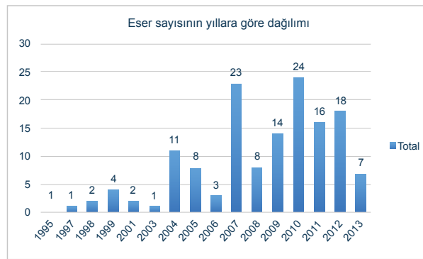
Şekil 1. Türkiye bilimsel üretim alanında Bourdieu ile ilgili eser sayısının yıllara göre dağılımı. 8

ilgilenen pek çok ismin seferber edilmesinin bir verimi olan ve alanda yüksek simgesel sermaye sahibi bir yayınevi tarafından yayınlanan Ocak ve Zanaat kitabı. Kendinden önce büyük ölçüde dağınık hatlarda ilerleyen Bourdieu'ye dair ilgi ve üretimin, kolektif bir çalışma etrafında örgütlenmesi sonucu oluşan bu kitap, Türkiye'de Bourdieu'ye dair önemli ölçüde tanıtıcı ve bütüncül bir resim sunan ilk eser olma özelliğini taşıyor. Hem bizzat bu kitap dahilinde üretilen telif eser miktarı (13 makale) hem de kitabın sonraki Bourdieu çalışmalarını tetikleyici etkisi Bourdieu ile ilgili genel bilimsel üretime ciddi bir niceliksel katkı yapmış görünüyor. 7