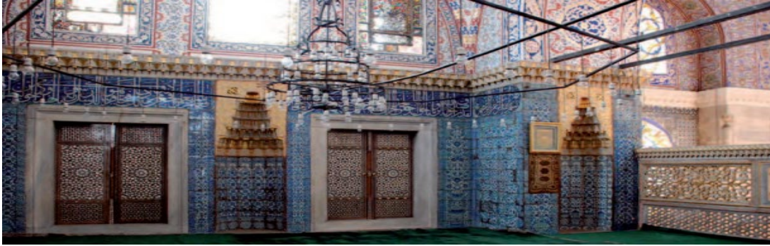
Resim 4. Üst sol(a): Sütun ve korkuluk; Üst Sağ (b): Mihrabiye süslemesi; Alt (c): Duvar süslemesi