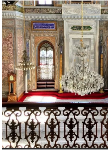
Resim 5. Üst(a): Mahfilin cami içindeki konumu; Alt Sol(b): Mahfilin yandan görünümü, Alt sağ(c): Mahfil içinden korkuluk ve cami iç mekân görünümü