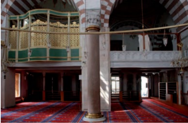
Resim 3. Atik Valide Sultan Cami hünkâr mahfili

Aşağıda Resim-3'de mahfilin günümüz görünümü yer almaktadır (Çetinarslan 2015).