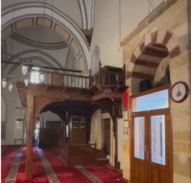
Resim 1. Hafsa Sultan Camii hünkâr mahfili

Aşağıda Resim-1'de mahfilin günümüzdeki görünümü yer almaktadır (Kepezkaya, 2025).