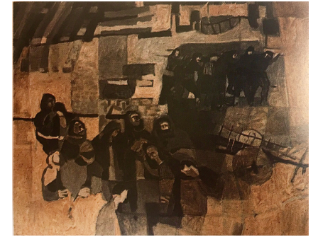
Görsel 8. Pekmezci'nin "Can Kırıkları" isimli tiyatro oyunu sonrası izlenimlerini resmettiği çalışması (Solda)