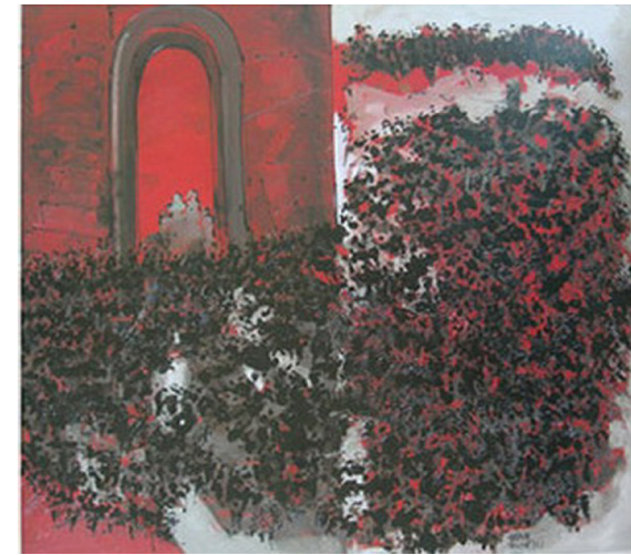
Görsel 5,6,7. Hasan Pekmezci'nin eserlerden örnekler. "İnsanlarımız"