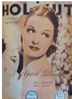
Görsel 17. HoliVut No:10, 1935 (Ortada)