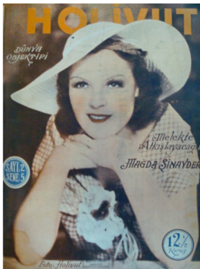
Görsel 16. HoliVut No:2, 1935 (Solda)

1935'e gelindiğinde ön kapak tasarımında bir değişikliğe rastlanmaz. Ancak küçük eklemeler karşımıza çıkar. Bu tasarımda bir önceki seneye ek olarak derginin yayım senesi ve sayısı da eklenmiştir. Bu eklemeye derginin fiyatının yazdığı gibi daire içerisine alınmıştır. Fiyat ve yayım yılının belirtildiği daireler, mavi fon üzerine beyaz harflerle yazılmıştır. Bu sayede okunabilirliği arttırılmıştır. Ayrıca bazı sayılarda derginin ismi renkli olarak basılmıştır. İsmi altına dergi ile ilgili "Dünya Objektifi" ibaresi eklenmiştir. Yine bir önceki senede olduğu gibi renkli baskı tekniği uygulanmıştır.