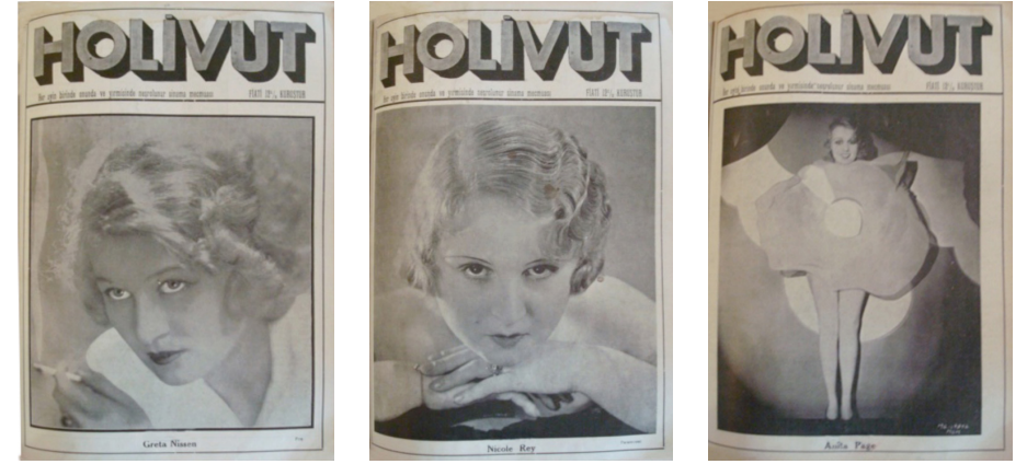
Görsel 4. Holivut No:4, 1932 (Solda)

Künyede derginin her ayın kaçında yayımlandığı hakkında bilgi veren "her ayın birinde onunda ve yirmisinde neşrolunur sinema mecmuası" yazısı ve bu yazının hemen yanında derginin fiyatı bulunur. Dergi künyesinde görülen derginin sayısı, tarihi ve basım yeri ile ilgili diğer bilgiler yeni kapak tasarımı ile birlikte derginin arka kapağında kullanılmaya başlar. Bu alanın hemen altında tam sayfa sinema yıldızlarının fotoğrafları yer alır. Bu fotoğraflar portre fotoğrafı olabileceği gibi çeşitli pozlandırmalar da kullanılmıştır. Fotoğrafların hemen altında fotoğraftaki sanatçının ismi yer alır. Bazı pozlandırmalarda sanatçı isminin altında fotoğrafla ilgili bilgi veren kısa bir açıklama cümlesi de mevcuttur.