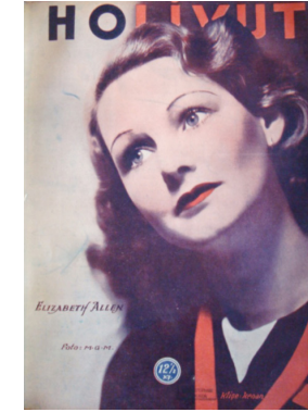
Görsel 20. HoliVut No:9, 1936 (Ortada)