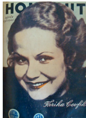
Görsel 18. HoliVut No:11, 1935 (Sağda)

1936'ya gelindiğinde yine tasarımda büyük bir değişikliğe rastlanmaz. Derginin yayım senesini ve sayısının içinde bulunduğu daire kaldırılmıştır. Derginin ismi farklı renklerde kullanılmaya başlanmıştır. Arka planla ilişkili olarak dergi isminde iki renk kullanıldığı görülür. Açık renk arka planda isim koyu renk yazılırken, koyu renk arka planda kırmızı kullanımı göze çarpar.