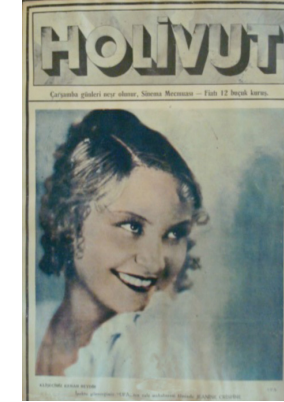
Görsel 11. HoliVut No:41, 1933 (Ortada)