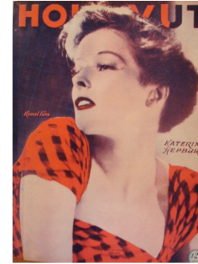
Görsel 19. HoliVut No:6, 1936 (Solda)

1936'ya gelindiğinde yine tasarımda büyük bir değişikliğe rastlanmaz. Derginin yayım senesini ve sayısının içinde bulunduğu daire kaldırılmıştır. Derginin ismi farklı renklerde kullanılmaya başlanmıştır. Arka planla ilişkili olarak dergi isminde iki renk kullanıldığı görülür. Açık renk arka planda isim koyu renk yazılırken, koyu renk arka planda kırmızı kullanımı göze çarpar.