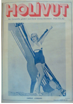
Görsel 8. HoliVut No:29, 1932 (Ortada)