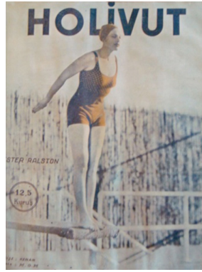
Görsel 14. HoliVut No:30, 1934 (Ortada)