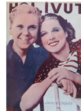
Görsel 23. HoliVut No:9, 1936 (Ortada)