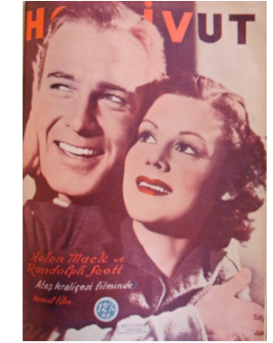
Görsel 21. HoliVut No:11, 1936 (Sağda)

1936 senesi içerisinde dergi yeni seri adı altında yayım yapmaya başlar. Yeni serinin kapak tasarımları incelendiğinde altıncı senede yayımlanan seriden hiçbir farkı olmadığı görülür.