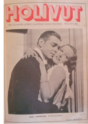
Görsel 9. HoliVut No:30, 1932 (Sağda)