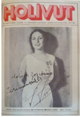
Görsel 7. HoliVut No:20, 1932 (Solda)