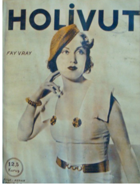
Görsel 13. HoliVut No:29, 1934 (Solda)