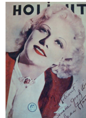
Görsel 22. HoliVut No:6, 1936 (Solda)

1936 senesi içerisinde dergi yeni seri adı altında yayım yapmaya başlar. Yeni serinin kapak tasarımları incelendiğinde altıncı senede yayımlanan seriden hiçbir farkı olmadığı görülür.