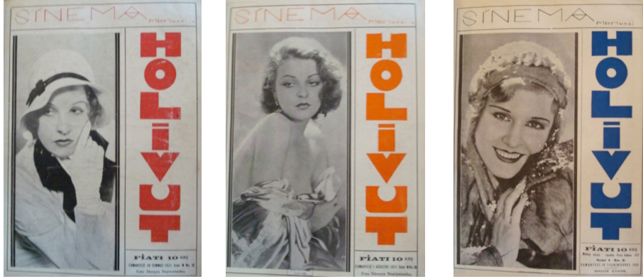
Görsel 1. Holivut No:2, 1931 (Solda)

tir. Ancak diğer sayılarda film karelerine rastlanmaz. Fotoğraflar yabancı sinema sanatçılarının siyah-beyaz fotoğraflarıdır. Sağ tarafta derginin ismi yer alır. Derginin adı serifsiz (tırnaksız) harfler kullanılarak, yine el ile tasarlanmıştır. Kapakta kullanılan tek renk derginin adında mevcuttur; ve her sayıda farklı renkler kullanılmıştır. Bazı sayılarda yukarıda yazan "Sinema Mecmuası" yazısında da renklendirmeler yapıldığına rastlanır. Bu renklendirmeler derginin isminde kullanılan renkle paralel olarak aynı renkte tasarlanmıştır. Diğer yazılar ve fotoğraflar siyah-beyazdır. Derginin isminin hemen altında sağ alt köşede dikdörtgen bir alan yaratılmıştır. Bu alanda derginin künyesi yer alır. Bu künyede ilk sayıda derginin fiyatı, tarihi, yayım yılı ve sayısı yer almaktadır. Diğer sayılarda bu bilgilere ek olarak adres ve fotoğrafta görülen sanatçının ismi yer alır. Bazı sayılarda karşımıza çıkan fotoğraflar "Foto Süreyya" stüdyosundan temin edilmiştir. Bu durumlarda derginin künyesinin içinde bu durum "Foto Süreyya Neşriyatından" ibaresiyle belirtilmiştir.