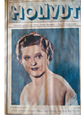
Görsel 10. HoliVut No:40, 1933 (Solda)