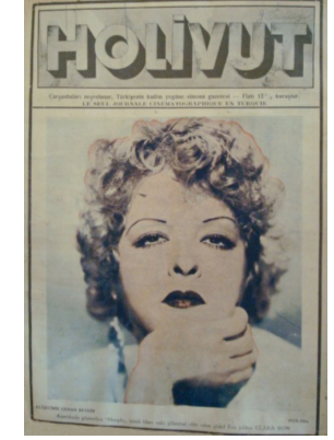
Görsel 12. HoliVut No:50, 1933 (Sağda)

1933 yılına gelindiğinde kapak tasarımında fazla bir değişikliğe rastlanmaz. Derginin ismi 1932 senesinde kullanılan şekilde tasarlanmış, ancak renkte farklılığa gidilmiştir. Derginin isminde kullanılan kırmızı renk kullanılmamaya başlanmış, derginin ismi siyah-beyaz kalırken kapak fotoğrafında renkli fon ve fotoğraf kullanılmaya başlanmıştır. 1932'de dergi ismi renkli, kapak fotoğrafı siyah-beyaz kullanılırken, 1933'e girildiğinde bunun tam tersi bir tasarım anlayışı uygulanır. 1932 senesinde renkli olan derginin ismi siyah-beyaz, siyah-beyaz olan fotoğraflar ise renkli basılmaya başlanır. Künye bilgilerinde bir değişikliğe rastlanmaz. Aynı şekilde kapakta kullanılan sanatçıların isimleri fotoğrafların altında yer alır. Kapakta kullanılan fotoğraflarda portre kullanımı dikkat çekicidir. Bazı fotoğraflarda sanatçı isminin altında fotoğrafla ilgili bilgi veren kısa bir açıklama cümlesi de mevcuttur.