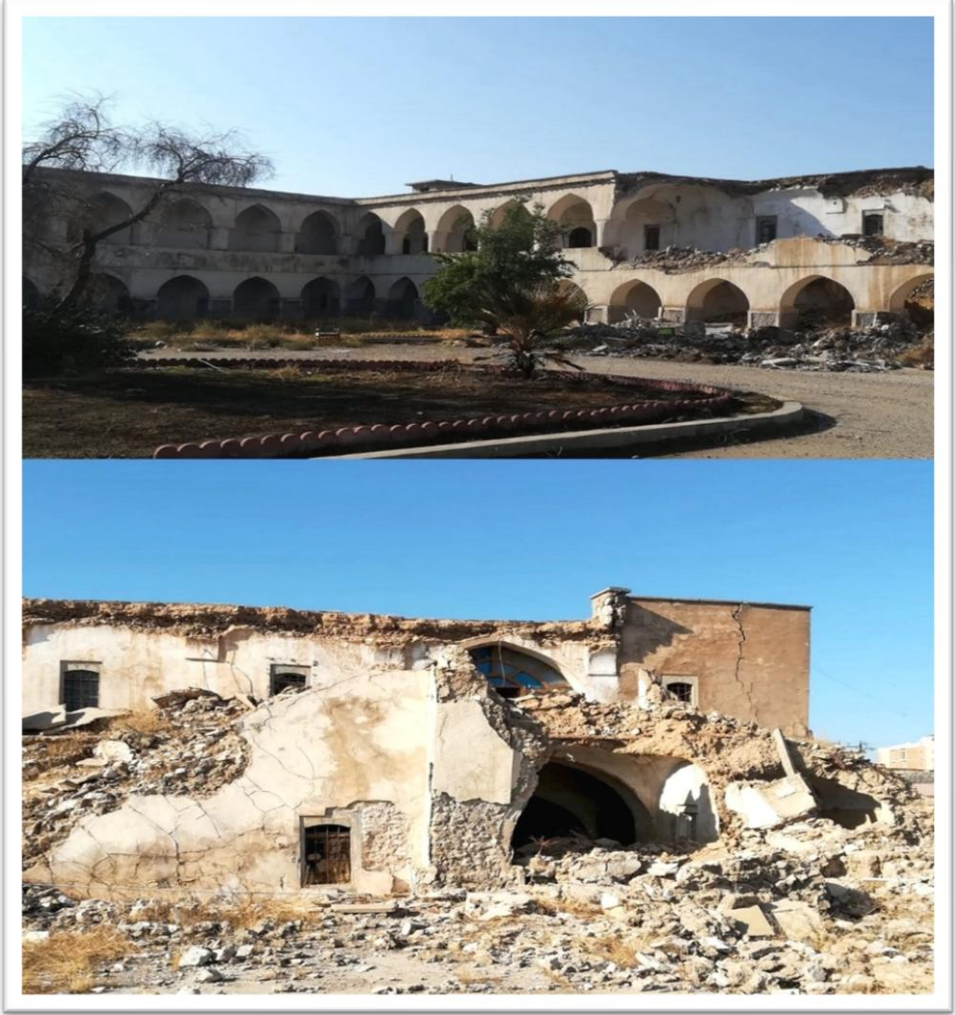
Kerkük Kışlası'nın Günümüzdeki Görünümü (2024)