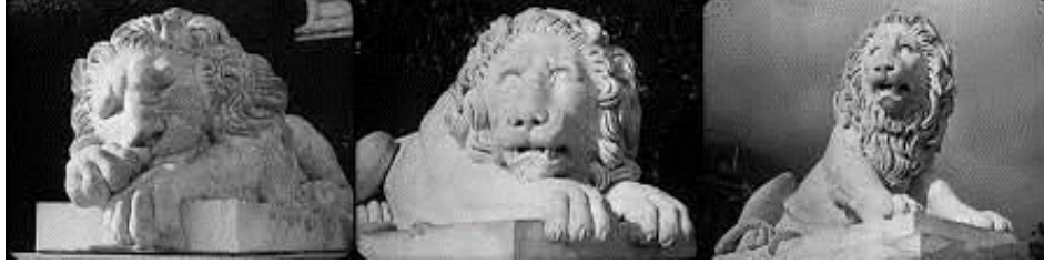
Şekil 2. Potemkin Zırhlısı (1925) Filmi Aslan Heykelleri

ayrım yapar. Ona göre doğal anlamlar, bütünlük taşıyan sürekli ve belirgin bir ifadeyi işaret etmeyen, örneğin bir çocuğun yüzüne okunan neşe gibi, durumlardır. Nitekim doğal ve bilinçli anlam arasındaki yaptığı ayrıma Eisenstein'ın Potemkin Zırhlısı filmindeki aslan heykellerini örnek gösterir.