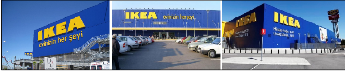
Şekil 1. İkea mağazalar zinciri: Ankara, İstanbul ve İsveç

Çokuluslu şirketlerin küresel markaları ve perakende deneyimleri: Çokuluslu şirketler ölçek ekonomisi ile çalışırlar. Aynı müşteri deneyimini tekrar ederek, pazarlama, reklam ve tasarım konularında tasarruf sağlarlar. Aynı zamanda kendilerini, özellikle yoksul ülkelerde, kendilerine karşı istekli yaşam biçiminin bir parçası olarak sunarlar (Anonymous, 2017). Dünyaya yayılmış uluslararası şirketler zinciri dünyanın birçok kentinde bulunarak kentsel mekânda benzer yerler ve yapılar (Şekil 1.) oluşturmaktadır (Kayan, 2015).