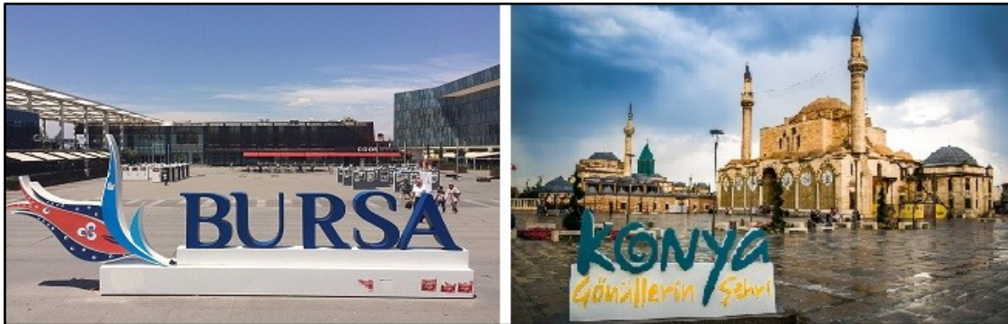
Şekil 8. Konya Mevlâna Meydanı ve Bursa Kent Meydanı

Konya’daki açık-yeşil alanlarda kullanılan malzemeler, inşaat yöntemleri, donatı elemanları ve peyzaj yapıları Türkiye’de farklı kentlerdeki açık-yeşil alanlarda da kullanılmaktadır. Bu nedenle Konya’daki bir açık-yeşil alanın Türkiye’nin farklı kentlerindeki açık-yeşil alanlara benzemesi de kaçınılmazdır (Şekil 8). Donatı elemanları için tek tip standart elemanlar kullanılması yerine; açık-yeşil alanın dokusu, ortaya koyduğu peyzaj ve üstlendiği işleve bağlı olarak donatı tasarımının yapılması ve mekân kurgusunun bilimsel ve teknik yöntemlerle ele alınması yerel yönetimlerin başlıca görevi olmalıdır (Özdemir Işık, vd., 2017).