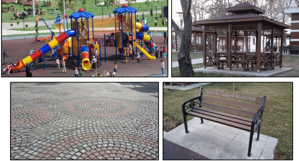
Şekil 7. Benzer malzeme ve donatı elemanları (çocuk oyun elemanı, gazebo, yer döşemesi ve oturma elemanı)

Konya’da kentsel açık-yeşil alanlarda kullanılan donatı elemanları (işaret ve bilgi levhası, aydınlatma elemanı, çöp kutusu, oturma elemanı, bitki kasası, spor aletleri, çocuk oyun elemanları) ve peyzaj yapıları da (köprü, çeşme, üst örtüler, havuz) seri üretimin ürünleridir. Benzer malzemelerden üretilmiş olup kent kimliğini ve kültürel özelliklerini yansıtmaktan uzaktır (Şekil 7). Oysaki donatı elemanları, açık-yeşil alan tasarımlarına doğru bir şekilde entegre edilirse bir kimlik ve mekan algısı oluşturur (Özdemir Işık, vd., 2017).