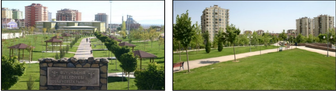
Şekil 10. Bosna Hersek Parkı ve Selahaddin Eyyubi Parkı (Anonim 2016)