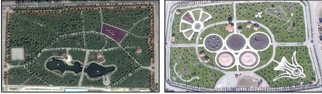
Şekil 5. Olimpiyat Parkı ve Adalet Parkı

Kentsel dokuyu oluşturan öğelerin mekân, form, renk, ışık, su, doğal peyzaj özellikleri gibi etmenlerden oluştuğu ve bu birleşim sonucu kentin fiziki yapısı şekillenmektedir. İnsan da bu birleşimde kentin ana eksenini oluşturmaktadır. Bütün bu etmenler, sanat ile yakın bir ilişki içindedir. Bu nedenle kentsel mekanların bir sanat ve tasarım ürünü olarak ele alınması gerekmektedir (Altıntaş & Eliri, 2012).