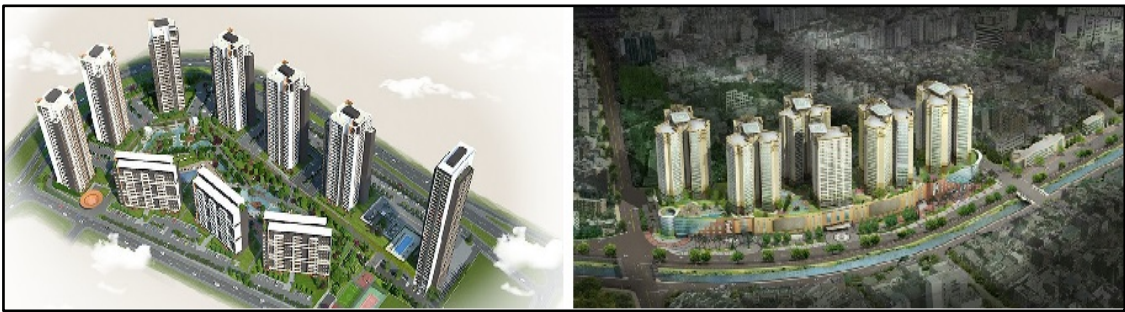
Şekil 3. İstanbul ve Seoul’de (Kore) kapalı yerleşme

Yaşam koşullarını iyileştirmek adına gönüllü olarak bireylerin bir araya gelmesiyle oluşan kapalı yerleşmeler (Şekil 3) ve koşulların dayatmasıyla oluşmuş gönülsüz bir birliktelik olan gettolar, sosyal ayrışmanın tipik örnekleridir. Sosyal ayrışma, toplumun zenginliklerini kent yaşamında deneyimlemeyi önlemektedir. Bu kapsamda kamusal alanlar, ortak yaşam alanı olması ve başkaları ile sosyalleşme imkânı sunması açısından önemli rol oynamaktadır. Parklar, bahçeler, meydanlar, caddeler, kafeler ve müzeler gibi açık ve kapalı kamusal alanlar diğer insanlarla bir araya gelme ve mekâna ilişkin deneyimlerin yaşanmasına imkân sağlar. Bu nedenle kamusal alanlar özellikle açık-yeşil alanlar, kentsel yaşamın özünü ve zenginliğini oluşturduğu için ayrışma sürecinden korunmalıdırlar (Del Guayo, 2013).