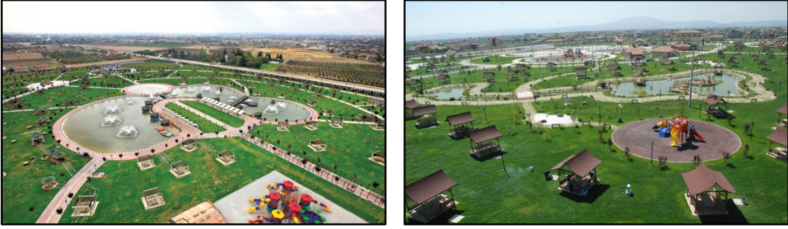
Şekil 6. Karaaslan Hadimi Parkı ve Olimpiyat Parkı

Kamusal mekanları güzelleştirmek, kimliğini vurgulamak, canlandırmak ve daha işlevsel hale getirmek amacıyla sanat organizasyonları gerçekleştirilmelidir. Özellikle yerel, ulusal veya uluslararası sanatçılar ile kent halkının katılımıyla yılın farklı zamanlarında gerçekleşen etkinlikler bireylerin belleklerinde ayırt edici bir etki oluşturmaktadır (Varol, 2004). İncelenen açık-yeşil alanların hiçbirinde sanatsal faaliyetlerden resim, müzik, geleneksel el sanatları, dans ve sokak tiyatrosu gibi etkinlikler yapılmamaktadır. Kelebekler Vadisi Parkında farklı noktalarda ve farklı büyüklükte amfi tiyatro olmasına rağmen hiçbir etkinlik yapılmamaktadır. Sadece Kültür Park'ta bulunan amfi tiyatrodaki yılın belirli dönemlerinde etkinlikler gerçekleştirilmektedir.