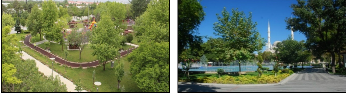
Şekil 11. Kültür Park ve Evliya Çelebi Parkı (Anonim 2016a)