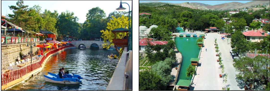
Şekil 12. Meram Dere (Anonim 2016)