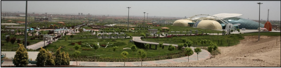
Şekil 9. Kelebekler Vadisi Parkı

Topoğrafya: Konya topraklarının büyük bir kısmı, geniş düzlüklere sahip ova özelliğindedir. Kentsel yerleşim, topoğrafik açıdan ortalama 1000 m yükseklikte bulunan oldukça düz bir arazi üzerinde yer almaktadır (Önder & Aklanoğlu, 2006). Topoğrafyanın düze yakın ve hareketsiz olması hem kentsel mekanlarda hem de yeşil alanlarda monotonluk yaratırken aynılaşmaya da neden olmaktadır. Topoğrafya, mekansal farklılıkları tasarımla ortaya koymak için kullanılacak doğal bir özelliktir. Bu nedenle topoğrafyadaki farklılıklar, yeşil alanın dinamik ve farklı olmasını sağlamaktadır. Kelebekler Vadisi Parkında topoğrafyanın doğal yapısı, diğer yeşil alanlardan farklı olmasını sağlayan en temel faktördür (Şekil 9). Diğer yeşil alanlar, düz bir topoğrafya üzerinde yer aldığı için monoton ve ayırt edici etkisi yoktur.