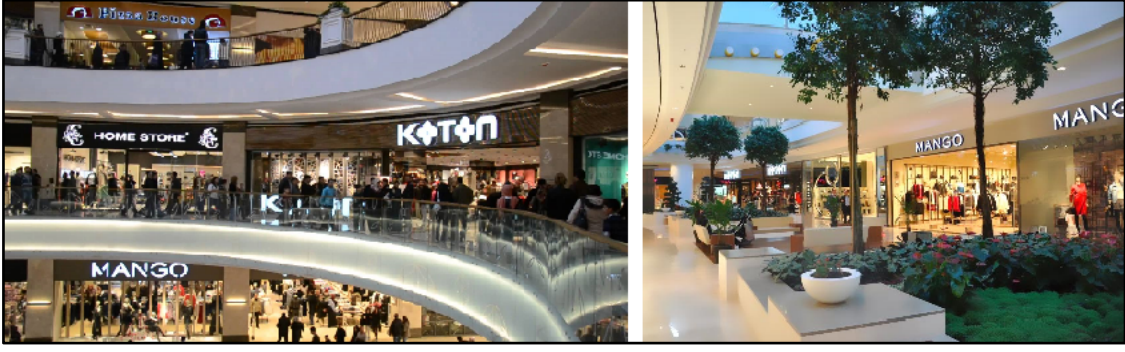
Şekil 2. Konya ve Ankara’da alış-veriş merkezi

Fonksiyonel ayrışma: 19. yüzyılda kentler barınma, çalışma, gezme ve eğlenme gibi karma kullanımların hepsini bir arada bulunduruyordu. Geçmişin aksine günümüz kentleri, farklı işlevlere göre bölünmektedir. Kentlerde yerleşim alanları, iş merkezleri veya alış-veriş merkezleri gibi farklı işlevlere ayrılmış bölgeler bulunmaktadır. Bu durum 20. ve 21. yüzyılda iletişim ve ulaşım alanındaki teknolojik gelişmelerin sonucu olarak ortaya çıkmıştır. İşlevlerin ayrılması kentlerin işleyişini geliştirirken belirli zaman dilimleri içinde ve belirli kişiler için hizmet vermek amacıyla ayrılan mekânlar oluşturmaktadır (Del Guayo, 2013).