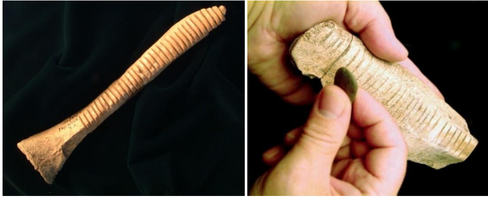
Görsel 2: Raspa ve Balıksırtı 2 .

Bu çağın çömlekçilik öncesi, önde gelen çalgıları ya da ses elde edilen nesnelere İdiyon adı verilen, kendinden tınlayan çalgılardır. En ilkel haliyle; iki taşın ya da kemiğin birbirine vurularak çıkarılan sesle, tunç çağı öncesi zil görevi yapan İdiyonlar ile koyun, keçi ya da sığırların kürek kemiklerinin üzerine açılan çentiklere sert bir cisimle sürtülerek çalınan “Raspa” ve “Balık Sırtı” (bkz. Görsel 2) vb. gibi isimler verilen vurmali çalgılardır. Anadolu’da üretilmiş ve Raspa olarak adlandırılmış olan çalgının, Türkiye’deki müze ve depolarda 40 civarında örneklerine, rastlanmaktadır. Bu süreçte Nefesli Çalgılar da öne çıkmaktadır. Bunlar arasında kavallar, düdükler (bkz. Görsel 3) ve bir ipe bağlı tahta ya da benzeri sert bir cismin havada döndürülmesi ile ses elde edilen ve “Boğa Kükreten” olarak isimlendirilen çalgılar sıralanabilir. Bunların dışında, ses çıkaran nesnelere; Çayönü, Grikihacıyan, Hallan, Cemi Tepesi, Sakça Gözü, Norsuntepe ve Aslantepeler gibi yerleşkelerde dini bir çerçeve içinde kullanıldığını gösterecek şekilde mezarlarda ve tapınma alanlarında bulunmuştur.