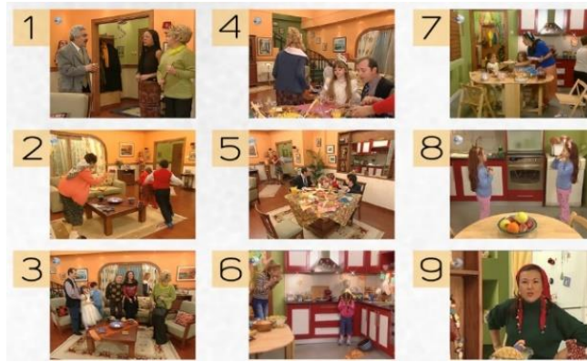
Şekil 5: Dizide kullanılan Betüş ve Sadık'ın oturma odası ve mutfak mekânlarının şematik plan ve görselleri (Görselleştirme E.G. Gencer'e aittir)