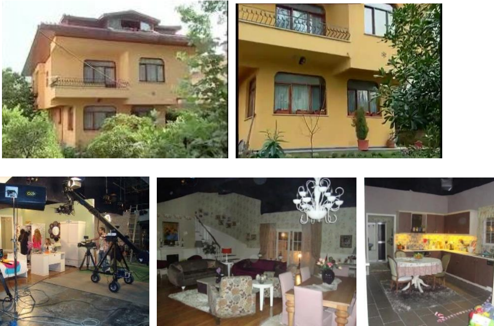
Şekil 4. Sihirli Annem dizisinde gösterilen konut cephesi ve dizi seti görselleri (URL 3-4-5)

Dizide seyircilere gösterilen konut cephesi mevcut olan bir konutu temsil etmesine rağmen iç mekanları stüdyo ortamında gerçek mekân kurgusu oluşturularak hazırlanmıştır (Şekil 4).