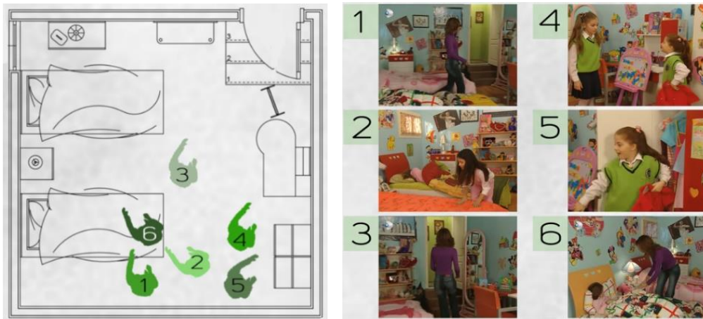
Şekil 7. Dizide kullanılan Çilek ve Ceren'in yatak odası mekânının şematik planı ve görselleri (Görselleştirme E.G. Gencer'e aittir)

Çilek ve Ceren'in ortak kullanmış olduğu yatak odasına oturma odasından üç basamakla aşağıya inilerek ulaşılmaktadır. Odada bir adet pencere bulunmaktadır. Duvarlarda nil yeşili benzeri bir renk kullanılmaktadır. Zemin laminant parke kaplamadır. İki kişinin kullandığı odada iki yatak bulunmasına rağmen bir çalışma masası, bir gar dolap, bir şifonyer yer almaktadır. Duvarlarda yoğun bir şekilde çizgi film karakterlerinin görselleri kullanılmaktadır (Şekil 7).