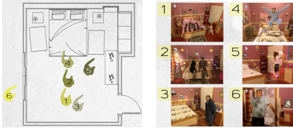
Şekil 6. Dizide kullanılan Betüş ve Sadık'ın yatak odası mekânının şematik planı ve görselleri (Görselleştirme E.G. Gencer'e aittir)

Betüş ve Sadık'ın yatak odası birinci katta yer alıp, oturma odasından ahşap dairesele merdiven ile ulaşılmaktadır. Yavru ağzı rengi oda duvarlarında yoğun bir biçimde kullanılmış ve duvarlardaki çiçekli bordür tüm odayı dolaşmaktadır. Yatak başı duvarda çerçeveler ve aplikler bulunmaktadır. Ahşap mobilyaların kullanıldığı mekânda gömme gar dolap panjur kapaklıdır. Zeminde etnik kilimler yer yer bulunmaktadır (Şekil 6).