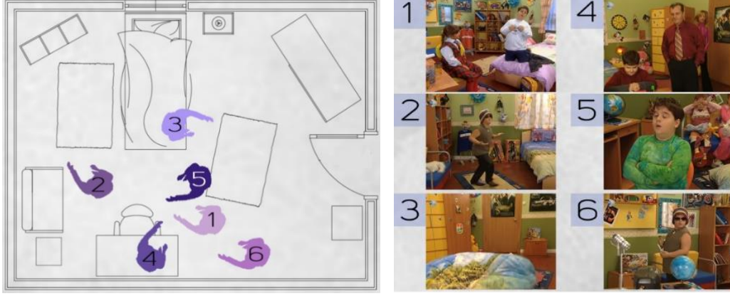
Şekil 8. Dizide kullanılan Cem'in yatak odası mekânının şematik planı ve görselleri (Görselleştirme E.G. Gencer'e aittir)

olduğu duvar yüzeylerinde, renk geçişinde desenli bordür kullanılmaktadır. Pencerenin olduğu duvar yüzeyinde tek kişilik yatak konumlandırılmıştır. Gerek duvar yüzeylerindeki afiş ve çerçeveler gerekse de mobilyalar üzerindeki aksesuarlar yoğun ve dağınık şekilde görünmektedir (Şekil 8).