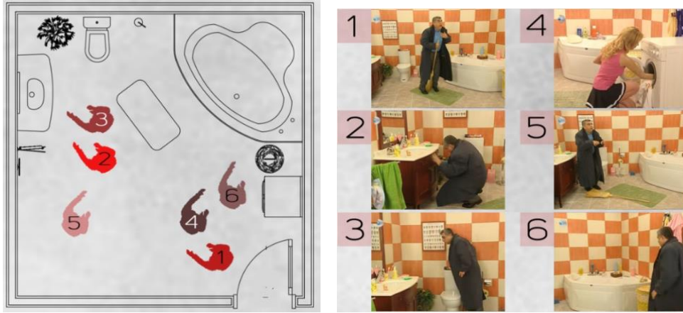
Şekil 9. Dizide kullanılan banyo mekânının şematik planı ve görselleri (Görselleştirme E.G. Gencer'e aittir)

Betüş-Sadık'ın evinde banyo mekânı birinci katta yer almaktadır. Oldukça geniş bir alana sahip banyonun duvarları turuncu-krem renkli damalı seramik ile kaplıdır. Banyoda bir adet küvet, hilton tipi lavabo, klozet, çamaşır makinesi bulunmaktadır. Küvetin etrafında mahremiyete yönelik bir kontrol sağlayacak öge kullanılmamaktadır. Zemin gri renkli seramik ile kaplıdır (Şekil 9).