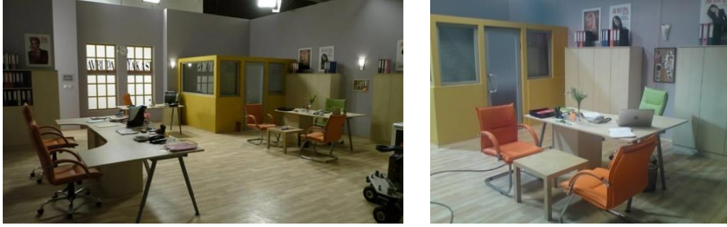
Şekil 1. Avrupa Yakası dizi seti (URL-1)

Günümüzde cinayetten fantastik dünyalara, bilim kurgudan korku ve gerilime, komediden maceraya, tarihî dönem dizilerinden gençlik dizilerine uzanan çeşitlilikte çok sayıda kategori altında türlü içerikler izleyicilerin beğenisine sunulmaktadır (Şenyüz, 2022: 46). Söz konusu dizilerin geçtiği mekanlar gerek gerçek gerekse de kurgusal olsun, en temel amacı izleyici kitlesine doğru bir biçimde hitap etmektir. Set ortamındaki her türlü yapı, mobilya, aksesuarlar gibi ayrıntıların bütünü dizinin içerik, karakter ve atmosferi yansıtabilmelidir (Yeğin, 2011).