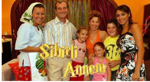
Şekil 3. Sihirli annem dizi görseli (URL-2)

Yapımcısı İnci Kırhan Gündoğdu olan Sihirli Annem dizisi, 2003-2012 yılları arasında 7 sezon yayınlanmıştır. Dizinin konusunda; Betüş isimindeki karakter Ceren ve Cem adında iki çocuklu ve dul olan Sadık ile evlenir. Betüş'ün annesi Dudu bu evliliğe karşı çıkar. Bütün sihirlerini kullanarak onları ayırmaya çalışır. Yaptığı kötü sihirlerin sonucunda sürekli Perihan'dan ceza alır. Betüş'ün karşı komşusu Avni perilerin varlığını bilmektedir ve sürekli onların evini dürbün ile izlemektedir. Bu nedenle eşi Suzan ile sürekli sorunlar yaşamaktadır (Şekil 3).