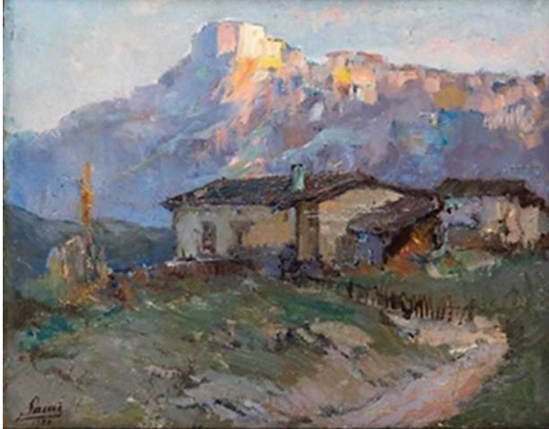
Şekil 4. Sami Yetik, Ankara Kalesi, 33 x 42 cm, Mukavva Üzerine Yağlı Boya, 1929

Onat'ın İstanbul odaklı bu anıtsal yaklaşımı, Sami Yetik'in Ankara Kalesi (Şekil 4) çalışmasında İç Anadolu'nun sert ve bozkır dokusuyla yeniden şekillenir. Belirgin gün ışığı etkisiyle vurgulanan ışık-gölge ilişkileri üzerinden anlık bir doğal gözlemin ürünü olarak beliren eserde, yoğun boya katmanları ve spatula kullanımı, kale mimarisinin sert taş dokusunu güçlü bir yüzey etkisiyle pekiştirir (Çalhan, 2024: 149). Yetik'in fırçasında kale, Millî Mücadele'nin ve yeni başkent kolektif hafızadaki sarsılmazlık ihtiyacını karşılayan sembolik bir dayanak noktasına dönüşür.