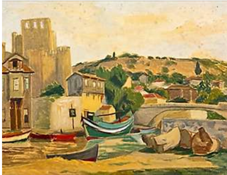
Şekil 13. Refik Epikman, Anadolu Hisarı, 38 x 50 cm, Karton Üzerine Yağlıboya

Bu rasyonel halkayı tamamlayan Refik Epikman ise, kaleyi ayrıntılardan arındırarak kütleli bir kurguyla ele alır (Şekil 13). Epikman'ın bu yaklaşımı, kalenin stratejik bir objeden tamamen form odaklı bir nesneye evrildiği rasyonel noktayı temsil eder. Sürecin son hazırlık aşamasında İbrahim Safi (Şekil 14), izlenimci tavrını mekânsal bir derinlikle birleştirerek kaleyi zihinsel bir imgeye dönüştürmeye başlar.