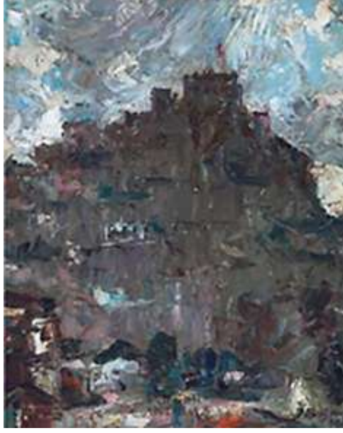
Şekil 14. İbrahim Safi, Ankara Kalesi, 42 x 33 cm, Duralit Üzerine Yağlıboya, 1955