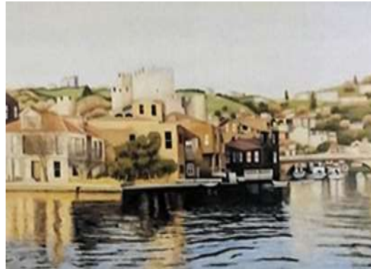
Şekil 17. Ayhan Köprülü, Anadolu Hisarı, 72 x 100 cm, TÜYB, 1988