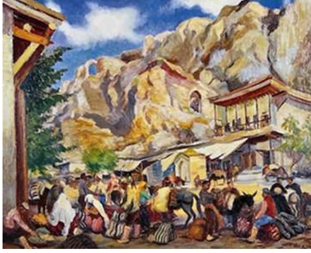
Şekil 8. Şeref Akdik, Kemah Kalesi Önünde Pazar, 60 x 50 cm, 1943

Kalenin bu sembolik inşası, Şeref Akdik ile birlikte toplumsal bir tanıklığa ve yaşayan bir organizmaya evrilir. Akdik, Kemah Kalesi Önünde Pazar (Şekil 8) eserinde kaleyi ışık ve gölge oyunları ile harmanlarken, figüratif unsurları canlı renk dokunuşlarıyla birleştirerek, yapıyı devinim halindeki bir sosyal bellek odağına dönüştürür. Çalışmada figürlerin günlük telaşı ile kalenin statik yapısının yarattığı tezat, izleyiciye geçici olan (insan ömrü) ile kalıcı olan (tarihsel mekân) arasındaki zaman döngüsünü hissettirir.