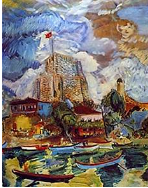
Şekil 7. Bedri Rahmi Eyüboğlu, Anadolu Hisarı, 65 x 50 cm.

Modernizmin geometrik sertliği, Bedri Rahmi Eyüboğlu'nun Anadolu Hisarı (Şekil 7) adlı eserinde yerini lekesel bir duyarlılığa ve yüzey parçalanışındaki ritmik bir kurguya bırakır. Sanatçı, kale mimarisini katı bir kütle olarak değil, kıvrak çizgiler ve renk oyunları ile yumuşatılmış, adeta yaşayan bir organizma gibi kurgular. Eyüboğlu sur yüzeyleri ve çevresel unsurlar üzerinde yoğunlaştırdığı stilizasyon, kalenin katı mimarisini 'nakışsı bir istif' anlayışıyla yeniden yorumlayarak askeri bir yapıyı estetik ve dinamik bir yüzeye dönüştürür. Özellikle kalenin en yüksek noktasında dalgalanan bayrak; yapının askeri geçmişine yapılan nostaljik bir atıf olmanın ötesinde, mekânı ulusal bir aidiyetle mühürleyen simgesel bir vurgu olarak öne çıkar. Böylece sanatçı, geçmişin savaş tahkimatlarını doğa ile bütünleşmiş, toplumsal belleğin dinamik ve renkli bir bileşeni haline getirerek mekânsal belleğin sembolleşme sürecini estetik bir düzlemde sunar (Giray, 2020: 427).