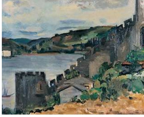
Şekil 12. Şefik Bursalı, Hisar, Tüyb, 1949