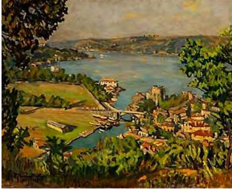
Şekil 3. Hikmet Onat, Göksu Deresi'nin Köprüsü ve Anadolu Hisarı'ndan Rumeli Hisarı'na Bakış, 64 x 84,5 cm, TÜYB, 1961

Şeker Ahmet Paşa'nın öncülük ettiği bu anıtsal bakış, Asker Ressamlar ve 1914 Kuşağı sanatçılarıyla daha sistematik bir yapıya bürünür. Hikmet Onat, kaleyi Boğaziçi topografyasının ayrılmaz bir parçası olarak kurgularken (Giray, 2020: 180), hisarların zaman karşısındaki direncini empresyonist bir ışık-atmosfer duyarlılığıyla görsel bir ritme dönüştürür (Giray, t.y.: 104). Onat'ın Göksu Deresi'nin Köprüsü ve Anadolu Hisarı'ndan Rumeli Hisarı'na Bakış (Şekil 3) adlı eseri, kentin modern yapılaşma öncesindeki yeşil dokusunu yansıtmaya bakımdan mekânsal geçmişin resimsel bir kanıtıdır.