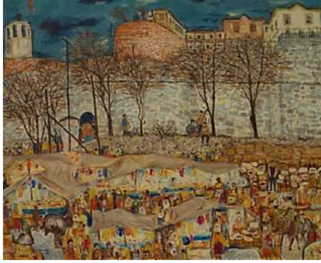
Şekil 15. Nevzat Akoral, Ankara Kalesi-Kale Eteğinde Pazar, 87 x 114 cm, TÜYB, 1971