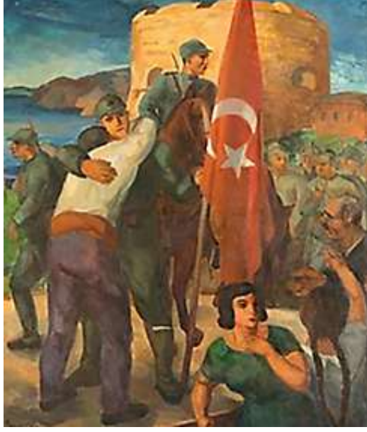
Şekil 6. Cevat Dereli, Çanakkale'ye Giriş, 150,5 x 130 cm, TÜYB, 1936