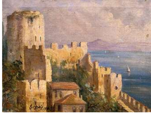
Şekil 11. Şevket Dağ, Rumelihisarı ve Boğaz, 30 x 40 cm, Tüyb