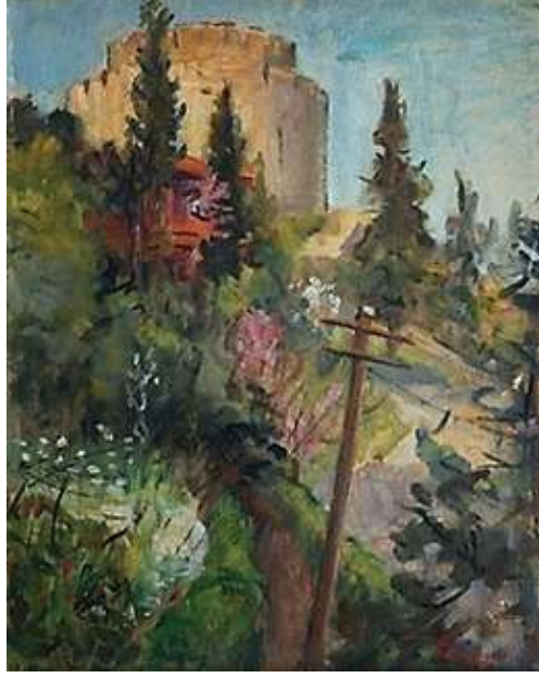
Şekil 5. Feyhaman Duran, Rumeli Hisarı, 1942

Feyhaman Duran ise Rumeli Hisarı (Şekil 5) çalışmasında, doğanın döngüsel geçiciliği ile tarihin doğrusal kalıcılığı arasındaki zıtlığı lirik bir dille görselleştirerek, hisarı kentsel değişim karşısında sarsılmayan bir tanıklık makamına yerleştirir (Giray, 2020: 205). Sanatçının biçimsel kurgusunda belirginleşen empresyonist sıcak renk ve ışık uyumu (Akdaş, 2011: 66), bireysel bir estetik tavrın ötesinde, kültürel mirasın korunmasına yönelik kolektif bir bilincin yansımasıdır.