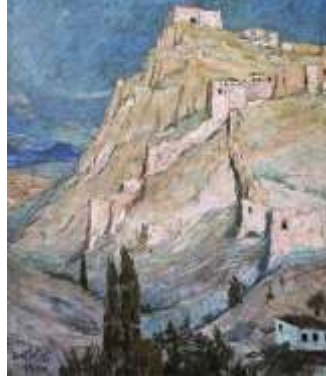
Şekil 9. Namık İsmail, Ankara Kalesi, 1927

Bu süreçte kale imgesi, Türk resminde izlenimci ışık duyarlılığı ile modernist form arayışları arasında bir denge unsuru haline gelmiştir. Namık İsmail (Şekil 9), Hayri Çizel (Şekil 10), Şevket Dağ (Şekil 11) ve Şefik Bursalı'nın (Şekil 12) kale temalı çalışmaları, doğa gözlemine tamamen terk etmeden, yapının anıtsallığını biçimsel bir değer olarak somutlaştırır. Söz konusu sanatçılar, geleneksel mekân algısından modern duyarlılığa geçişi sağlayan görsel bir köprü kurmuşlardır.