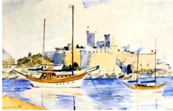
Şekil 16. Kemal Çelik, Bodrum, 40 x 60 cm, KÜSB, 1985

Nevzat Akoral ile başlayan bu metaforik açılım, kalenin fiziksel sınırlarından sıyrılarak birer kolektif hafıza nesnesine dönüştüğü bir süreçtir. Kemal Çelik, Şazi Hazer, Ayhan Köprülü ve Nihat Aybars'ın eserlerinde farklı teknik ve estetik üsluplarla mühürlenmiş kale, nesnel birer görüntü olmaktan çıkıp sanatçının zihninde öznel bir mekânsal bellek alanına dönüştüğünün görsel kanıtıdır. Özellikle Kemal Çelik'in Bodrum (Şekil 16) ve Ayhan Köprülü'nün Anadolu Hisarı (Şekil 17) çalışmalarında; suluboya şeffaflığı veya lekeci boya tuşlarıyla kale yapısı, doğanın ve ışığın içinde adeta eriyen bir forma dönüşür. Bu plastik dönüşüm neticesinde karşımızda artık aşılması gereken anıtsal bir katılık değil, duygu dünyasından süzülerek gelen öznel renk alanları olur.