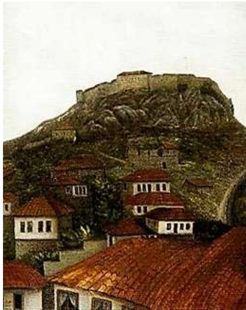
Şekil 2. Şeker Ahmet Paşa, Tepe Üstünde Kale ve Evler , 65 x 46 cm, TÜYB, 1898–1899

Halbwachs'a göre toplumsal düşünce ancak düzenli ve stabil bir fiziksel mekânda istikrar kazanır ve bireyin somut varlığı her zaman uzamsal bir çerçeveye ihtiyaç duyar (Halbwachs, 2017, akt: Üçer, 2024: 280-281). Bu geleneksel bakıştan rasyonel perspektife geçişin ilk somut örneği olan Şeker Ahmet Paşa'nın Tepe Üzerinde Kale ve Evler (Şekil 2) adlı çalışmasında kale, tepenin zirvesine konumlandırılan anıtsal bir perspektifle devlet otoritesinin sarsılmaz sembolü olarak kurgulanır. Evlerin kırmızı çatılarıyla desteklenen bu topografik kurgu, Paşa'nın Batılı anlamda mekân inşasındaki çözümleyici gücünü yansıtırken, bugün artık izine az rastlanan bir yerleşim dokusunu kültürel bir envanter olarak kayıt altına alır (Baloğlu, 2006: 76). Konutların yapıya yakınlığı, kolektif hafızadaki güvenlik ve aidiyet kodlarının korunduğunu gösterirken, kale, askerî bir tahkimat olmanın ötesine geçerek toplumsal kimliğin plastik bir dille mühürlendiği anıtsal bir bellek odağına dönüşür.