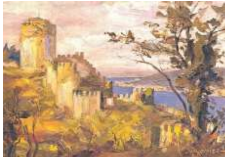
Şekil 10. Hayri Çizel, Hisar Tepelerinden Boğaz, 18 x 25 cm, TÜYB, 1947