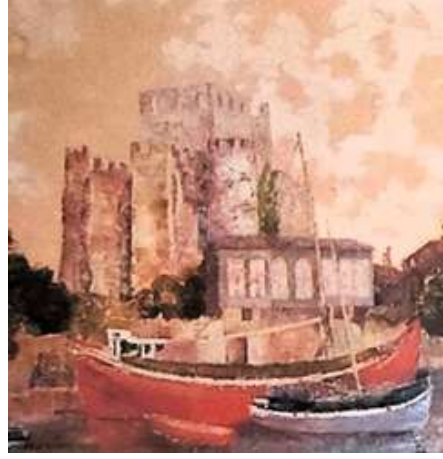
Şeki 19. Nihat Aybars, Manzara, 99 x 68 cm, DÜYB