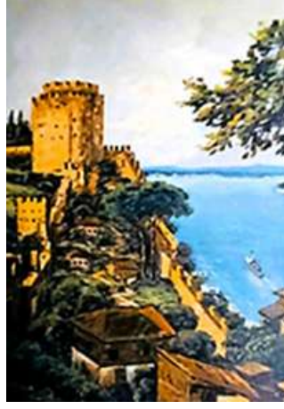
Şeki 18. Şazi Hazer, İsimsiz, 69,5 x 49,5 cm, TÜYB