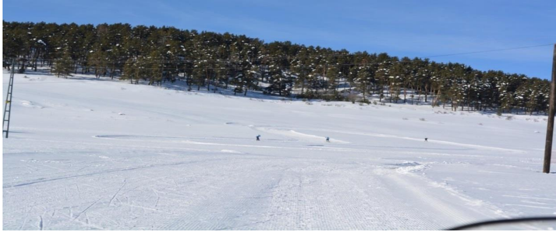
Resim 2. Sarıkamış kayak alanı

Sarıkamış ilçesi 1064 tarihinde Alparslan'ın Bizans Kalesi Ani şehrini, Kars kalesini, Allahu Ekber ve Soğanlı Dağlarını alması ile Sarıkamış da Türk