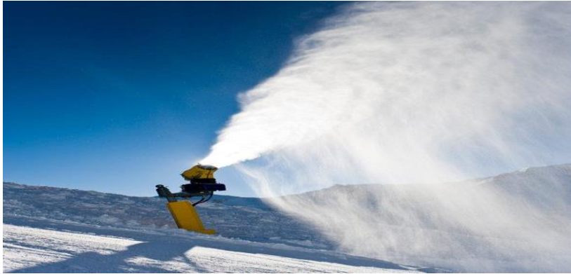
Resim 1. Yapay kar üretme makinesi

Turistlerin seyahat sırasında seyretme veya spor yapma arzusu son yıllarda önemli ölçüde artmıştır (Usta, 2008). Spor turizmi 'sporun turistik amaçlı kullanımı' olarak tanımlanmaktadır (Kurtzman, 1993: 6). Kış sporları ise tarihte en uzun süredir yapılan spor turizmi türleri arasında yer alır (Hudson, 2000). Sürdürülebilirlik kavramı ve kış sporları turizmi arasında karşılıklı bir etkileşim söz konusudur. Sürdürülebilirlik kavramı, temelinde doğal ve kültürel kaynakların varlığına dayanması nedeni ile turizm sektörü için oldukça hassas ve önemlidir (Acuner, 2015: 63). Bu bağlamda sürdürülebilirlik, bir destinasyonda kış sporları turizmini geliştirmeye çalışan yöneticiler için dikkate alınması gereken temel bir unsur olarak görülmektedir.