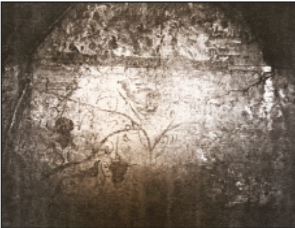
Res. 5 - Bayındıbi Mevkii 86 numaralı parselde bulunan mezar odasının güney duvarı.