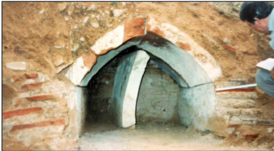
Res. 16 - Hespekli Mevkii'nde 1996 yılında bulunan sanduka biçiml mezar odası.