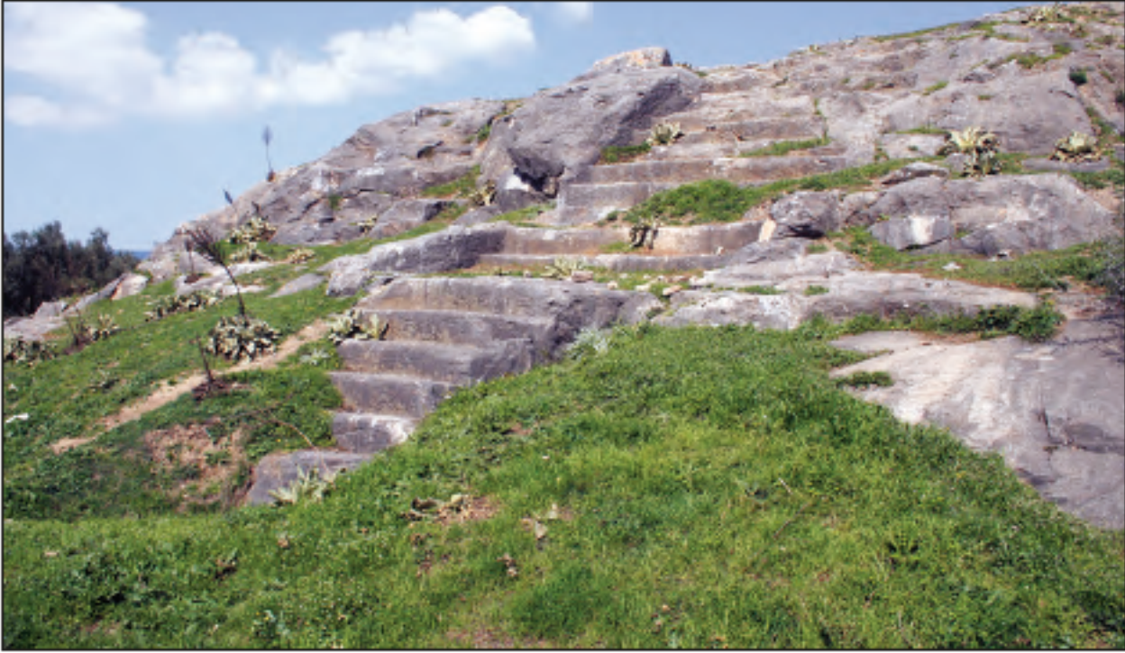
Res. 2 - Kuzey nekropoldeki merdivenli kaya, 2010.