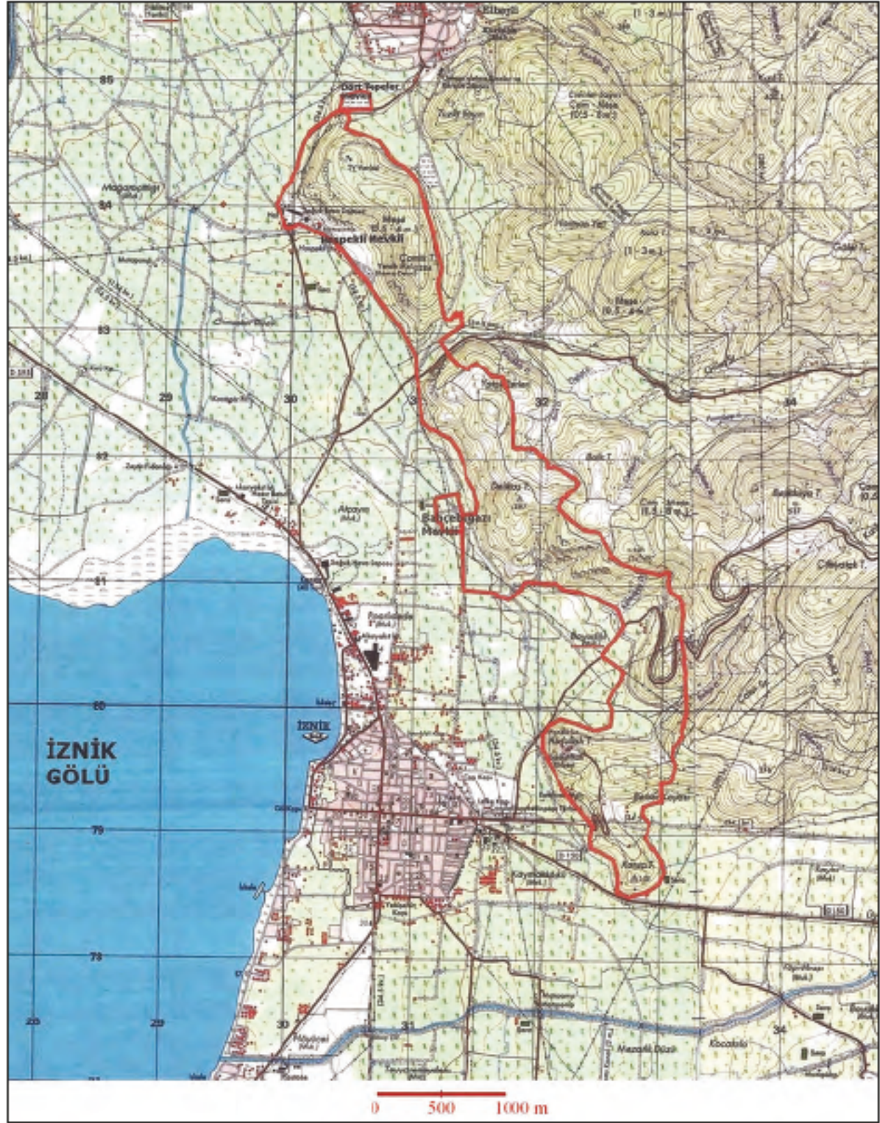
Res. 1 - Nekropol alanı olarak tescillenen bölgeyi gösteren harita (HGK'dan).