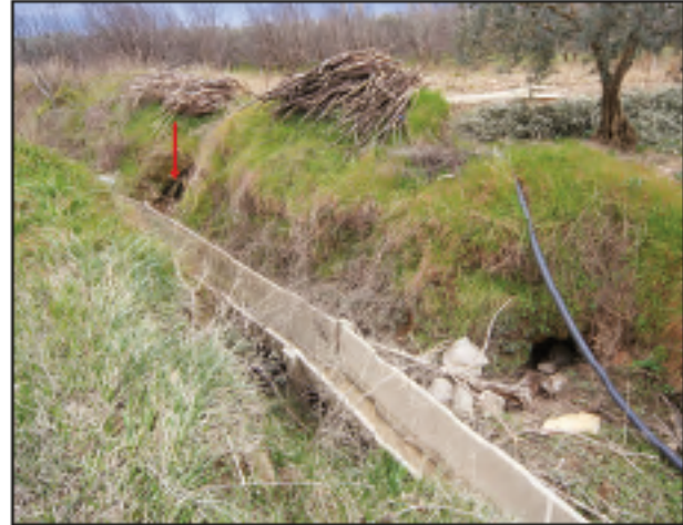
Res. 4 - Bayındıbi Mevkii 86 numaralı parseldeki mezar odasının su kanalıyla birlikte görünümü, 2011.