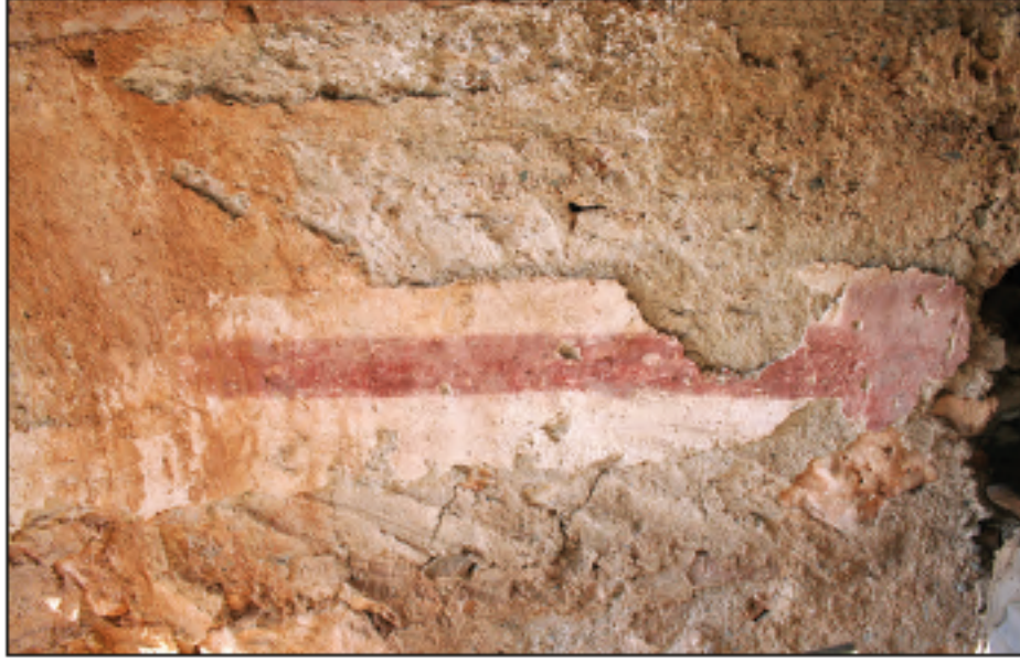
Res. 14 - Katırcıni Mevkii'ndeki mezar odasındaki kırmızı renkli şerit bezeme, 2009.