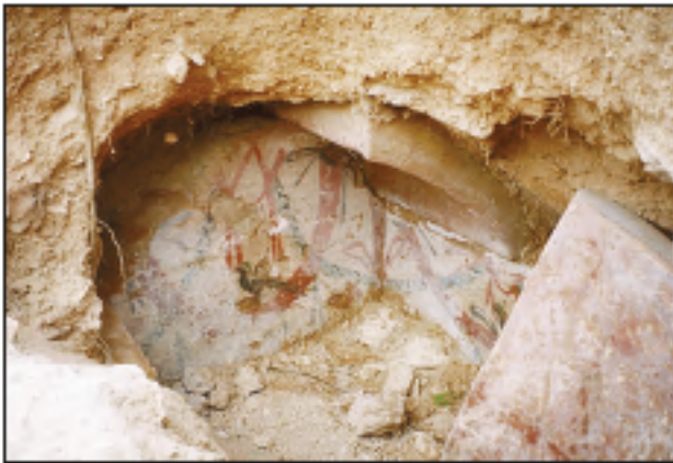
Res. 9 - Bahçeboğazi Mevkii'ndeki mezar odasının duvar resimleri.