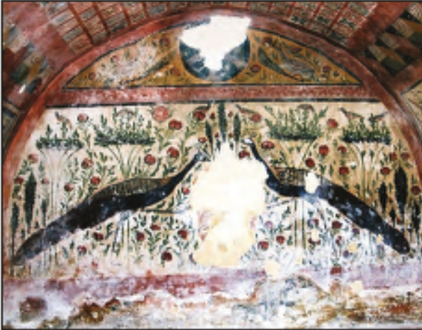
Res. 3 - Hespeklî Mevkii'ndeki mezar odasının doğu duvarı, 2005.