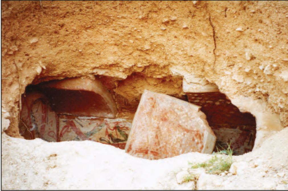
Res. 8 - Bahçeboğazi Mevkii'nde 2004 yılında bulunan mezar odası.