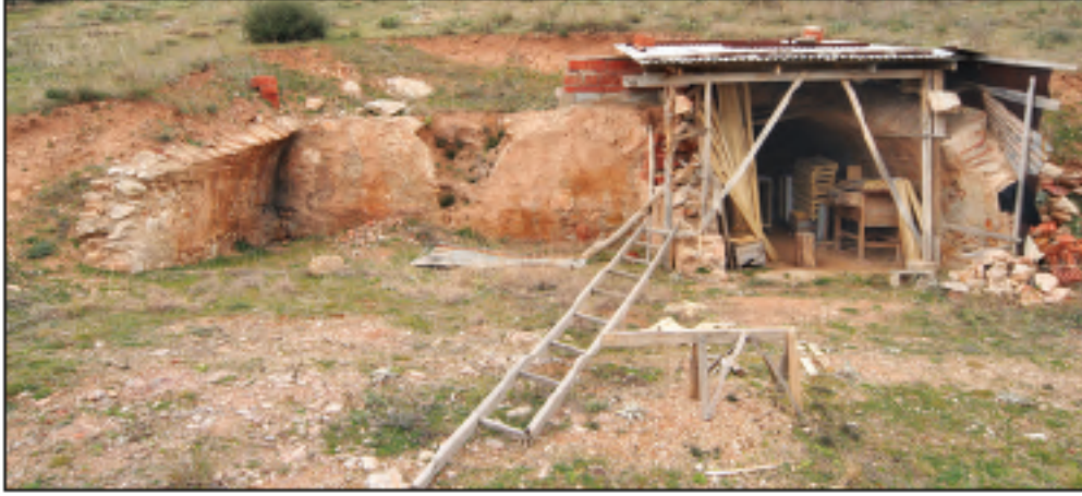
Res. 12 - Katırcıni Mevkii'ndeki mezar odası, 2011.