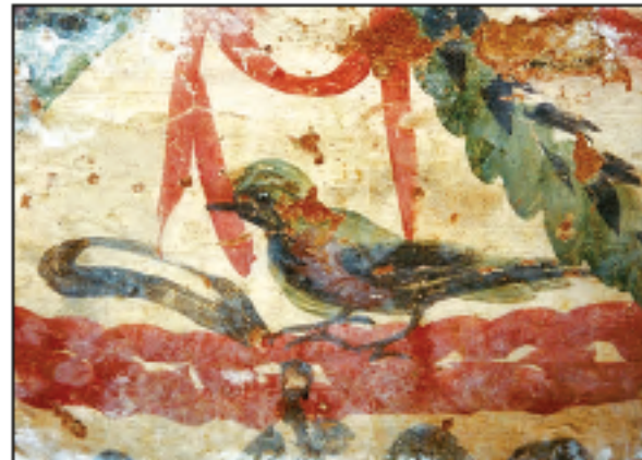
Res. 10 - Bahçeboğazi Mevkii'ndeki mezar odasının yan duvarındaki bezemeden detay.