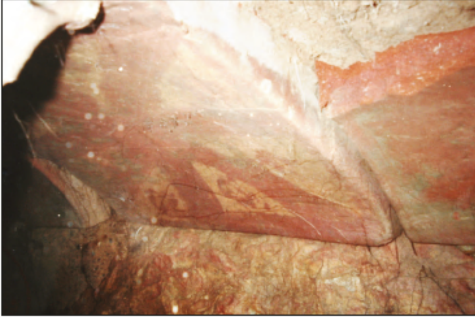
Res. 11 - Katırcıni Mevkii'ndeki sanduka biçimli mezar odasının üzerini örten plakanın iç yüzündeki kristogram (İzmit Müzesi Arşivi).