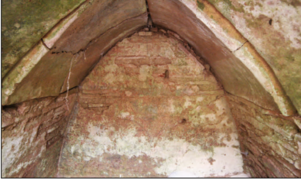
Res. 7 - 86 numaralı parseledeki mezar odasının güney duvarındaki duvar resminin günümüzdeki durumu, 2011.