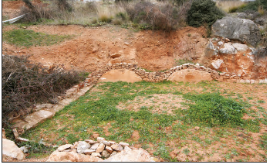
Res. 15 - Katırcıni Mevkii'nde 2011 yılında saptanan mezar odası, 2011.