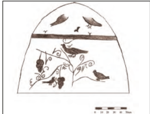
Res. 6 - Bayındıbi Mevkii 86 numaralı parselde bulunan mezar odasının güney duvarının çizimi.