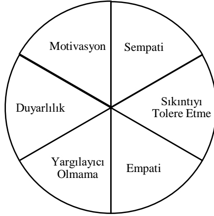
Şekil 2: Merhamet Kapasitesini Oluşturan Unsurlar

Motivasyon: Başkalarını desteklemek, yardımcı olabilmek için ilk aşama motive olabilmektir. Çünkü başkasına merhametli davranmak, onların sıkıntısını hafifletebilmek için belirli bir zaman ayırmak gerekmektedir. Aynı zamanda insan olarak kendimizi hangi değerler sistemine sahip olarak tanımlamak isteyip istemeyeceğimiz motive olmakla ilgilidir.