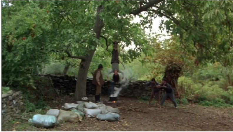
Şekil 12. Süt Filmi Görsel 1