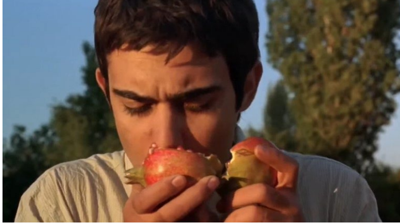
Şekil 13. Süt Filmi Görsel 2

Yan Anlam: Bir rüya gösterilmektedir. Rüyada bir kadın ayaklarından ağaca bağlanarak baş aşağı kaynayan süt kazanının üzerinde sarkıtılmaktadır. Başında duran adam dua yazılı bir kâğıdı sütün içine atar, kaynayan sütün buharı ile kadının ağızından yılan çıkar. Bu sahnede yılan, kadının içinde olan kötülüklerin dışarı atılarak arınmasını temsil etmektedir.