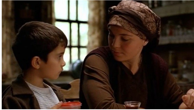
Şekil 26. Bal Filmi Görsel 6

Yan Anlam: Yusuf'un iletişimi annesiyle pekiyi değildir fakat Yusuf, babasının yokluğunda annesine yardım etmek için elinden gelen her şeyi yapmaktadır. Annesi yemekleri için bir şeyler hazırlamaktadır ve Yusuf da annesinin yumurta ihtiyacını kümeden taze yumurta getirerek karşılamaktadır. Bu sahnede yumurta, babasının artık olmayacağı yeni bir hayata adımı ve annesine yardımı temsil etmektedir.