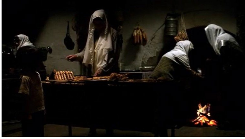
Şekil 29. Bal Filmi Görsel 9