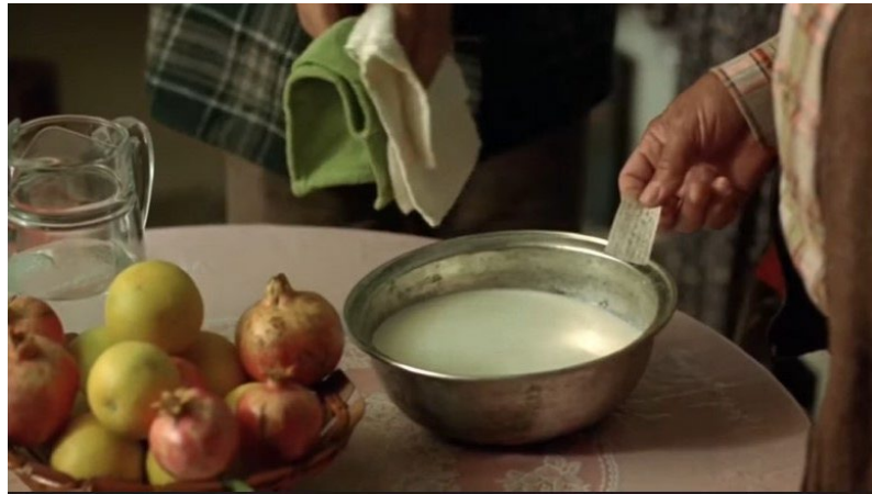
Şekil 14. Süt Filmi Görsel 3

Yan Anlam: Yusuf, rüyasında nar yediğini görmektedir. Narı özensiz bir şekilde ikiye ayırıp hızlı hızlı, kana kana ve iştahlı bir şekilde yemektedir. Narın bu şekilde yenmesi içindeki hırsın dışa vuruşunu, bastırılan duyguların ortaya çıkışını anlatmaktadır.