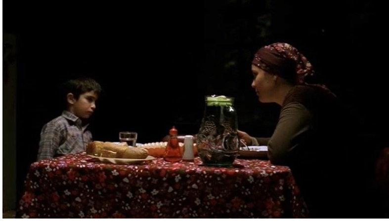
Şekil 27. Bal Filmi Görsel 7