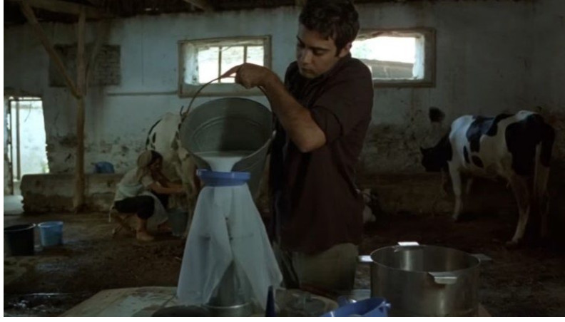
Şekil 15. Süt Filmi Görsel 4