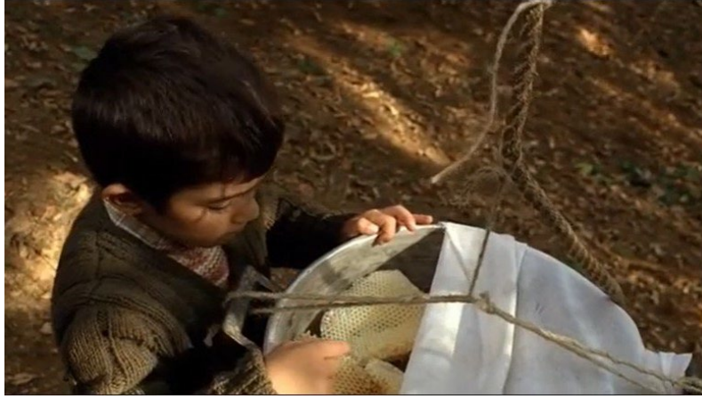
Şekil 23. Bal Filmi Görsel 3

oturarak akşam pişireceği taze fasulyeyi ayıklamaktadır. Bu sahnede taze fasulye ayıklama eylemi, akşam yemeği için hazırlığı temsil etmektedir.