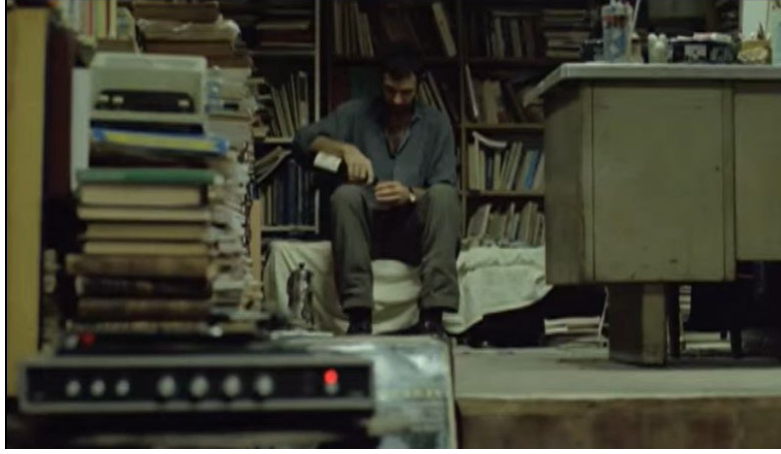
Şekil 3. Yumurta Filmi Görsel 1