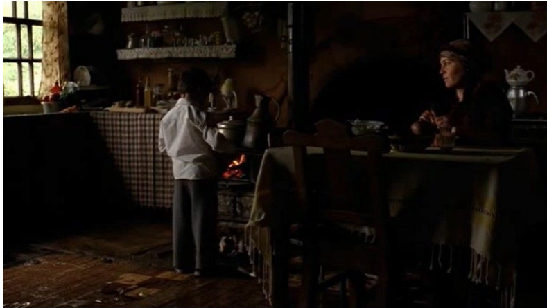
Şekil 22. Bal Filmi Görsel 2

Yan Anlam: Yusuf babasından başka kimseyle tam olarak konuşmayan ve babası ile konuşacak olduğunda fısıldaşarak konuşan, içine kapanık bir çocuktur. Babası onun içindeki cevheri ortaya çıkartmaya çalışmaktadır. Elmayı kesmesine izin vermesi de Yusuf'un kendi başına bir şeyleri başarabildiğini anlamasına, özgüvenini fark etmesine yardımcı olmaktadır. Bu sahnede Yusuf'un elmayı bıçakla ikiye bölmesi, babası ile kendisi arasındaki iletişimi ve paylaşımı temsil etmektedir.