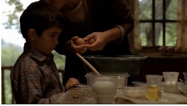
Şekil 25. Bal Filmi Görsel 5