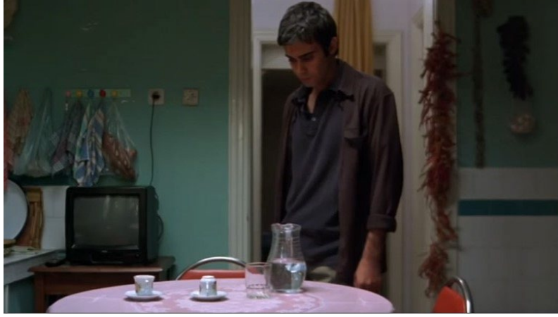
Şekil 17. Süt Filmi Görsel 6