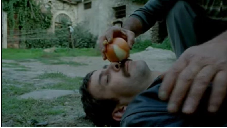
Şekil 7. Yumurta Filmi Görsel 5