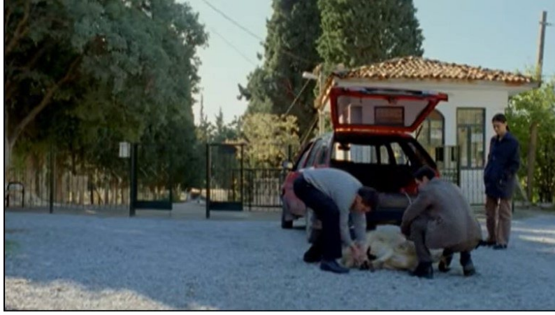
Şekil 9. Yumurta Filmi Görsel 7