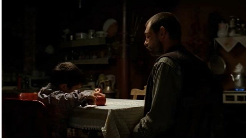
Şekil 21. Bal Filmi Görsel 1