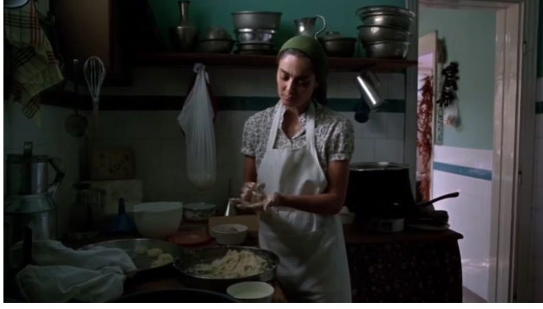
Şekil 19. Süt Filmi Görsel 8