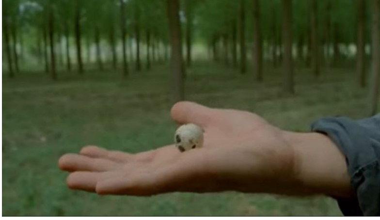
Şekil 5. Yumurta Filmi Görsel 3