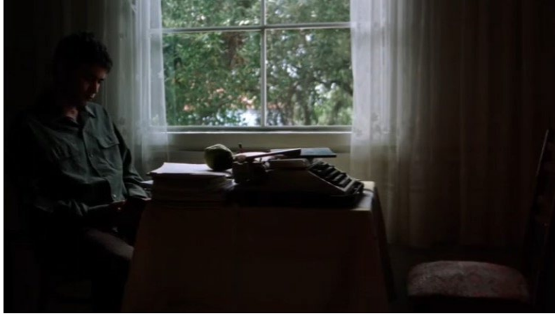
Şekil 18. Süt Filmi Görsel 7

Yan Anlam: Yusuf'un annesine görücü gelmiştir. İçilen kahveleri gören Yusuf bir şeylerin farkına varmaktadır. Görücü ile içilen kahvelerden birinin fal kapatıldığı görülmektedir. Kapatılan fal bir kişinin merak ettiği ve haber almak istediği bir olayı temsil etmektedir.