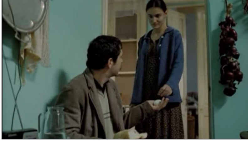
Şekil 11. Yumurta Filmi Görsel 9