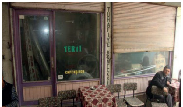
Fotoğraf 4. Dükkân (Ada 126 Parsel 10 ve 11) Kuzey Cephesi.

Dükkân (Ada 126 Parsel 10 ve 11): Kitirler Mahallesi, Hacı İpek Sokak No: 20'de yer alan, batı yönünde parsel 9'a ve doğu yönünde ise parsel 12'de bulunan tescilli dükkâna (Bkz. Fotoğraf 2A) bitişik dükkânın mülkiyeti İbrahim İpek'e aittir. Hacı İpek Hanı'nın zemin katının devamı niteliğinde ve hanın günümüzde kahvehane olarak kullanılan bölümünün karşısında olan dükkânın inşa tarihi kesin olarak bilinmemektedir. Malzeme ve malzeme kullanım tekniği ve handan sonra yapıldığı dikkate alınarak dükkânın 20. yüzyıl başlarına tarihlenebileceği söylenebilir. Kullanım alanı 27 m 2 olan dükkân günümüzde terzihane ve tuhafiyeci işlevleriyle faaliyet göstermektedir (Fotoğraf 4).