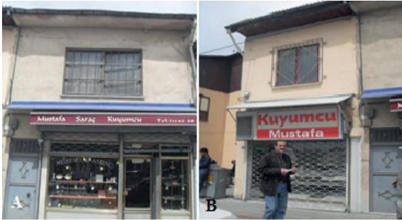
Fotoğraf 6.A. Dükkân (Ada 126 Parsel 18 ve 19) B. Dükkân (Ada 126 Parsel 20).