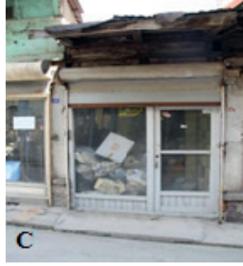
Fotoğraf 13.A. Arasta Dükkânı (Ada 56 Parsel 18) B. Arasta Dükkânı (Ada 56 Parsel 19) C. Arasta Dükkânı (Ada 56 Parsel 20).