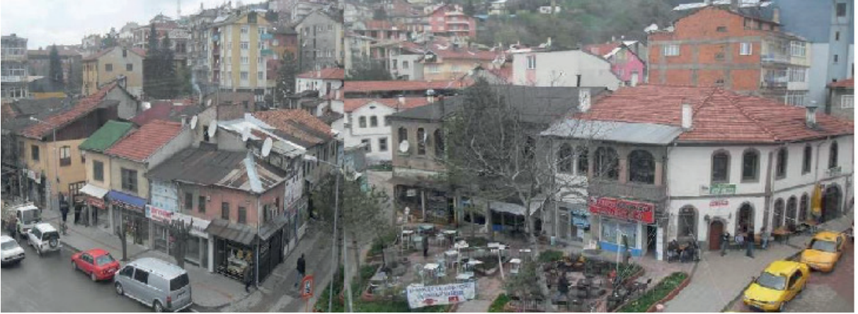
Fotoğraf 1. Gerede Kentsel Sit Alanı Genel Görünüm.

Çalışmaya konu olan ve arastalar bölgesi olarak ta-