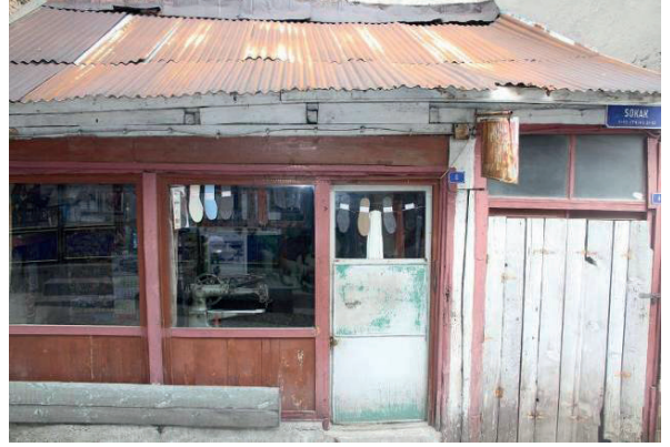
Fotoğraf 9. Arasta Dükkânı (Ada 55 Parsel 11 ve 12).