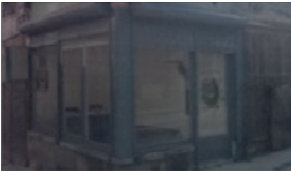
Fotoğraf 8.A. Arasta Dükkânı (Ada 54 Parsel 2) B. Arasta Dükkânı (Ada 55 Parsel 2) Doğu ve Kuzey Cephesi (Kullanılmıyor)