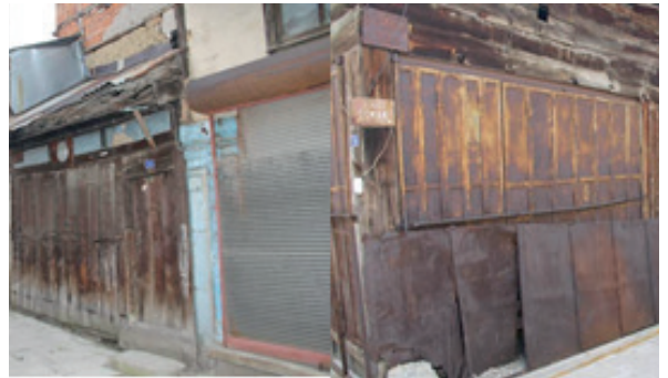
Fotoğraf 10. Arasta Dükkânı, (Ada 55 Parsel 15).

Dükkân (Ada 55 Parsel 15): Kitirler Mahallesi, Eskiciler Sokak No:10'da yer alan ve mülkiyeti Eşref Salihoğlu'na ait dükkân, batı yönünde yol boyunca sıralanmış diğer arasta dükkânlarına bitişik konumdadır. Günümüzde ayakkabı tamirhanesi olarak kullanılan ve 6 m 2 kullanım alanı bulunan dükkân yığma yapı tekniğiyle inşa edilmiştir (Fotoğraf 10).