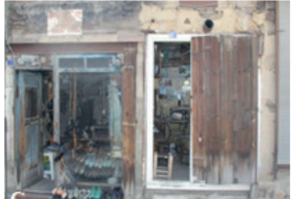
Fotoğraf 11.A. Arasta Dükkânı (Ada 56 Parsel 1) B. Arasta Dükkânı (Ada 56 Parsel 3) C. Arasta Dükkânı (Ada 56 Parsel 4) (Dikmen ve Toruk Arşivi, 2014).