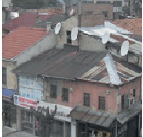
Fotoğraf 2.A. Dükkân (Ada 126 Parsel 12, 13, 14) B. Dükkân (Ada 126 Parsel 15) Doğu Cehesi C. Dükkân (Ada 126 Parsel 15) Güney Cehesi D. Dükkân (Ada 126 Parsel 15, 16, 17) Güney Cehesi (Dikmen ve Toruk Arşivi, 2014).