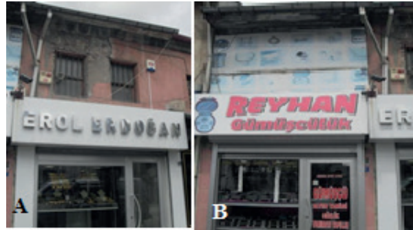
Fotoğraf 5.A. Dükkân (Ada 126 Parsel 16) B. Dükkân (Ada 126 Parsel 17) (Dikmen ve Toruk Arşivi, 2014).