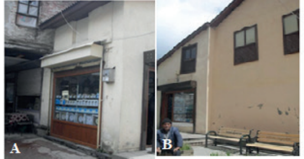
Fotoğraf 3. Dükkân (Ada 126 Parsel 9) A. Kuzey Cephesi B. Batı Cephesi.

dır. Batı ve kuzey yönlerinde cephe veren dükkâna, batı yönünde Turan Sokak üzerinden erişilmektedir. Dükkânın batı cephesi üst katında (kalkan duvarı üzerinde) dikdörtgen formda, giyotin, altı kafesli tek bir pencere bulunmaktadır. Özgün yapısı ve yapım tarihi bilinmeyen dükkân, Hacı İpek Hanı'ndan daha sonra yapıldığına göre 19. yüzyıl sonu-20. yüzyıl başlarında inşa edilmiş olmalıdır. Özgün bir yapı sergilememekle birlikte tescilli Hacı İpek Hanı'na bağımlı olmasından dolayı dükkânın tescili önerilmiştir. (Fotoğraf 3).