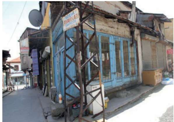
Fotoğraf 14. Arasta Dükkânı (Ayakkabı Tamirhanesi) (Ada 57 Parsel 10).

Dükkân (Ada 57 Parsel 10): Kitirler Mahallesi, Tiftikçi Sokak No: 11’deki, mülkiyeti Reşide Nergiz’e ait olan dükkân, batı yönünde kendi kullanım alanına yakın büyüklükte ve ayakkabı tamirhanesi olarak kullanılan bir başka dükkâna bitişik konumdadır. Ayakkabı tamirhanesi olan özgün işlevini günümüzde de sürdüren ve yığma yapı tekniğiyle inşa edilmiş dükkânın kullanım alanı 12 m 2 ’dir. Köşe parselde yer alan, kuzey ve doğu cephelerin giriş sağlanan dükkân sokak kotundan yukarıda tesis edilmiştir. Dükkânın sundurma çatısı oluklu levha kaplamadır (Fotoğraf 14).