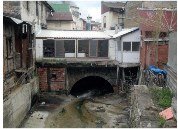
Fotoğraf 7. Dükkân (Ada 127 Parsel 4 ve 8) (Dikmen ve Toruk Arşivi, 2014).

tedir. Dükkânın ve üzerinde konumlandığı köprü kemerinin inşa tarihi kesin olarak bilinmemektedir. Dere yatağının zaman içerisinde dolması nedeniyle algılanamayan kemer ayaklarının mimari özelliklerini tahmin etmek güçtür. Ancak malzeme, malzeme kullanım tekniği ve birlikte formundan kemerin 19. yüzyıl sonu-20. yüzyıl başında yapıldığı düşünülmektedir. Yiğma yapı tekniğiyle inşa edilen, 22 m 2 kullanım alanına sahip olan ve günümüzde kullanılmayan dükkânın da malzeme ve malzeme kullanım tekniği dikkate alınarak 20. yüzyıl başında inşa edilmiş olabileceği söylenebilir. Dükkânın özgün yapısına yönelik özellikler görülmemekle birlikte, bitişik konumda olduğu han ve üzerinde yer aldığı kemer nedeniyle tescili önerilmiştir (Fotoğraf 7).