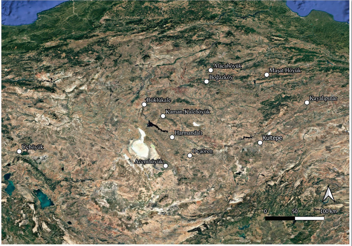
Harita 1. Makalede adı geçen yerleşimleri gösteren harita

Orta Anadolu Bölgesi içerisinde; batıda Aksaray ili sınırları içindeki Ekecik Dağları, kuzeyde Kızılırmak Nehri ve güneyde Erdaş ile Hodul Dağları ile sınırlanan Kapadokya'nın kuzeybatısına dair arkeolojik veriler oldukça sınırlıdır; bu veriler büyük ölçüde S. Omura (Omura, 1993; Omura, 1994; Omura, 1997; Omura, 1998) ve S. Y. Şenyurt tarafından yürütülen yüzey araştırmaları ile kazı çalışmalarına dayanmaktadır (Şenyurt, 1999; Şenyurt, 2000). Bölgeye ilişkin genel bulgular, Matsumura ve Weeden (2017) tarafından Orta Anadolu'nun batı kesimlerine odaklanan daha geniş ölçekli bir değerlendirme bağlamında ele alınmıştır. Bu çalışma ise aynı coğrafi çerçevede yer alan ve 2007 yılından beri kazı çalışmalarının yürütüldüğü Ovaören yerleşimini merkeze alarak, Geç Tunç Çağı (MÖ 1650-1200) süreci içerisinde Kapadokya çevresine dair yerel bağlamda bir katkı sunmayı hedeflemektedir.