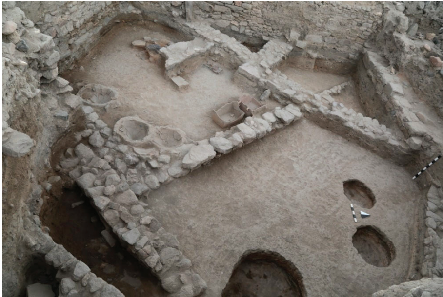
Fotoğraf 2. Ovaören JA 175 ve JA 176 açmalarındaki Geç Tunç Çağı'na Ait Kalıntılar

içerisinde Red Lustrous Wheel-made Ware (RLWm) grubuna ait parçalar da tespit edilmiştir. Geç Tunç Çağı'na ait diğer mimari kalıntılar ise JA-175 ve JA-176 açmalarında ortaya çıkarılmıştır. Bu alanda iki farklı tabaka tam olarak belgelenmiş olup, ilk evrede bir mekân içerisinde yan yana yerleştirilmiş iki adet pişmiş toprak banyo küveti, birkaç büyük boyutlu küp ve bir ocak yapısı tespit edilmiştir (Fotoğraf 2) (Şenyurt vd. 2019: 261-262). Bu buluntular yapıların işleviyle ilgili fikir verebilir ancak çok az kısmı açığa çıkartıldığı için eldeki veriler kesin bir yorumu şimdilik mümkün kılmamaktadır. Alandan elde edilen C14 tarihleri ve seramik analizi sonuçları, bu alanın Eski Hitit Dönemi'nden başlayarak Hitit İmparatorluk Dönemi'nin başlarına kadar kullanımda olduğunu ortaya koymaktadır. Ovaören'de yapılan kazılarda şu ana kadar çivi yazılı tabletlere ya da Luwi hiyeroglifli mühür ve mühür baskıları gibi buluntulara ise rastlanmamıştır. Bu durum Ovaören'in Geç Tunç Çağı'ndaki adının tespitini zorlaştırmaktadır 2 .