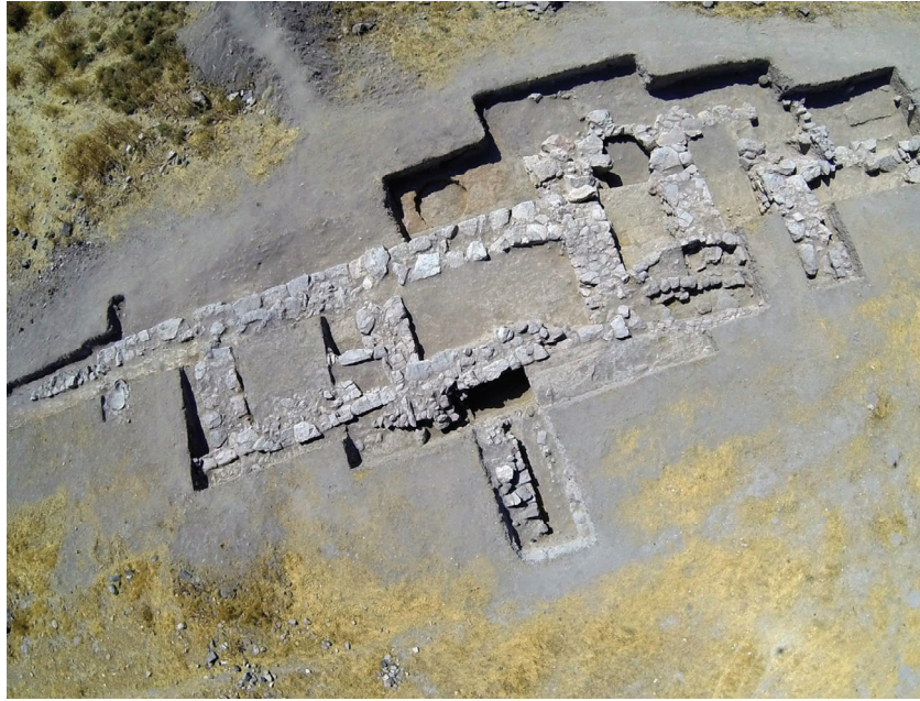
Fotoğraf 1. Ovaören Geç Tunç Çağı Sandık Duvarlı Sur Sistemi

Yassihöyük'e kaymasının nedeni henüz açıklığa kavuşmamıştır. Orta Anadolu genelinde, Hitit devletleşme süreciyle birlikte yerleşimlerin dağlık alanlara yöneldiği görülür. Ancak Ovaören'in düz bir ovada Geç Tunç Çağı boyunca iskân edilmesi, bu modelin Kızılırmak'ın güneyinde geçerli olmadığını göstermektedir. Bu durum, bölgede peyzajla daha uyumlu, çevresel olanaklara dayalı bir yerleşim stratejisinin benimsendiğini düşündürmektedir (Matsumura-Weeden, 2017: 114, 116). Göstesin Ovası'nda konumlanan Ovaören, günümüzde dahi sulak özelliklerini koruyan ve tarıma elverişli geniş arazilere sahip bir çevrede yer alır. Kuzeyde Kızılırmak boylarının sunduğu geçiş imkânları ve güneyde Kilikya yönüne uzanan yollarla olan bağlantısı, yerleşimin sürekliliğinde etkili olmuş olmalıdır.