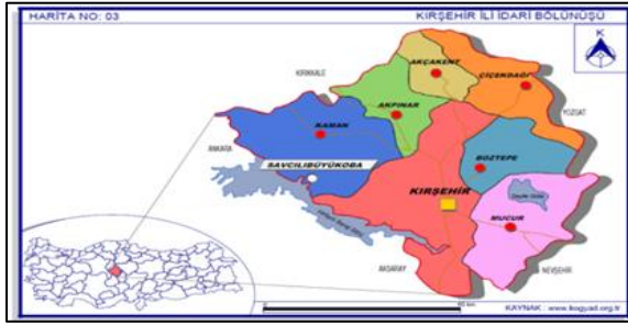
Şekil 1. Araştırma alanının coğrafi konumu

Bu çalışmanın materyalini Savcılı Büyükoba köyü kırsal peyzaj özellikleri oluşturmaktadır. Araştırma alanı olarak seçilen Savcılı Büyükoba köyü, İç Anadolu Bölgesi'nde bulunur. Savcılı Büyükoba, Kırşehir ilinin Kaman ilçesine bağlı Hirfanlı Baraj gölüne kıyısı bulunan, bir köydür (Şekil 1).