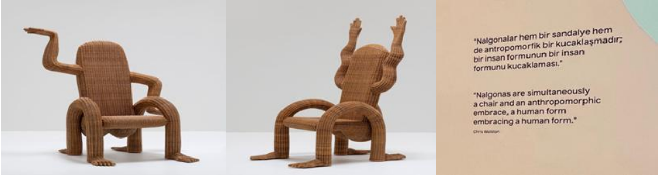
Şekil 8. Nalgon Sandalyeler (Ommxart, 2025)