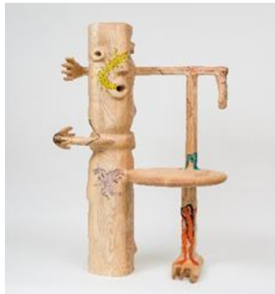
Şekil 4. Heykel Sandalye