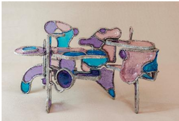
Şekil 2. Sehpa