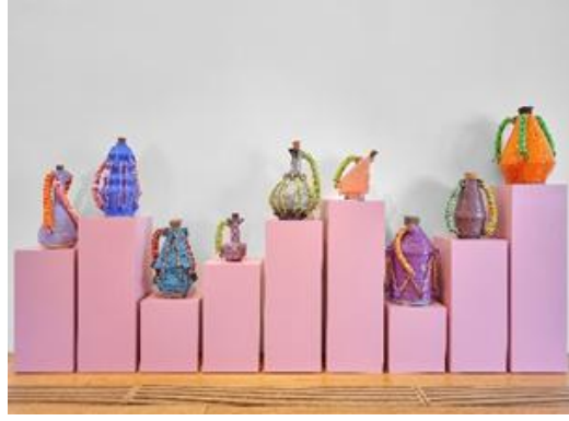
Şekil 5. Seramik Eserler