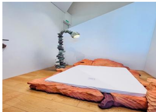
Şekil 10. Yatak ve Lamba Enstalasyonu