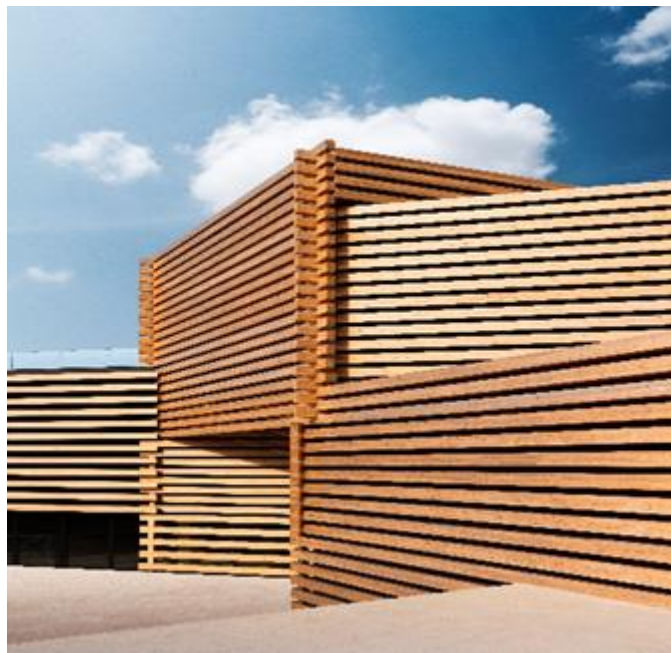
Şekil 11. OMM

Müzenin dış cephesinde yoğun olarak kullanılan ahşap malzeme, hem Odunpazarı bölgesinin geçmişte bir odun ticaret merkezi olmasıyla hem de geleneksel Osmanlı konut mimarisinin temel malzemelerinden biri olmasıyla geçmişe yönelik referans taşımakta, ayrıca ahşap malzemenin doğal ve sıcak dokusuyla geçmişin geleneksel yapı malzemelerini anımsatmaktadır (Şekil 11). Müzenin tasarımında, "Osmanlı'nın geleneksel evlerinden ilham alınması" ve geleneksel ahşap yapım yöntemlerinin çağdaş yapıya uyarlanarak kullanılması, geçmiş ve geleceğin şimdide birleştirilmesi özelliğine işaret etmektedir. Tarihi formlar ve malzemeler, modern estetikle yeniden işlenerek bugünün mimarisine entegre edilmiştir. OMM'nin modern yapısının Odunpazarı'nın geleneksel mimari yapısıyla bütünleşmesi, farklı zaman katmanlarının birlikte var olmasına bir örnektir. Ek olarak, OMM'nin kalıcı ve geçici sergilerinin yanı sıra, farklı dönemlere ait modern ve çağdaş eserlerin bir arada sergilenmesi, geçmişteki ile günümüzdeki sanatsal anlatıları ortak bir platforma taşımaktadır. Bu yaklaşım, farklı zaman dilimlerindeki sanatsal üretimler arasındaki iletişimi ve bağı vurgulamaktadır. OMM'de kronoloji koşulunun öğretilmesinde olduğu gibi, geçmişle şimdiki zaman arasındaki bağlar güçlendirilmekte, geçmiş ve gelecek, şimdide birleştirilmektedir.