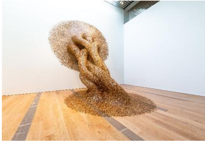
Şekil 1. Ağaç Formunda Enstalasyon