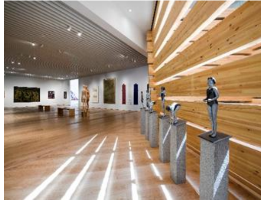
Şekil 7. Yüzme Figürlü Heykeller