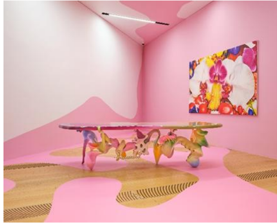
Şekil 12. Pembe Oda

Çoğulculuk anlayışı, gözlem formuna kaydedilen bir eserde de kendini göstermektedir. Pembe oda farklı malzemeleri ve formları bir araya getiren, pembe rengin hâkim olduğu, parlak ve yapay görünümlü yüzeylere sahip bir mobilyalarla döşeli bir odadır (Şekil 12). Burada geleneksel mobilya malzemeleri ve tasarımları reddedilerek, özgün ve sınırları zorlayan bir yaklaşım benimsenmiştir. Ayrıca eserdeki parlak renkler ve yapaylık hissi, popüler kültür ve tüketim nesnelere gönderme yapmakta, organik ve fantastik öğeler ise daha yüksek sanat referansları taşıyabilmektedir. Kültürel ayrımların bu eserdeki gibi ortadan kalkması, postmodern estetik anlayışının bir parçasıdır. Farklı malzemelerin ve formların serbestçe bir araya getirilmesi postmodernizmin "her şey gider" anlayışını yansıtmakta, çoğulculuğun "hiçbirşey dışarıda bırakılmaz" anlayışı, OMM'de gün yüzüne çıkmaktadır.