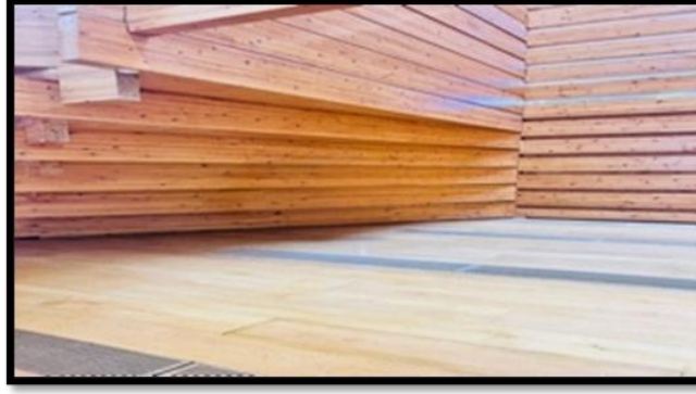
Şekil 3. Katmanlı Ahşap Lameleri