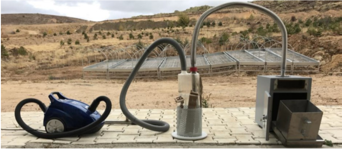
Figure 1. Equipment used in the preparation of plant-derived smoke solution (Başaran et al., 2019)

Yakma işlemi, Yozgat Bozok Üniversitesi Ziraat Fakültesine ait serbest alanda gerçekleştirilmiştir. Bu amaçla, fındık zurufları sabit ağırlığa gelinceye kadar 65°C'de etüvde kurutulmuş 1'er kg kuru atık özel bir mekanizma kullanılarak yakılmıştır. Yanma sırasında ortaya çıkan duman kabarcıkları 4 L musluk suyu içerisinde geçirilmiş ve bitkisel materyaller tamamen yanana kadar yakma işlemine devam edilmiştir (~30-45 dk). Hazırlanan konsantre duman çözeltileri (1/1, v/v) Whatman filtre kağıdı yardımıyla süzülerek, uygulamaların yapılacağı zamanına kadar 4°C'de muhafaza edilmiştir.