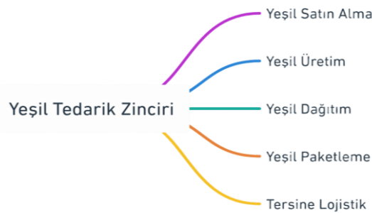
Şekil 3: Yeşil Tedarik Zinciri Diyagramı

Tedarik zincirine çevre odaklı “yeşil” bir yaklaşımın entegre edilmesiyle, kapsam genişlemiş ve yeşil satın alma, yeşil üretim ve malzeme yönetimi, yeşil dağıtım ve pazarlama ile tersine lojistik gibi sürdürülebilirlik temelli yeni kavramlar literatürde yerini almıştır. (Hervani vd.,2005: 334).