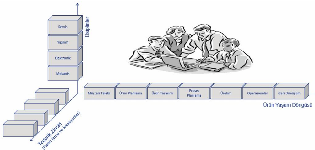
Şekil 1: Ürün Geliştirme Sürecinde Çok Yönlü Kurumsal Mühendislik

Ürün Yaşam Döngüsü Yönetimi (PLM), bir ürünün fikir aşamasından hurdaya ayrılmasına kadar geçen tüm yaşam döngüsü boyunca; mühendislik süreçleri, veriler, sistemler ve paydaşlar arasında bütüncül bir entegrasyon sağlayan, kurumsal düzeyde benimsenmiş kapsamlı bir endüstri yaklaşımıdır. (Abramovici & Aidi, 2013). PLM terimi, İngilizce “Product Lifecycle Management” ifadesinin baş harflerinden oluşmaktadır. Türkçe literatürde bu kavram; “Ürün Yaşam Döngüsü Yönetimi”, “Ürün Süreç Organizasyonu”, “Ürün Çevrimi Yönetimi” gibi farklı terimlerle de ifade edilmektedir. Bu çeşitlilik, kavramın çok yönlü yapısını ve farklı bağlamlarda kullanımını yansıtmaktadır. PLM uygulamaları ile ilgili genel tanıma bakacak olursak, bir ürünün fikir aşamasından kullanım ömrünü tamamlayıp hurdaya ayrılmasına kadar geçen tüm süreçlerine ait verilerin dijital ortamda kaydedilmesini; bu bilgilere anlık, doğrudan erişimi; paydaşlar arasında etkin biçimde paylaşılmasını ve karar süreçlerinde en verimli şekilde kullanılmasını mümkün kılan çok disiplinli ve çok amaçlı bir teknoloji altyapısıdır. PLM’nin temelini ise ürün geliştirme süreçlerinin aşamaları oluşturmaktadır. (Şekil1).