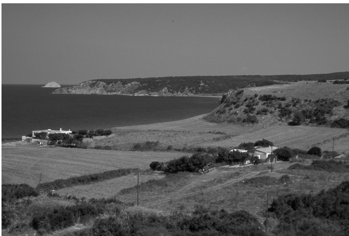
Abb. 6: Parion/Kemer, Bucht des Flußhafens, im Hintergrund Yumurta Adası