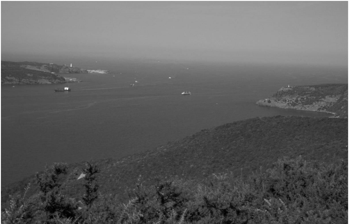
Abb. 20: Hieron/Anadolu Kavağı, Nordausgang des Bosphorus und Schwarzes Meer