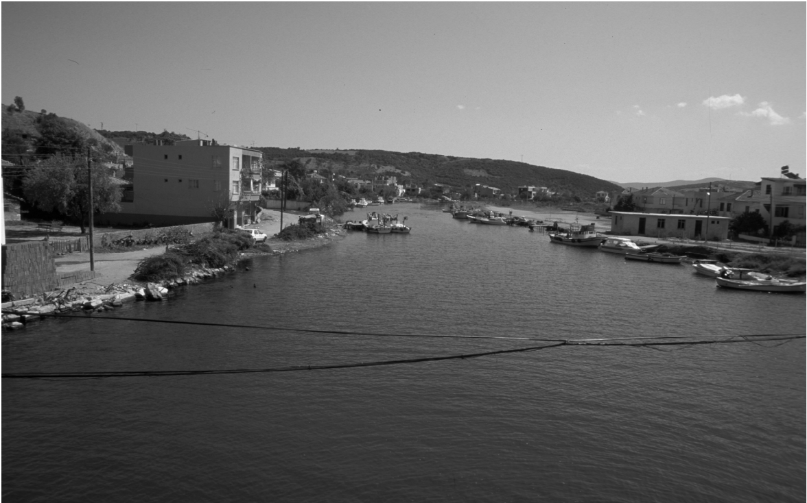
Abb. 7: Parion/Kemer, Flußhafen