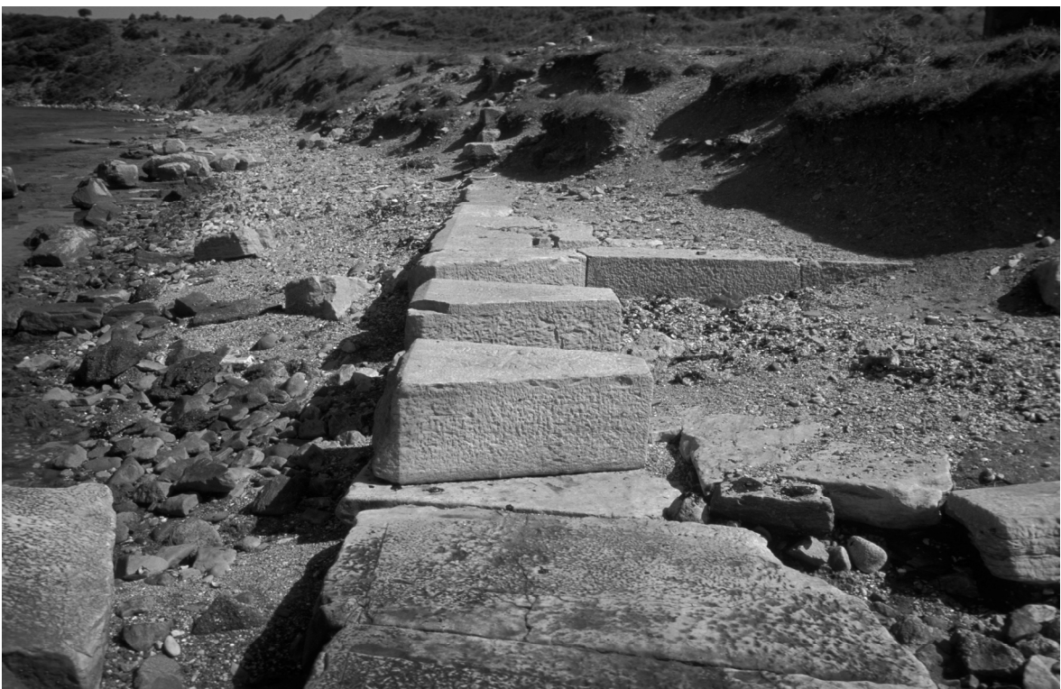
Abb. 8: Parion/Kemer, Kaianlagen des Nordhafens