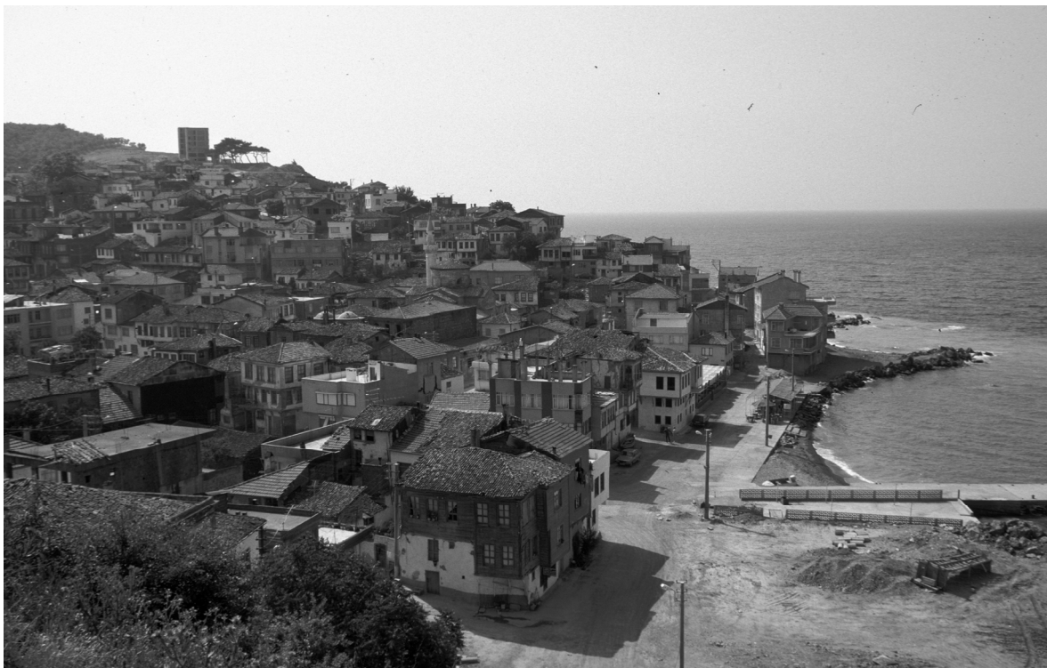
Abb. 16: Trigleia/Trilye/Zeytinbağı, Ort und Hafenbucht