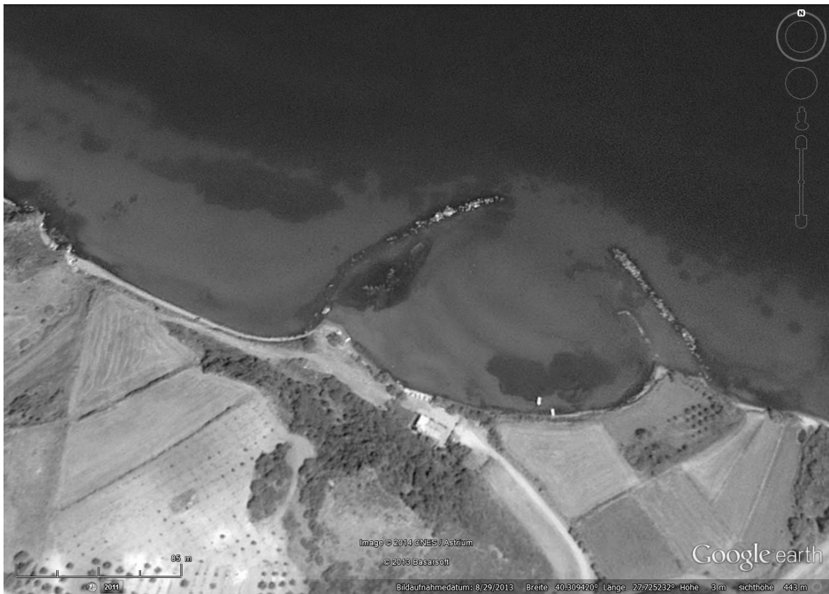
Abb. 15: Şirinçavuş, Hafen