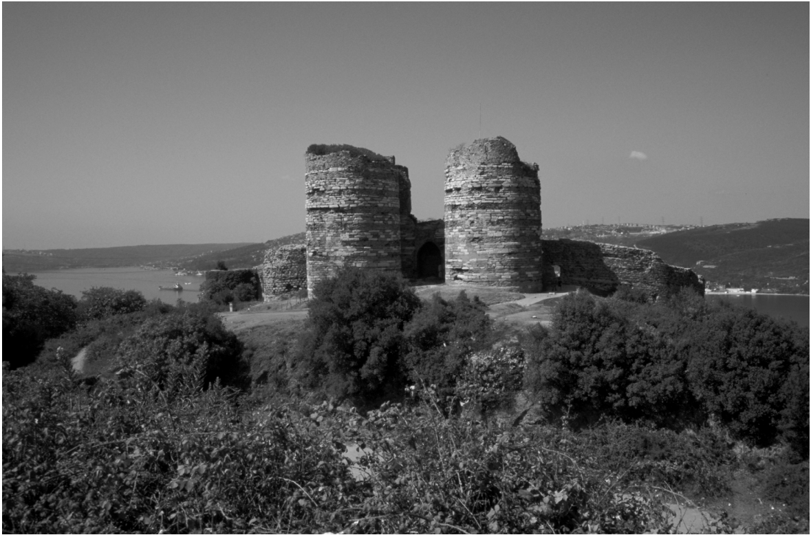
Abb. 19: Hieron/Anadolu Kavağı, Burg (Yoros Kalesi), Torfront