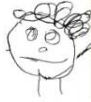
6. Resim. İnsan figürü (4 Yaş).

Boyama etkinlikleri onlar için oldukça zevklidir. İlk boyama deneyimleri kısa süreli olup, doğal olarak son derece denetimsizdir. Boyamalar genellikle uzun şeritler halinde olup, büyükçe lekeler şeklindedir. Renk kavramı yoktur, renkleri kısa fırça darbeleri halinde kullanırlar. Pastel boya kullanımında ise boyanın tutuşu genellikle avuç içindedir (henüz el kasları gelişmemiştir). Boyama işlemi yatay ve dikey çizgiler halindedir.