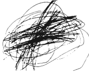
İki yaş (Karalamaları) çizgileri (Kellogg).

Çocuğun ilk karalama devresine geçişi, kas gelişimine, zeka, genel sağlık durumu ve resim çizmeye ayrılan zamana bağlı olarak birkaç hafta veya birkaç ay erken ya da geç olabilir. Genel olarak normal bir gelişim sürecini izleyen her çocuğun içgüdüsel olarak gerçekleştirdiği ilk eylemler rasgele, belirsiz, bilinçli olmayan, kontrolsüz karalamalar şeklindedir. Bu karalamalar sınırlılık-mekan kavramı olmaksızın yüzeyin her tarafını gelişigüzel kaplamaktadır. Olaylara, konulara ilişkin dikkat süreleri kısa ve değişkendir. Çevrelerine olan merak, ilgi ve öğrenme isteği heyecanlı bir şekilde devam eder, fakat çevresindeki nesnelere işlevselliğini 1,5 yaşından önce kavrayamaz. 1,5 yaşından itibaren çocuk nesnelere tanır, pastel boyanın çiziktirmeye yaradığını anlar, kitaplardan gösterilen resimlere karşı ilgi duyar, boya ve fırça bulduğunda ürkek bir şekilde renkleri yan yana veya üst üste boyayabilir. Bu arada kas gelişimine paralel olarak yer, duvar, kapı pencere ve masalar üzerine eline geçirdiği boya veya kalemler ile düzensiz bir şekilde çizmeye başlar.