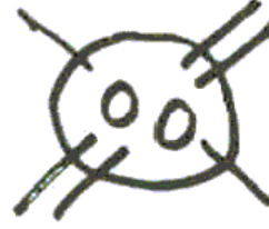
2. Resim. Toplanmış, bir araya getirilmiş şekiller (40 aylık).

Çok değişik biçimlerde çizilen dairesel şekiller veya "Mandalalar", binlerce çocuğun çizimlerinin analizini yapan Rhoda Kellog'a göre çizme ile sunuş-gösterme arasındaki son evre olarak görünmektedir. Carl Jung ve Rudolf Arnheim, mandalayı, (sinir sisteminin temel bir özelliği olarak) fiziksel bir koşuldan çıkan ve (en basit haliyle düzenlilik isteği nedeniyle) aynı zamanda psikolojik bir gereksinim olan, kültürden bağımsız, evrensel bir sembol olarak görmektedir (Gaitskell ve Hurwitz, 1970).