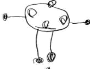
5. Resim. İnsan figürü (4 Yaş).