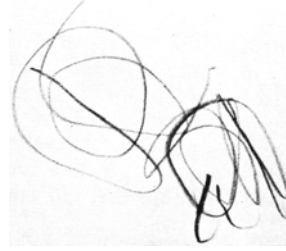
İki yaş (Karalamaları) çizgileri (Gaskell ve Hurwitz).